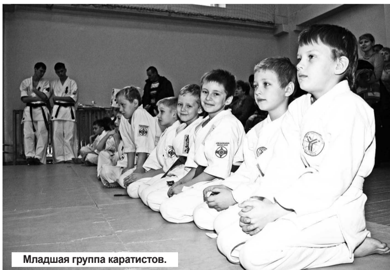
Младшая группа каратистов.