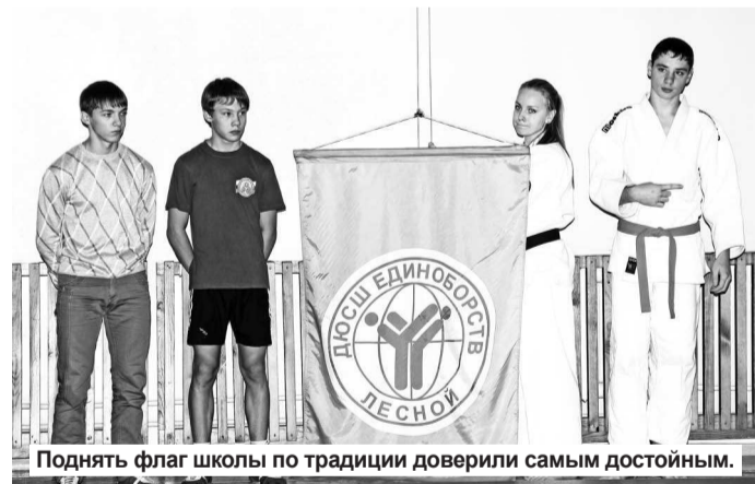
Поднять флаг школы по традиции доверили самым достойным.

После церемонии награждения состоялось показательное выступление спортивных отделений: дзюдо, каратэ и рукопашного боя. Примечательно то, что среди детей в кимоно было и немало девушек, которые эффектно демонстрировали навыки применения приемов различных видов единоборств. Не обошлось и без культурной программы, которую представил зрителям танцевальный коллектив «Э.Х.О». В завершение празднования дня рождения были устроены веселые