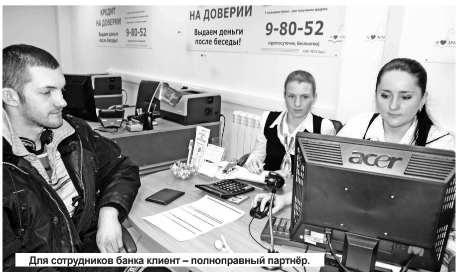
Для сотрудников банка клиент – полноправный партнёр.