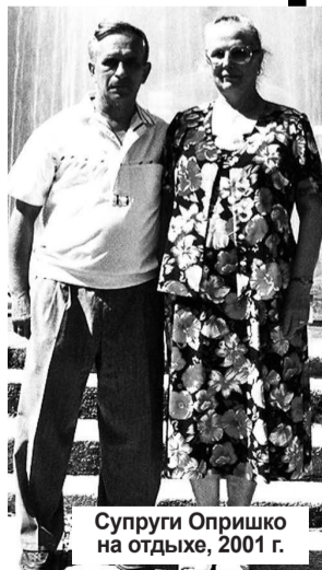
Супруги Опришко на отдыхе, 2001 г.

Откуда берутся силы у ветеранов? Почему люди, пережившие суровые военные и послевоенные годы, голод, наполненные лишениями годы юности, так крепко стоят на ногах и уверенно отстаивают свои позиции? Да потому, что у них есть внутренний стержень. Жизнь преподносит все новые и новые испытания, а они, словно «стойкие оловянные солдатки», только крепчают духом и с оптимизмом двигаются дальше. Они привыкли преодолевать трудности самостоятельно, с детства приучены «бороться, искать, найти и не сдаваться»!