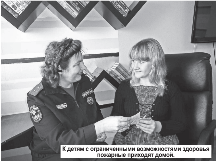
К детям с ограниченными возможностями здоровья пожарные приходят домой.

Ребенок приходит в этот мир для долгой и счастливой жизни. Но, к сожалению, не всегда так бывает.