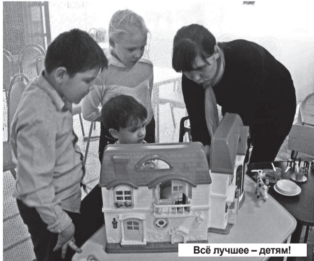
Всё лучшее - детям!

Смех, а тем более детский, - один из самых чудесных звуков. Дети всегда искренне радуются даже самым простым вещам.