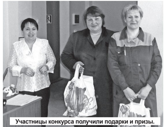
Участницы конкурса получили подарки и призы.