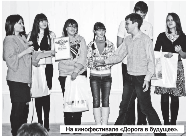
На кинофестивале «Дорога в будущее».

25 ноября «Молодая гвардия Единой России» провела Нижнетуринский кинофестиваль «Дорога в будущее», в котором приняли участие все желающие. Им было предложено создать проект видео ролика на тему «Каким я вижу город после выборов?». На конкурсе были представлены команды из Верхней Туры, Лесного, Качканара и Нижней Туры.