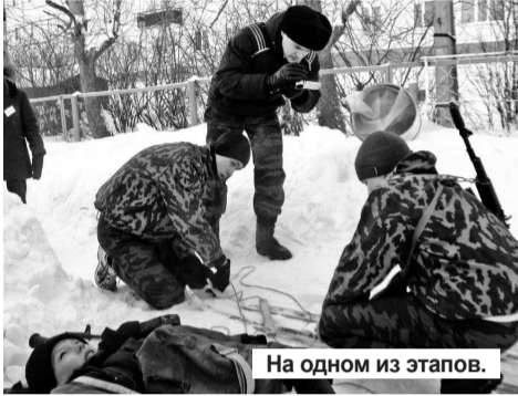
На одном из этапов.

классных занятий учащейся молодежи, воспитывающей у подростков общую культуру, доброту, коллективизм, самостоятельность и чувство ответственности за судьбу Отечества, повышение роли юнармейского движения и формирование у подростков морально-психологической устойчивости в преодолении трудностей, обобщение работы лучших юнармейских отрядов образовательных учреждений округа.