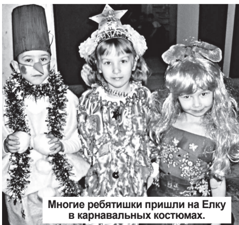
Многие ребята пришли на Елку в карнавальных костюмах.

Накануне Нового года традиционно прошла встреча детей работников ООО «НТЭАЗ Электрик» с Дедом Морозом, Снегурочкой и другими сказочными героями. Взрослые и дети смогли посмотреть новогоднюю сказку «Горыныч возвращается, или Новогодний переполох в Лукоморье».