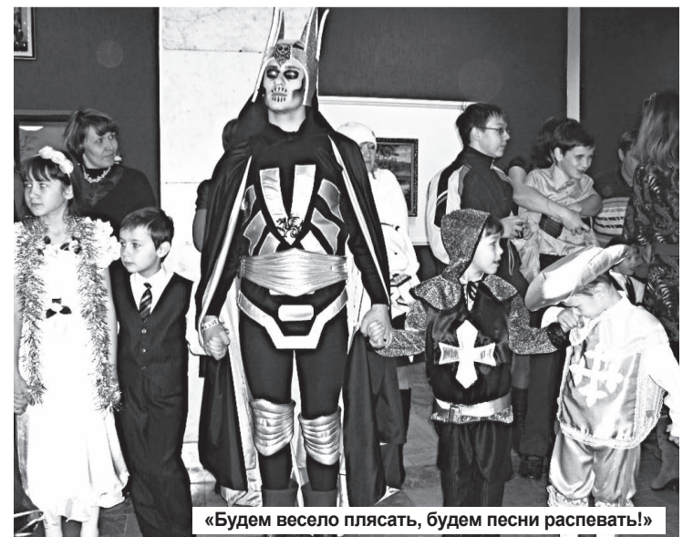
«Будем весело плясать, будем песни распевать!»