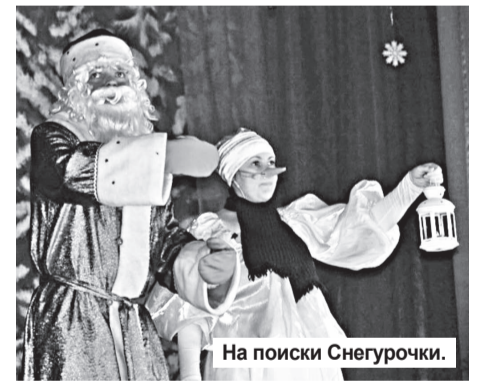
На поиски Снегурочки.