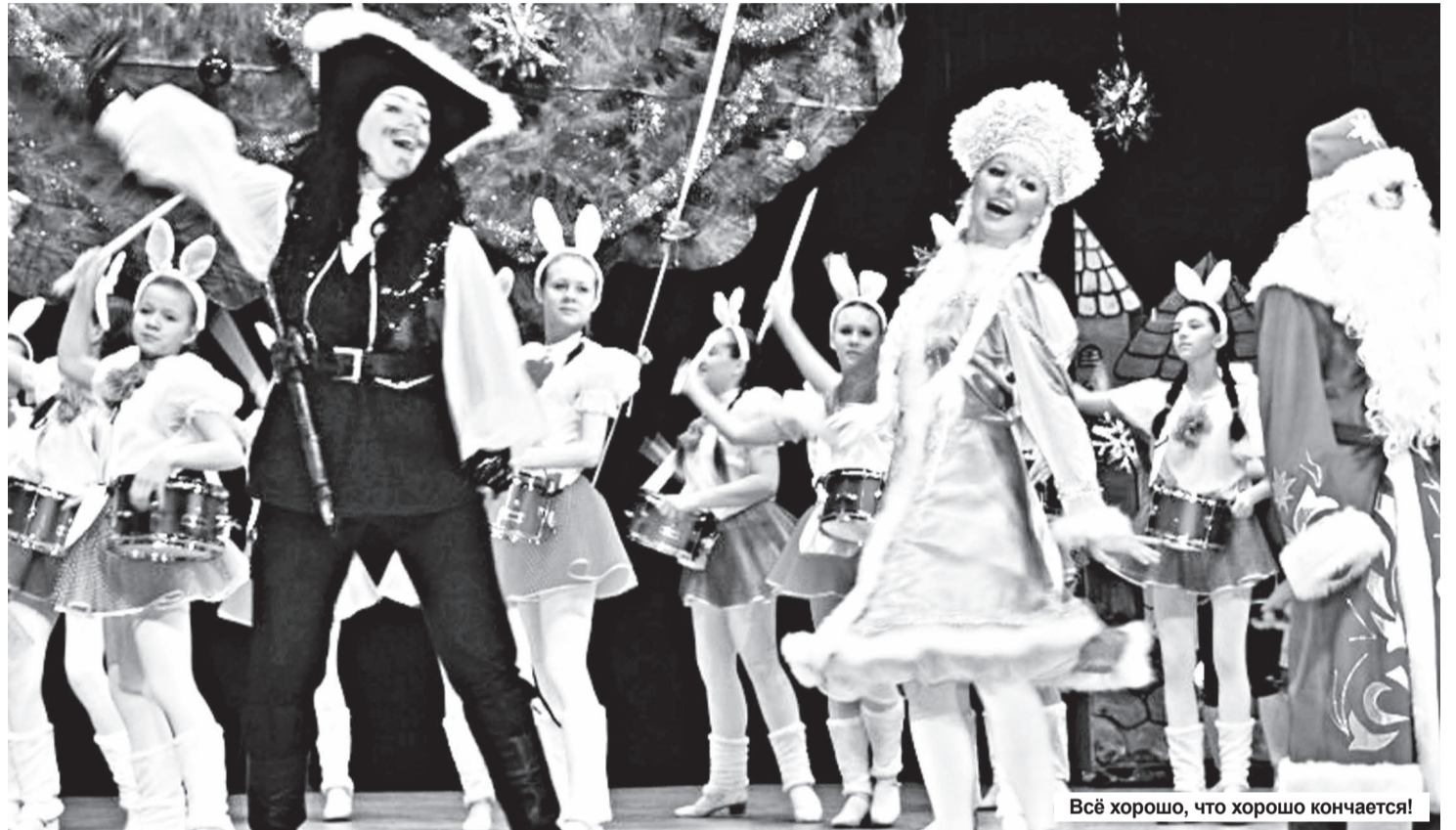
Всё хорошо, что хорошо кончается!

Новогодние спектакли в Детской музыкальной и Детской хореографической школах это всегда заметные события в культурной жизни города. Традиция ставить новогодние сказки появилась несколько лет назад, и если в первые годы давались один-два спектакля, то сейчас – около десятка в каждой школе, и все с аншлагом, и желающих попасть на них все равно больше, чем могут залы вместить!