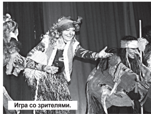
Игра со зрителями.