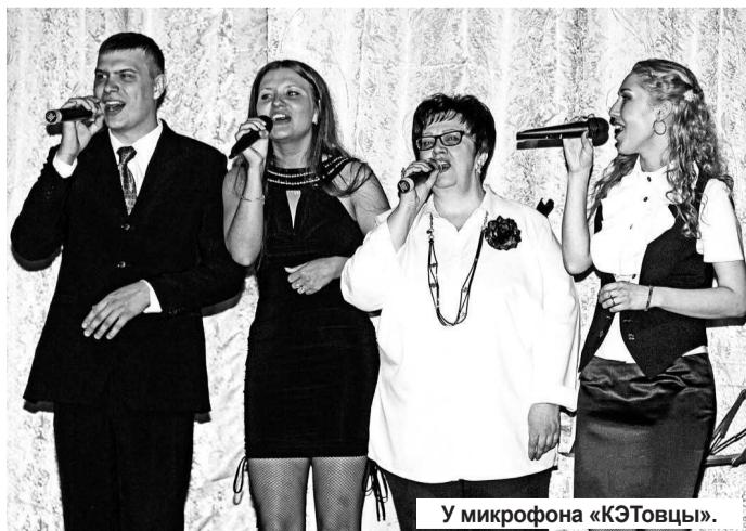
У микрофона «КЭТовцы».