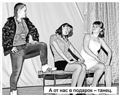
А от нас в подарок – танец.