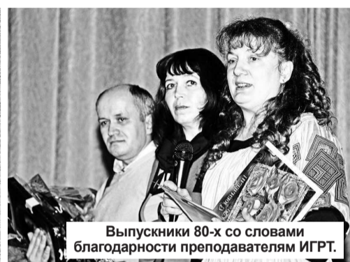
Выпускники 80-х со словами благодарности преподавателям ИГРТ.