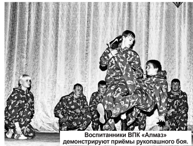
Воспитанники ВПК «Алмаз» демонстрируют приёмы рукопашного боя.