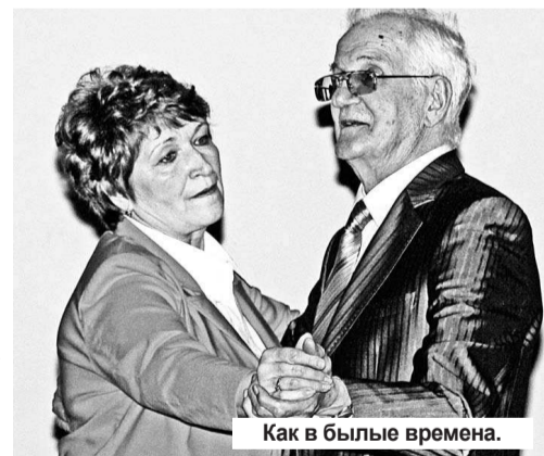
Как в былые времена.