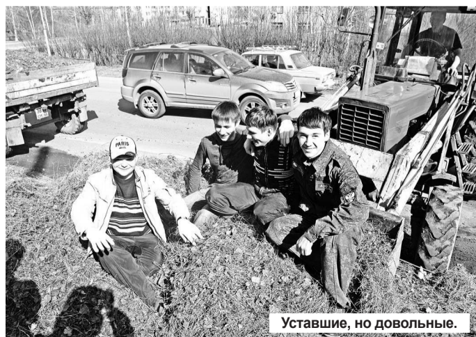
Уставшие, но довольные.