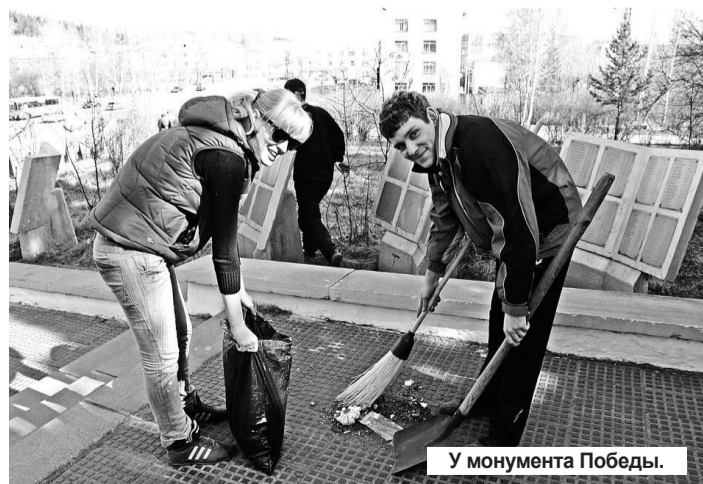
У монумента Победы.