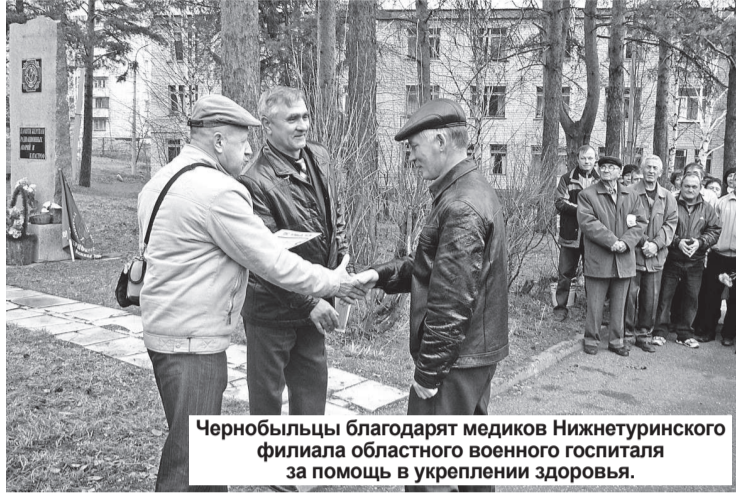
Чернобыльцы благодарят медиков Нижнетуринского филиала областного военного госпиталя за помощь в укреплении здоровья.