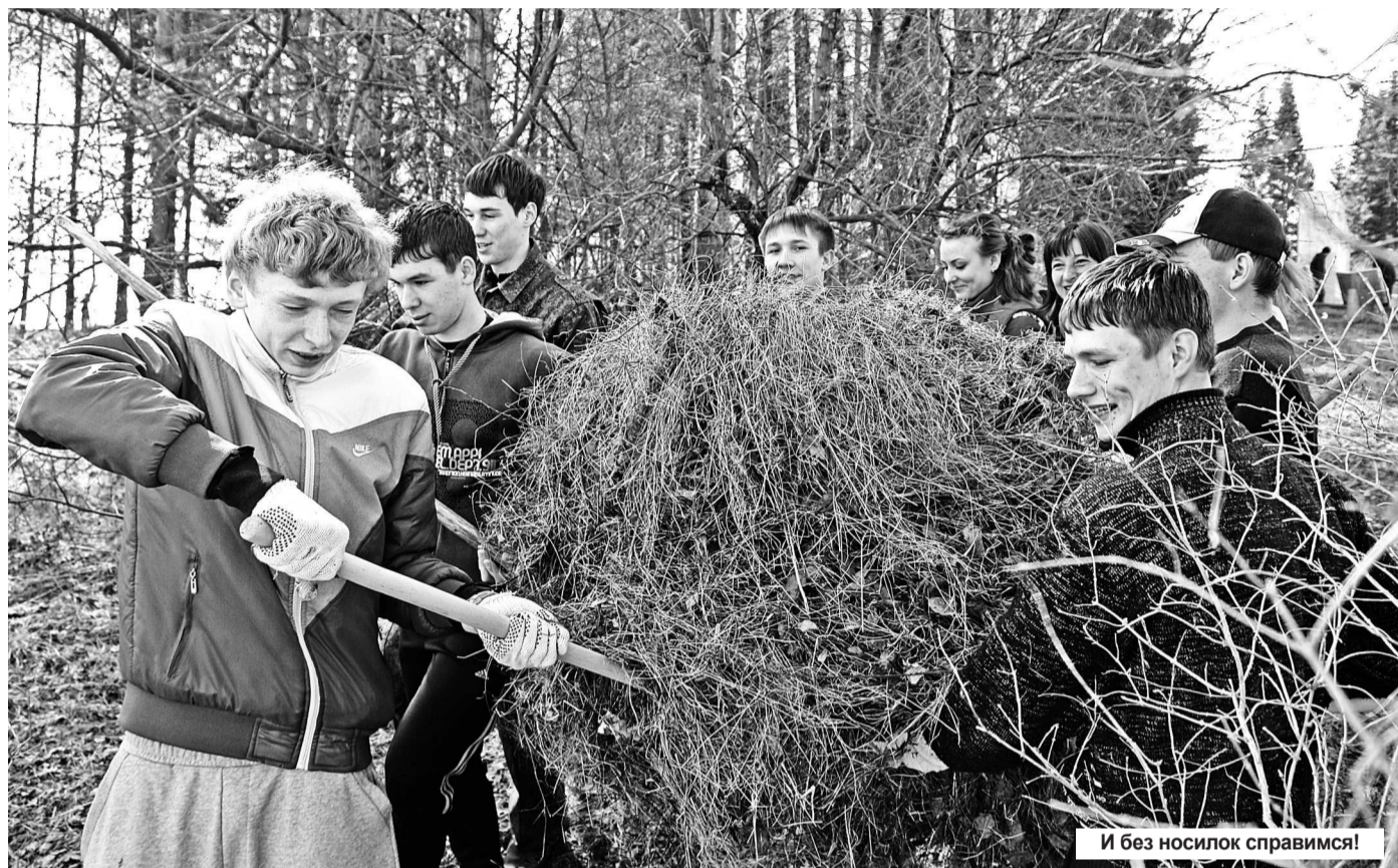
И без носилок справимся!