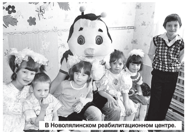
В Новолялинском реабилитационном центре.