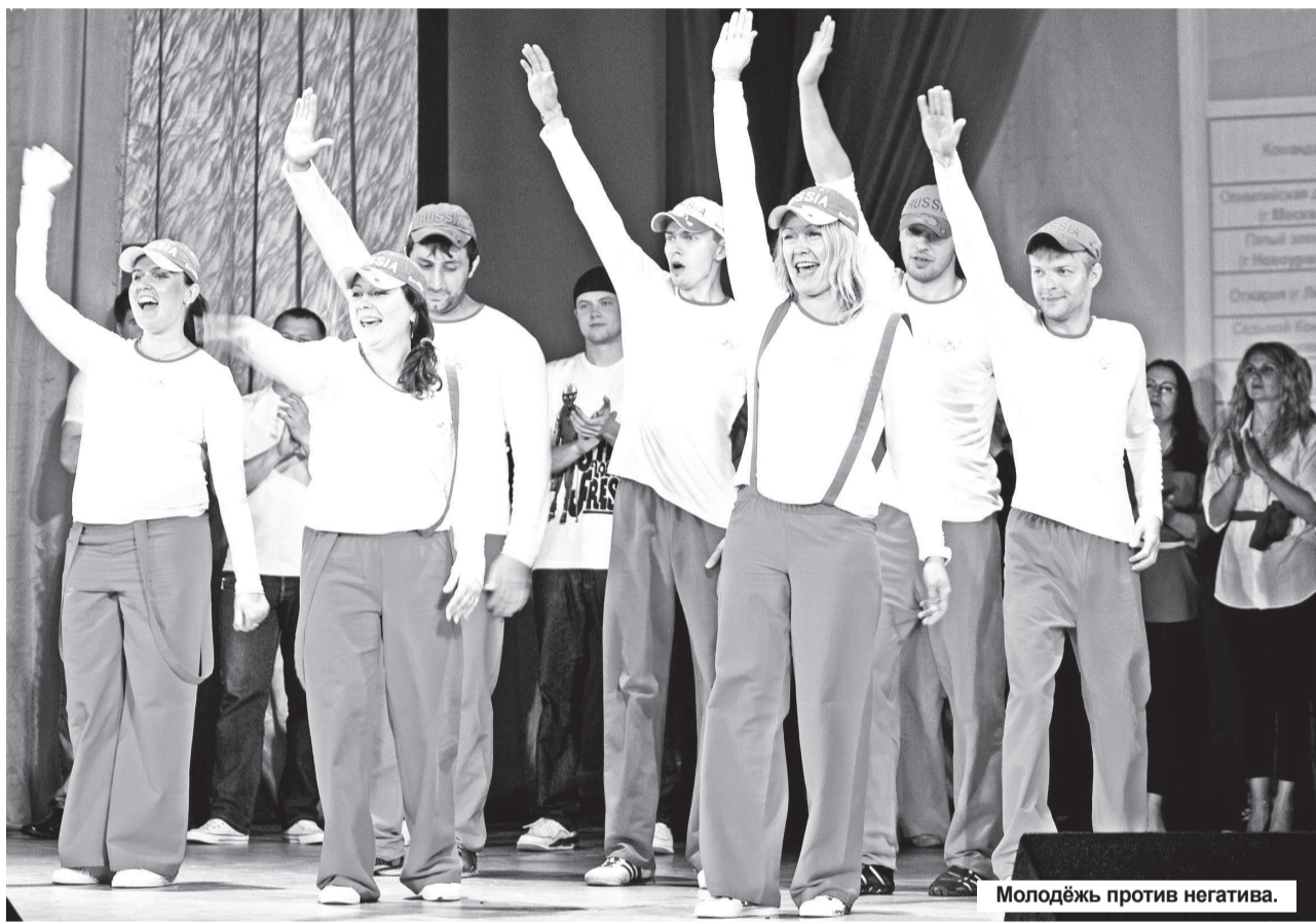
Молодёжь против негатива.

Праздничные игровые и развлекательные программы пройдут в детских подростковых центрах города, Доме культуры «Родник», клубе «Звезда» и клубе поселка Чащавита.