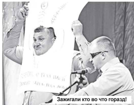
Зажигали кто во что горазд!

Игроки приятно удивляли шутками, заражали смехом всех присутствующих, но за этим стояло волнение, внутреннее напряжение и, конечно, вера в победу. Увы, по условиям соревнования определялся всего один победитель. По общим результатам фаворитами IV игр КВН среди специальных подразделений МЧС России стала команда «Горячие головы» (г. Воткинск). Она получила путевку в финал КВН, который состоится в ноябре в Москве. С разницей в 1,38 балла команда хозяев «Отжария» (СУФПС № 6 МЧС России) стала второй, третье место присуждено команде из г. Северодвинска с очень профессиона-