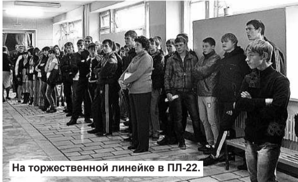
На торжественной линейке в ПЛ-22.

Затем будущие рабочие разошлись по классам, чтобы уже там продолжить разговор со своими преподавателями. Беседовать же педагогам пришлось с небольшой аудито-