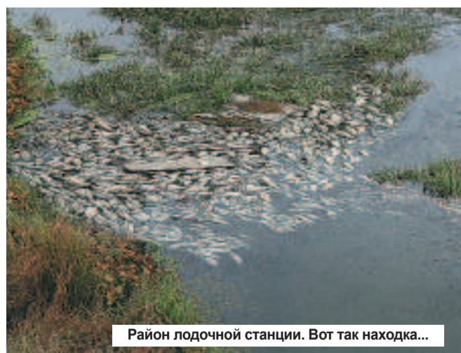
Район лодочной станции. Вот так находка...

указанном садоводами месте. И увиденное поразило меня до глубины души: во-первых, доступ на сооружение был открыт для всех желающих, оно никем не охранялось. Во-вторых, вся территория заросла кустарниками и травой. Судя по всему, этот коллектор действительно забросили. Нашел я и место его поломки, откуда бурлящим потоком в направлении садов стекали явно необеззараженные отходы. Запах там в тот момент стоял отвратительный. Во время своей прогулки по этим местам встретил человека, тоже садовода, поведавшего мне о том, что эти очистные стоят на балансе цеха