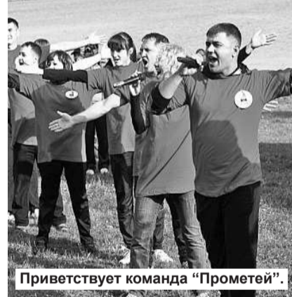
Приветствует команда «Прометей».

Да, а итоги подводить все равно надо! И надо называть лучших! Хотя, сразу скажу, все были просто замечательные молодцы! Потому что готовились, потому что фантазировали, сочиняли, тренировались! Потому что пришли на праздник целыми семьями, потому что с новой стороны узнали кол-