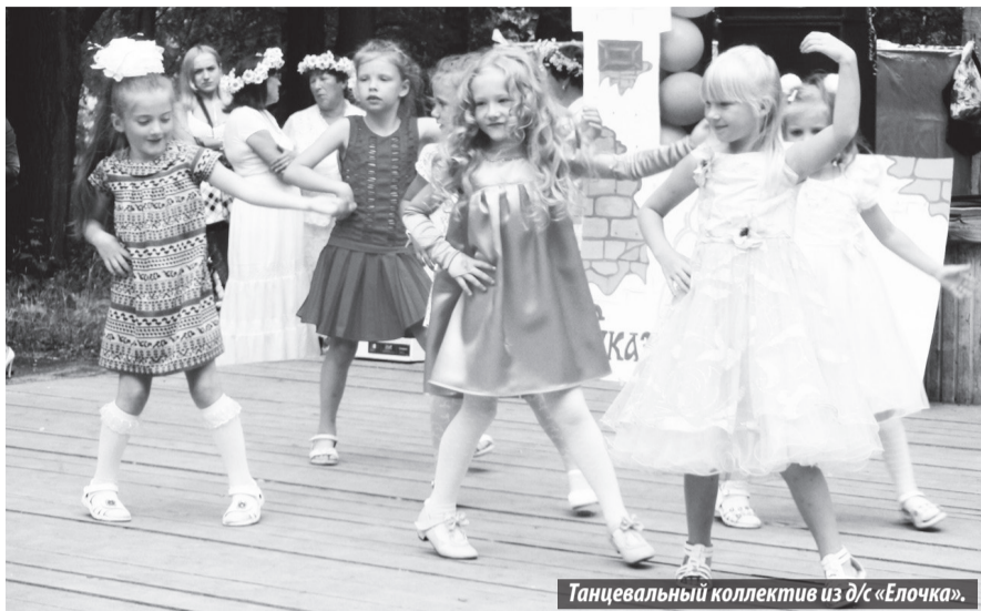
Танцевальный коллектив из д/с «Елочка».

13 июля состоялось празднование 189-летия Иса