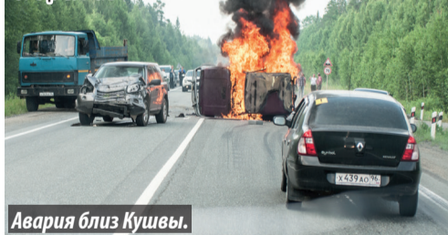
Авария близ Кушвы.

На трассе Серов – Екатеринбург сгорел автомобиль