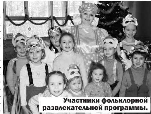
Участники фольклорной развлекательной программы.

И, действительно, с пользой для детей и очень весело пролетело время, проведенное ими в воскресный день в нашем парке. Следующий подобный праздник для