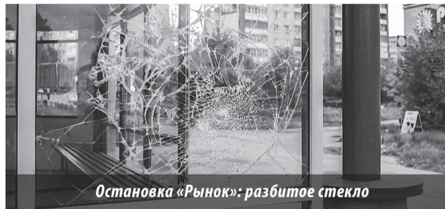
Остановка «Рынок»: разбитое стекло