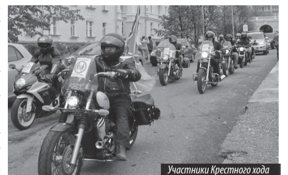
Участники Крестного хода