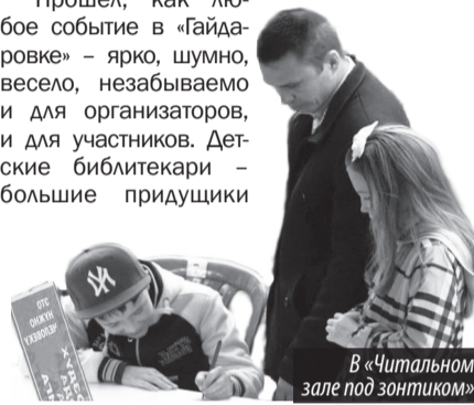
В Читальном зале под зонтиком

Прошел, как любое событие в «Гайдаровке» – ярко, шумно, весело, забываемо и для организаторов, и для участников. Детские библиотекари – большие придумщики