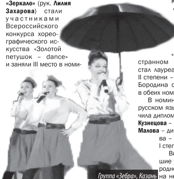
Группа «Зебра», Казань