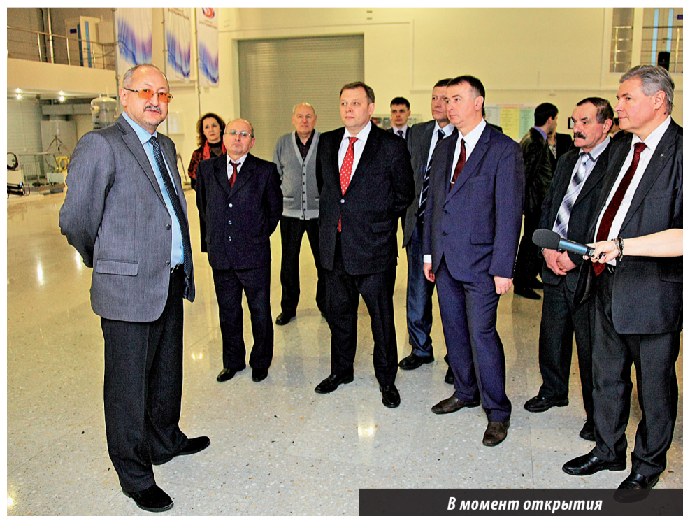
В момент открытия

Участникам торжества предложили совершить экскурсию по выставочному залу первого и второго этажей, где представители комбината показали гостям образцы продукции комбината и рассказывали об ее приме-