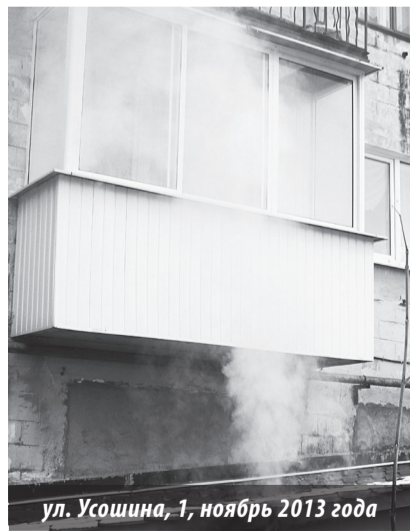
ул. Усошина, 1, ноябрь 2013 года

Запах в момент таких сливов говорит сам за себя, что это не что иное — натуральные канализационные стоки. Ни грунтовые воды, ни вода из труб, а именно отходы. Чего даже некоторые работники кафе не скрывают. Так что летом во дворе, даже в жаркую сухую погоду, всегда грязно, вонь и мухи. Зимой еще хуже, здесь образуется довольно толстый слой льда, в котором при каждом новом сбросе отработанной воды образуется канава. В эту канаву заезжают грузовики, что привозят продукты в здешние магазины, и просто-напросто тут буксуют, досажая жильцам дома еще и шумом, травя их выхлопными газами. Пройти ночью по такому льду, да еще с промоинами, с учетом отсутствия в городе нормального освещения просто не реально. За зиму лед здесь будет не менее полуметра в высоту, и таять ему придется весь май. А дальше все лето грязь. Грязь и зловоние. А как же санитарные нормы? Похоже, те, кто их должен соблюдать, особо по этому поводу не заморачиваются. Хоть бы догадаться пробить канавку, уложить в нее шланг и пустить воду в сточную канаву, она здесь рядом. Конечно, и это не выход, ведь нечистоты рядом с жильем — это очень серьезно. Министерство природ-