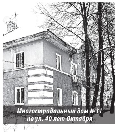
Многоэтажный дом №31 по ул. 40 лет Октября

Напомню: этот дом хоть и не признан аварийным, но катастрофы различного рода в нем происходят постоянно. То с полом в подъезде проблемы, то с крыши вместе с талым снегом сходят куски шифера, который не менялся, по наблюдениям жильцов, очень давно, то кирпичи с основания кровли сыплются... Один из самых вопиющих случаев — обрушение осенью прошлого года в подъезде потолочного перекрытия, что чуть не привело к трагедии. В общем, дом разваливается на глазах,