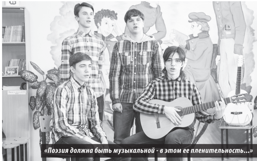
«Поэзия должна быть музыкальной - в этом ее пленительность...»

Для участия в соревнованиях прибыли 23 команды из 14 городов Северного управленческого округа Свердловской области. Участники были разбиты на три группы: младшая, 1-я группа — 6-8 классы; 2-я — 9-11 классы, 3-я — специализированные (кадетские) классы и военно-патриотические клубы, возраст участников до 17 лет