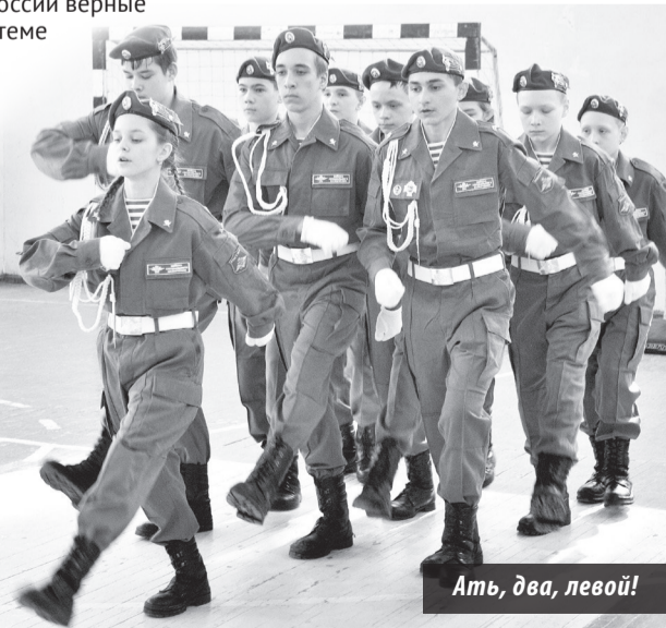
Ать, два, левой!