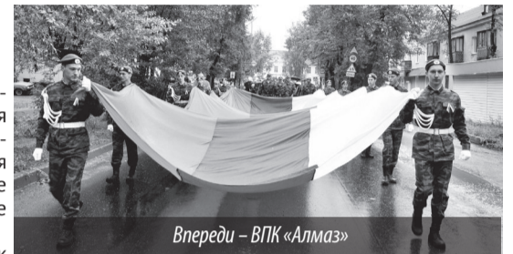
Вперед! — ВПК «Алмаз»

К сожалению, погода внесла коррективы, и митинг с торжественным концертом