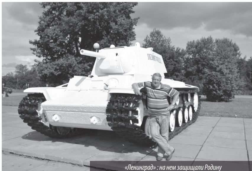
«Ленинград»: на нем защищали Родину

Самое главное, в них все напоминает о войне. Опушки и поля изрезаны заросшими траншеями, кое-где четко видны следы землянок. В прошлом тут шли бои, и оборонительных сооружений строили много. На вопрос, зачем нужны землянки в густом лесу, мне рассказали, будто в войну в них скрывались от гитлеровцев мирные жители. Уходя в леса, они вводили с собой скот и брали вещи первой необходимости, сколько могли унести.