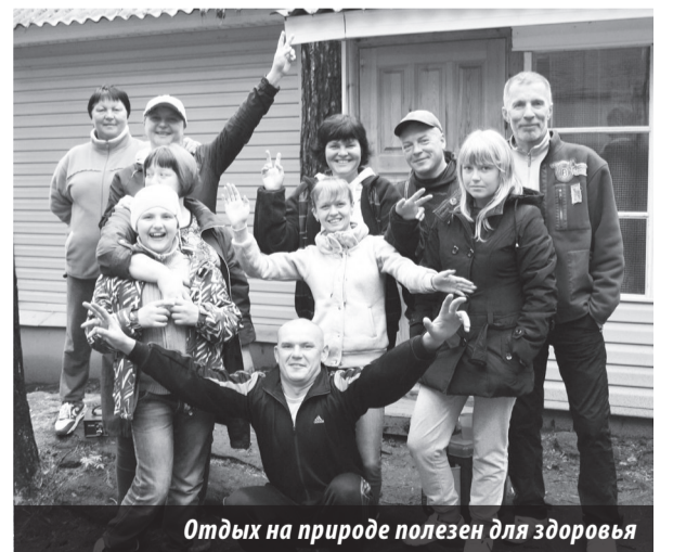
Отдых на природе полезен для здоровья

К тому же информационная комиссия профкома объявила о подготовке к фотоконкурсу «Лето – это маленькая жизнь!». Думается, на Таватуйе должны получиться отменные фотоснимки, которые удивят