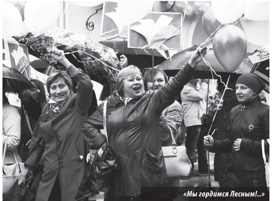
«Мы гордимся Лесным!..»

Следует отметить, что помимо представителей культуры к шествию основательно подготовились члены молодежной организации комбината «Электрохимприбор», Управления образования, предприятий «Урал-Мебель», «ПромСтройСити».