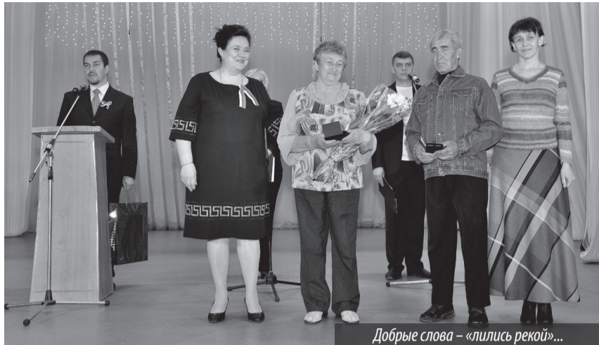
Добрые слова — «плились рекой»...