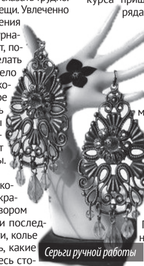
Серьги ручной работы