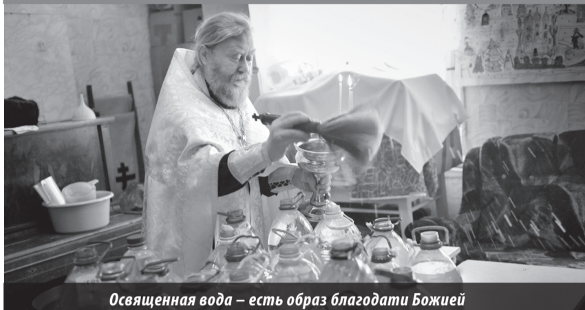
Освященная вода — есть образ благодати Божией

В дни Крещения Господня в проруби со святой водой окунались сотни лесничан и нижнетуринцев