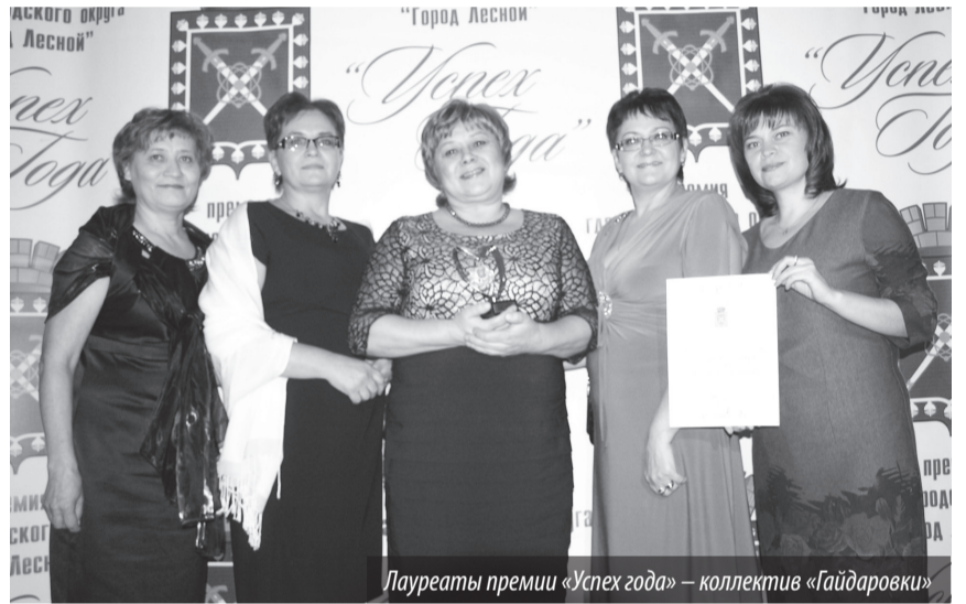
Лауреаты премии «Успех года» — коллектив «Гайдаровки»

И вновь ковровая дорожка, салюты, фанфары, аплодисменты. Под эти торжественные звуки номинанты городской премии «Успех года-2013» проследовали в большой зал СКДЦ «Современник».