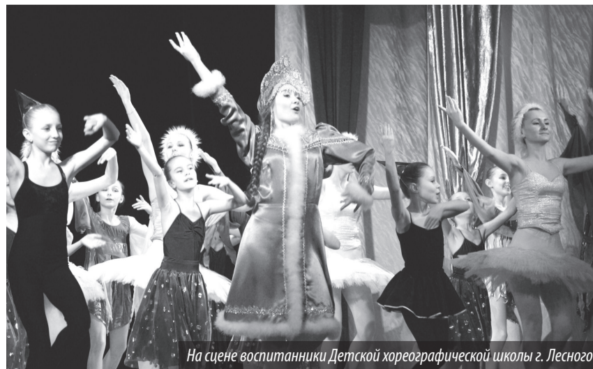
На сцене воспитанники Детской хореографической школы г. Лесного