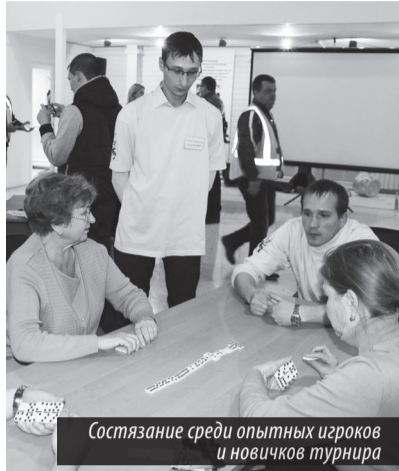
Состязание среди опытных игроков и новичков турнира

Н. МУХИНА , председатель информационного комитета ПК-391