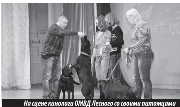
На сцене кинологи ОМВД Лесного со своими питомцами

Вторая часть празднования прошла вечером этого же дня в «Современнике», куда многие представители ОМВД г. Лесного пришли вместе с членами своих семей. Надо отметить, что концертная программа была подготовлена силами самого отдела. Отрадно, что наши полицейские, как мужчины, так и женщины, не только добросовестно выполняют свои служебные обязанности, но и обладают артистическим талантом. К подготовке концертных номеров привлекли и ребяташек служителей закона, и, чувствовалось, что это им доставило большое удовольствие.