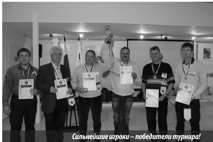
Сильнейшие игроки — победители турнира!

(Продолжение на стр. 15)