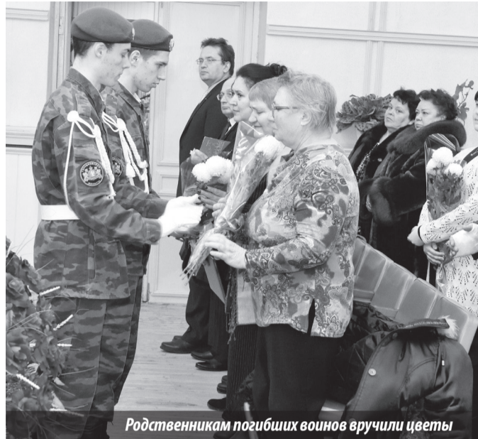
Родственникам погибших воинов вручили цветы

Вот эти памятные даты и отмечали 9 декабря в актовом зале администрации Нижнетуринского городского округа представители общественных организаций ветеранов боевых действий Качкана-