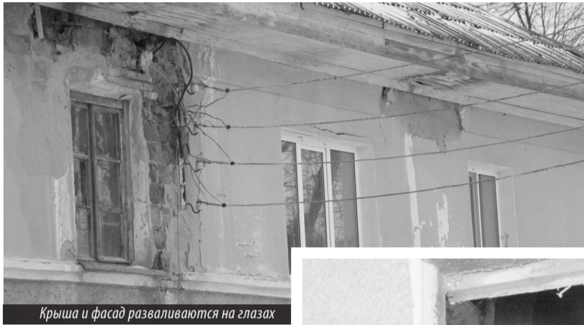
Крыша и фасад разваливаются на глазах

Отчаявшись, жильцы стали звонить в единую аварийную службу по НТГО, у них просить помощи, но и там их ничем не обнадежили: «Раз вашим домом управляет частная компания, мы никаких претензий от вас принять не можем, выходите из положения сами». Нижнетуринцы уж и самостоятельно пробовали решить проблему, пытались откачать воду купленным в магазине насосом, но он быстро вышел из строя. Страдальцы негодуют: «Обиваем пороги разных инстанций, куда только ни стучались, но нас везде отфутболивают».