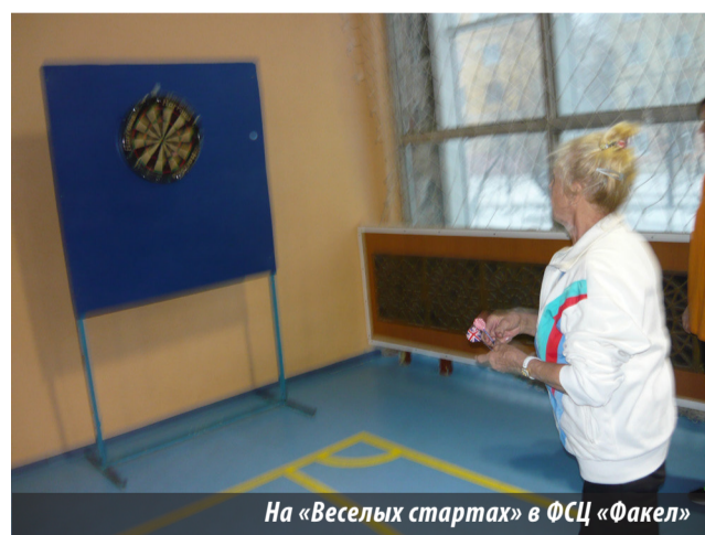
На «Веселых стартах» в ФСС «Факел»

Своеобразную эстафету прошли 6 команд, а после под-