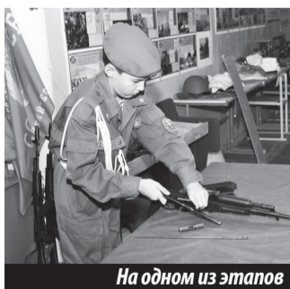
На одном из этапов