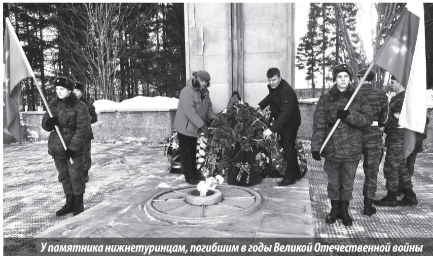
У памятника нижнетуринцам, погибшим в годы Великой Отечественной войны