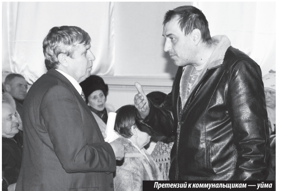
Претензий к коммунальщикам — уйма