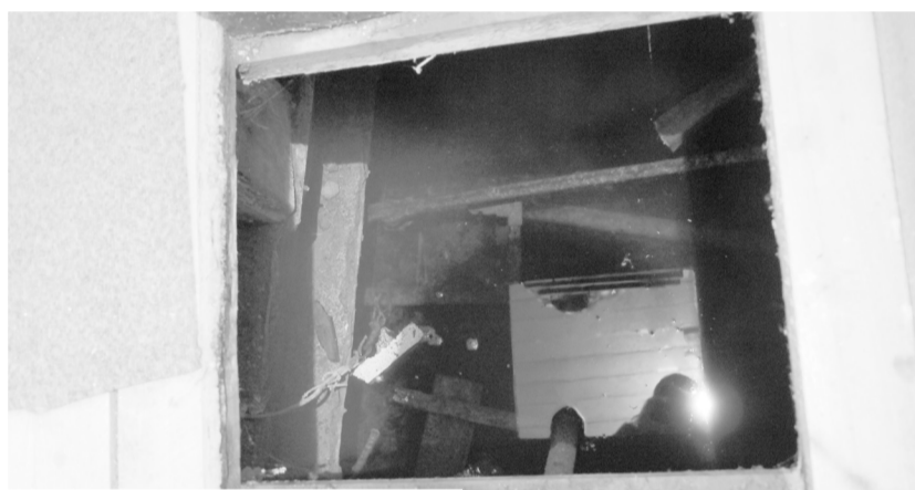
Подвал затопило горячей водой

И вот, не прошло и года, как новая напасть... Где-то под домом недавно рвануло так, что, по словам жителей, горячая вода заполнила подвал сначала на два метра, а потом и выше поднялась, стала просачиваться через щели пола первого этажа. В результате весь подъезд пропитался влагой, в нем стоит пар, от чего видимость тут временами нулевая. Но хуже всего, что