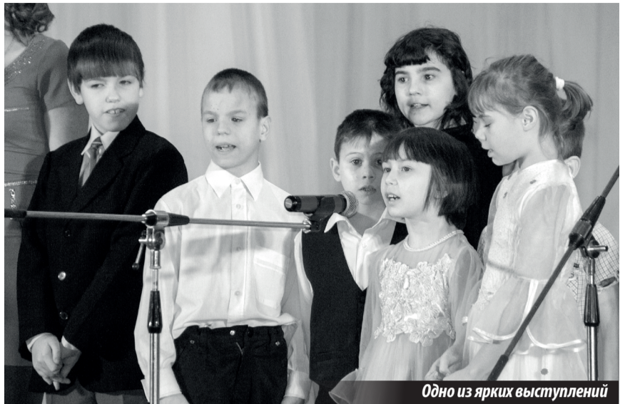
Одно из ярких выступлений

В заключение хочется добавить: глядя на работы и выступления ребят, еще раз понимаешь, насколько талантливы наши