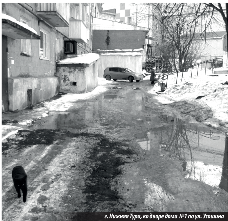
г. Нижняя Тура, во дворе дома №1 по ул. Усошина

О проблемах, которые никто не хочет решать