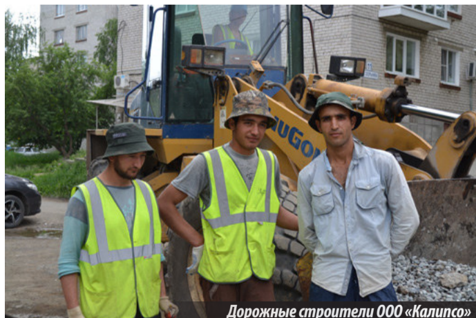
Дорожные строители ООО «Калипсо»

Да оно и понятно: ехать на второй передаче, выворачивая руль то вправо, то влево, минув множество колдобин, дело не самое приятное. И утомительно, и машину гробишь, да и бензин сжигаешь напрасно. И, казалось, этой истории не будет конца, ремонта наших дорог не дожидаться. Но, как говорил известный персонаж, лед тронулся... Ремонт все же начался и идет полным ходом. Подтверждение тому — дорожные работы на улице Скорынина, что горожане наблюдают сегодня. И это не простой, косметический, ямочный ремонт, начата полная реконструкция улицы. Помимо реставрации дорожного полотна, ведутся работы по обустройству тротуаров по обе стороны проезжей части, автостоянок, предусмотрены места для посадки цветов. Цветы, кстати, уже радуют глаз, пусть пока не по всей улице, но лиха беда начало. Установленные бордюры выглядят аккуратно. Будет положено новое асфальтовое покрытие. В итоге улица должна обновиться кардинально. Все работы ведутся силами бригады строителей