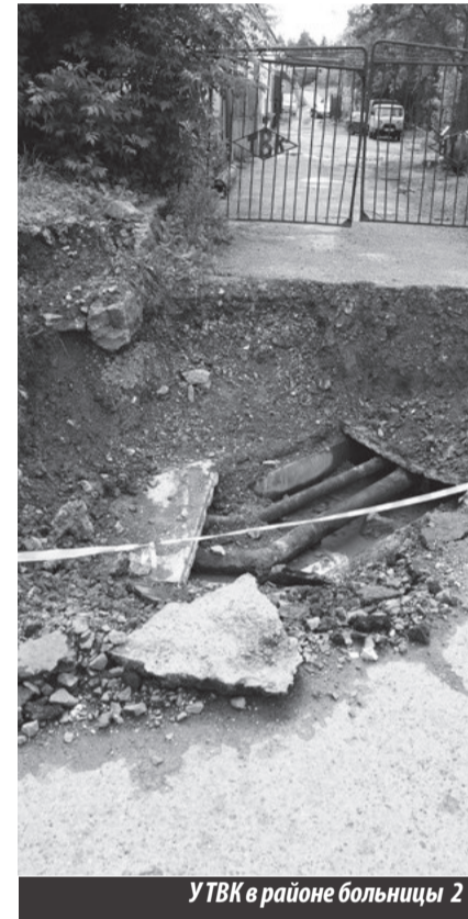
УТВК в районе больницы 2

Требую в хамской форме опровержения материала, вышедшего в газете «Резонанс» № 26 от 25.06.2015 под названием «Дела с „коммуналкой“ хуже некуда», где на поверхность вылезли смачные «красоты» местного муниципально-частного партнерства в области ЖКХ, и «брызгая слюной», мол, опубликованная информация — клевета, Трегубов начал «прыгать» на корреспондента, подготовившего мате-