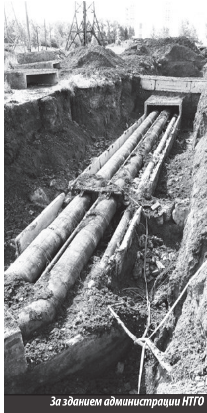
За зданием администрации НТГО

Не единожды активисты выходили на средства массовой информации, в том числе областные, озвучивая им, как обстоят дела в реальности. На какие ухищрения идут управляющие компании, списывающие все потери на жильцов, ресурсоснабжающая компания-новичок «ГЭСКО», неспособная даже представить отчет о намеченном и проделанном объеме работ по подготовке Н. Туры к предстоящей зиме.