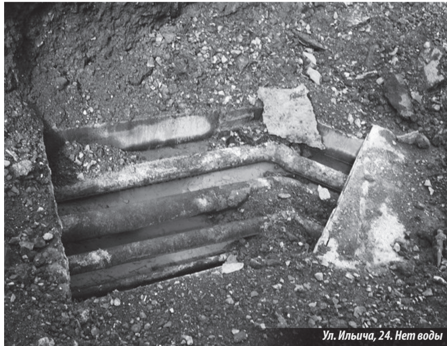
Ул. Ильича, 24. Нет воды