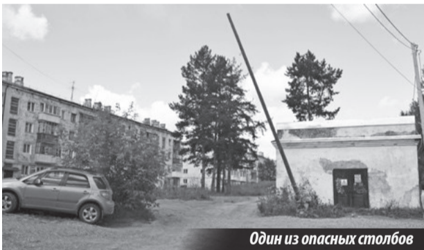
Один из опасных столбов

В ТРИДЦАТЬ втором номере газеты «Резонанс» за этот год есть заметка под названием «Каждый день в напряжении» о гнившей опоре ЛЭП, что находится на улице Драйной в поселке Ис.