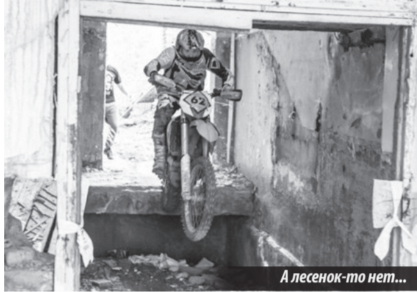
А лесенок-то нет...

СПОРТСМЕНЫ Лесного и Нижней Туры не принимали участия в этих соревнованиях по обидной и банальной причине —