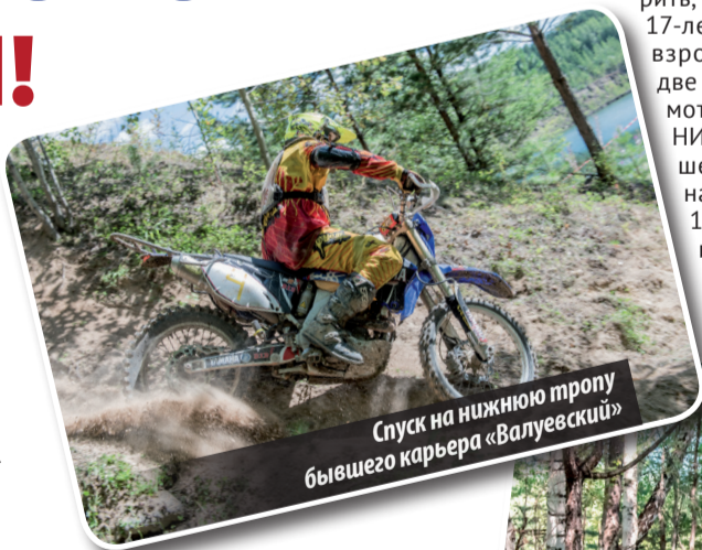
Спуск на нижнюю тропу бывшего карьера «Валуевский»

Субботние соревнования проходили на основе эндуро-спринт, но имели свою особенность. Гонка осуществлялась по кроссовому кругу длиной около 3 км по нескольким уникальным участкам — скоростным с грунтовым покрытием, лесным с травяным покрытием, которое размесили в грязь, небольшому заболоченному участку. Самый протяженный участок проходил в карьере по камням, самый необычный — в руинах разрушенных зданий, где гонщикам пришлось ехать по плитам, камням, в проемах бывших дверей, ворот и даже окон. Казалось, организаторы сделали все возможное для того, чтобы угробить технику и людей. Но такое могло показаться только