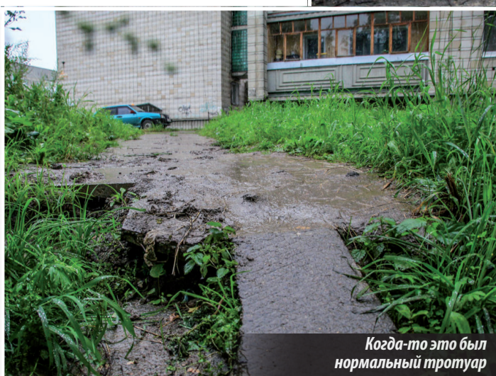
Когда-то это был нормальный тротуар

находилась до раскопок. Для настоящих хозяйственников это будет несложно, и времени понадобится не так много, и люди их за это только благодарить будут. Иначе и до беды недалеко».