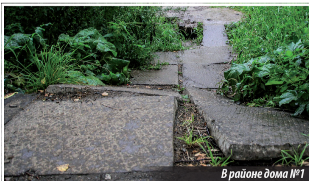
В районе дома №1 по ул. Декабристов

а альтернативы обхода нет. Поэтому хочу обратить внимание администрации Нижнетуринского городского округа, городских служб благоустройства на данную проблему, попросить их принять меры по приведению пешеходной дорожки в надлежащее состояние, в каком она