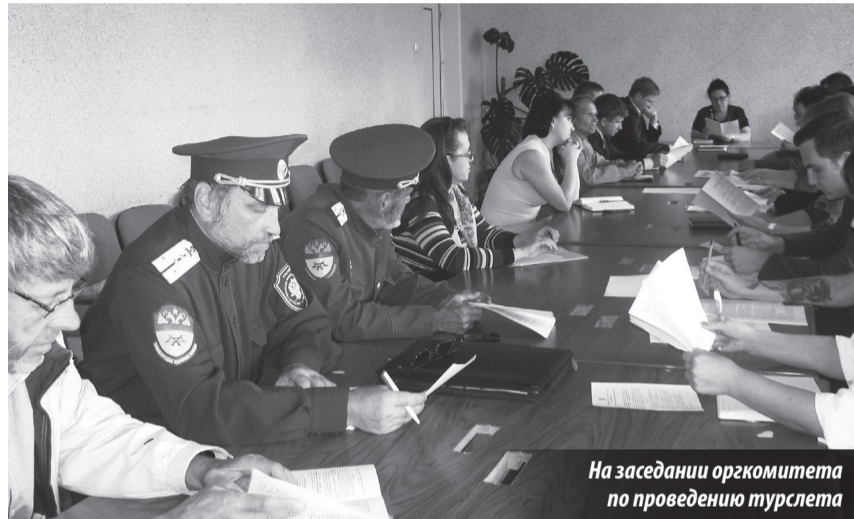
На заседании оргкомитета по проведению турслета

Центральная городская библиотека им. Д.Н. Мамина-Сибиряка приглашает молодежь Нижней Туры принять участие в викторине «Уральский народ». Победителя ждет приз! Телефон для справок 2-08-30, сайт — tbib.ru . Ответы ждут по адресу: ул. Машиностроителей, 17а (читальный зал для взрослых, 3-й этаж).