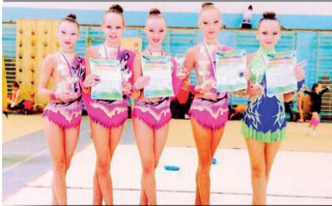
Гимнастки из г. Лесного выступили успешно

Региональный турнир по художественной гимнастике