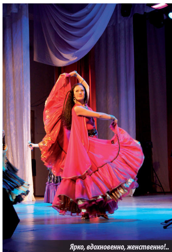
Ярко, вдохновенно, женственно!..