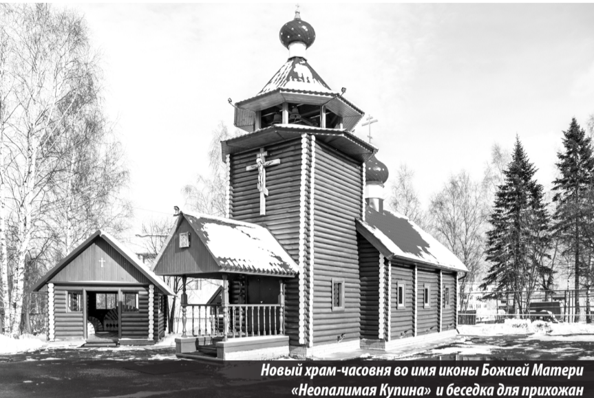
Новый храм-часовня во имя иконы Божией Матери «Неопалимая Купина» и беседка для прихожан

В Лесном состоялся чин освящения нового православного храма-часовни