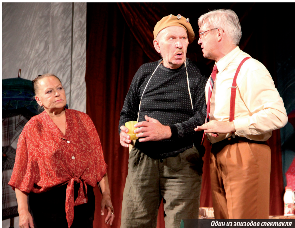
Один из эпизодов спектакля

В завершение хочется добавить, что на этом гастрольная эпопея именитых российских актеров в нашем городе не заканчивается, как сообщили в СКДЦ «Современник», в середине ноября ожидается приезд еще одной труппы с постановкой — «Заложники любви», собирающей по всей стране большие залы, которую возглавит Александр Панкратов-Чёрный. Поэтому тем, кто считает, что прошляпил «Незамужнюю», можно будет попасть на грядущую пьесу.