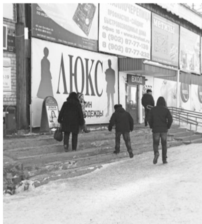
У бывшего ресторана «Кедр»

Третье место рейтинга без предвзятостей отдано бывшему ресторану «Кедр», на ул. Усошина, 2. По парковке и пешеходной зоне нареканий, в общем-то, нет. Единственное замечание, которое можно сделать — это следить за частотой посыпки пешеходной зоны, которая с торца здания находится под наклоном.