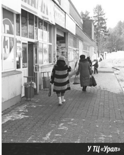
У ТЦ «Урал»

Четвертое место присуждается ТЦ «Урал» по улице Машиностроителей, 4. На территории «Урала» можно наткнуться на собранный в кучи снег вдоль всей парковки, которая к тому же не лишена наледи. Для пешеходов опасности нет, а те, кто «на колесах», по дорожкам между сугробами пробиваются к своему автомобилю мимо остальных, рискуя поскользнуться у чужой машины. В целом, асфальт почищен, не считая прилегающую к нему скользкую «козью тропу», которая относится к территории ТЦ, но также не смущает его хозяина, как и тропы у «Двух семерок».