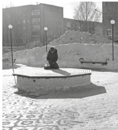
У ТЦ «Капитал»

гаться на весеннем солнышке. И заодно послушать прогноз погоды или любимую песню по радио, работающему на входе в ТЦ. Для присуждения первого места этому центру не хватило ухоженности парковки, которая находится «во власти» нещадной ледовой корки.