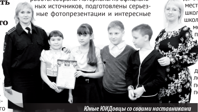
Юные ЮИДовцы со своими наставниками

Ребята, занявшие 3, 2 и 1 места городского конкурса агитбригад, получили в подарок пригласительные билеты в кинотеатр «Ретро», а победителям впервые вручен переходящий Кубок.