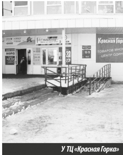
У ТЦ «Красная Горка»

Второе место занимает ТЦ «Капитал» по улице Декабристов, 2к. Территория у самого центра просторная, добросовестно почищена. Скамеечки хоть и не целиком освобождены от снега, но есть место, чтобы присесть, отдохнуть — пог