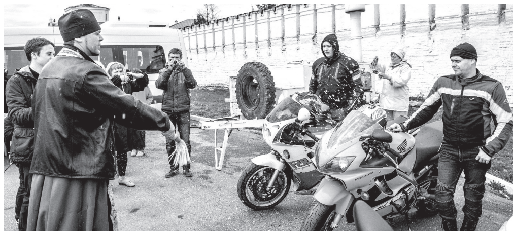
Обряд освящения байков.