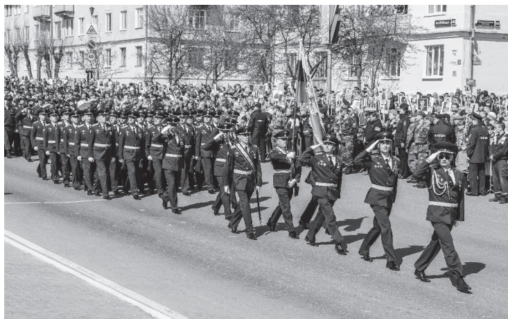
В парадном строю.

НАЧАЛОСЬ оно в 10:00 у здания городской администрации, откуда колонна ветеранов в сопровождении участников других боевых действий и духового оркестра двинулась к площади СКДЦ «Современник». К тому времени она уже до отказа была заполнена горожанами, чьи пламенные сердца откликнулись на то, чтобы встать в строй «Бессмертного полка». Здесь же к грандиозному шествию присоединились представители общественной организации «Дети войны». Все вместе – единым «фронтом» и в едином порыве – лесничане направились по центральной улице Ленина через Компроспект к Обелиску Победы. В такой моральной, нравственной сплоченности людей ощущалось единство и величие нашей страны. Несомненно, это шествие, когда в одном непоколе-