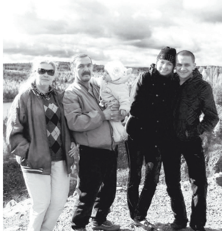
С семьёй сына - путешествие по родному краю