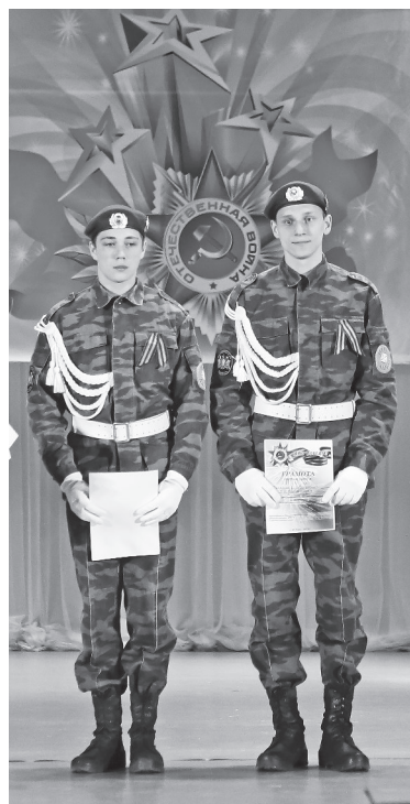
Момент награждения воспитанников клуба «Алмаз» (ИГРТ). ФОТО АВТОРА

Таковыми словами начинается статья «Праздник Победы» из газеты «Правда» от 9 мая 1945 года. Ее современный номер с максимально сохраненной стилистикой оригинала на входе в Нижнетурицкий ДК вместе с георгиевской ленточкой