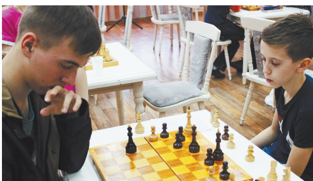
Игра в шахматы - хорошая тренировка для ума.