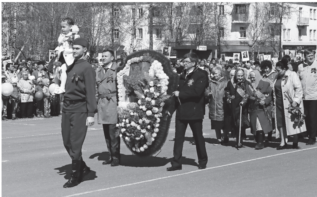
Нижнетурицы идут к Вечному огню почтить память погибших в годы войны земляков.