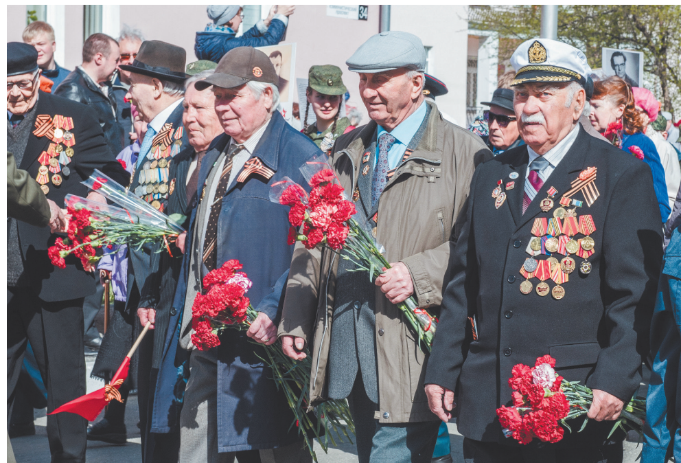
Слава героям-победителям!