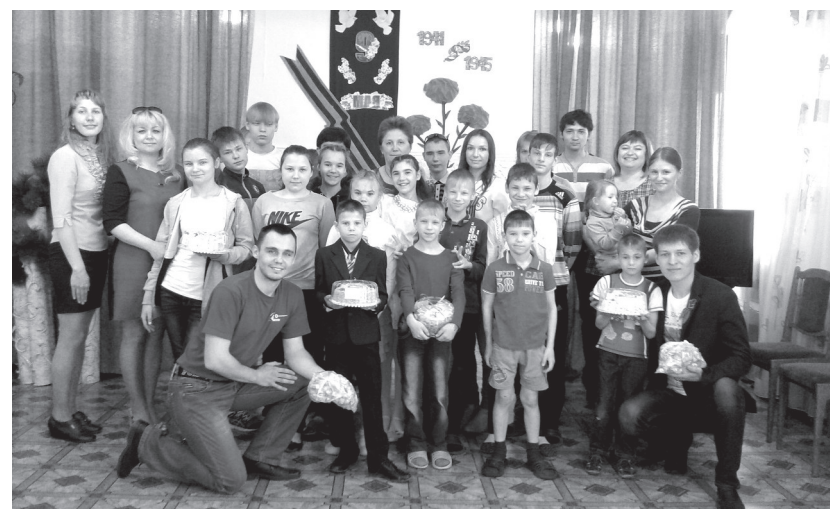
Совместное фото с детьми.

После торжественной части состоялась беседа активистов «Молодой гвардии» с детьми и воспитателями, в ходе которой обсуждались перспективы развития у детей творческих талантов, приобщения молодежи к спорту и туризму.