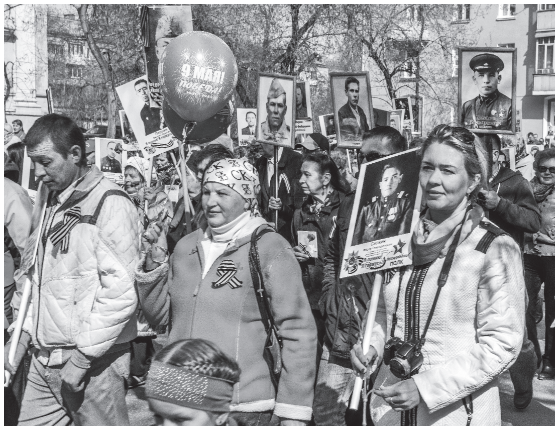
Лесной, 9 мая 2016 г. Участники акции «Бессмертный полк».

КОЛЛЕКТИВ АДМИНИСТРАЦИИ НИЖНЕТУРИНСКОГО ГОРОДСКОГО ОКРУГА