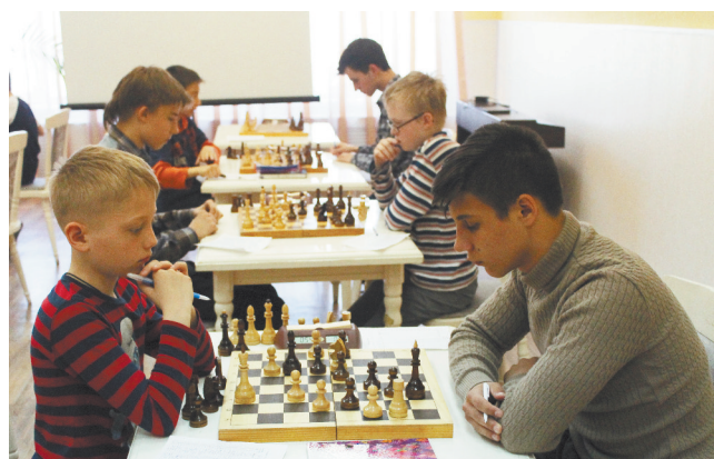
Играют юные шахматисты.

В турнире категории «А» участвовал 21 шахматист третьего и