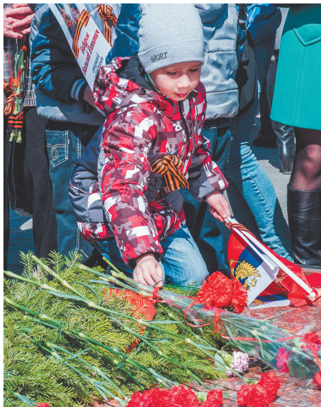
Лесничане возлагают цветы к подножию Обелиска Победы.

В Лесном празднование Дня Великой Победы традиционно проходит масштабно.