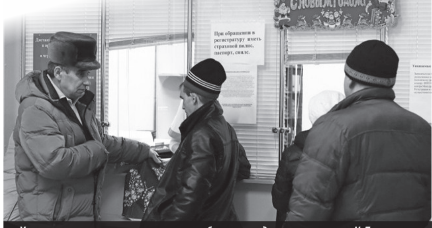
У регистратуры поликлиники — потребность в медицинских услугах в Н. Туре высокая

— Оптимизация системы здравоохранения подразумевает объединение несколь-