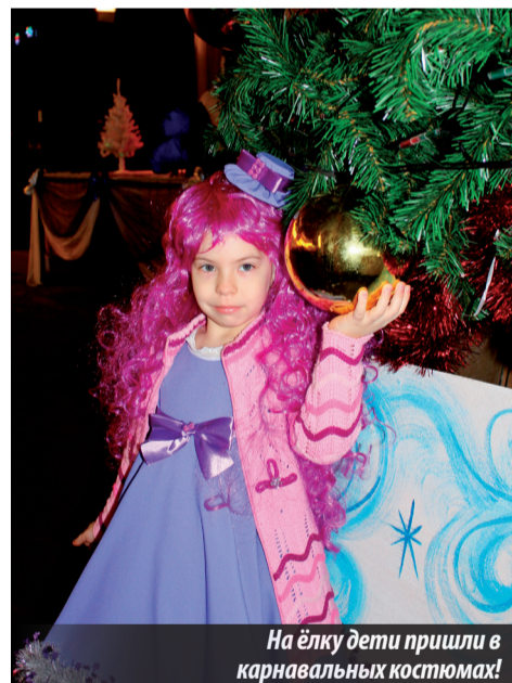
На ёлку дети пришли в карнавальных костюмах!

В последующие дни января температура воздуха опускалась еще ниже, но это не повлияло на желание детворы побывать в детской хореографической школе. Зрители были вознаграждены удивительными приключениями персонажей сказки «Новогодние чудеса», с восторгом приняв поучительную историю с оптимистичным завершением сюжета, в котором добро одержало победу над злом. Затем детишек ожидала веселая массовка у новогодней елки с Дедом Морозом и Снегурочкой, подарками от профкома комбината.