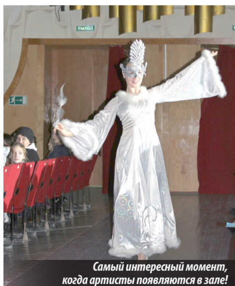
Самый интересный момент, когда артисты появляются в зале!

Н. МУХИНА, председатель информационной комиссии ПК-391, г. Лесной