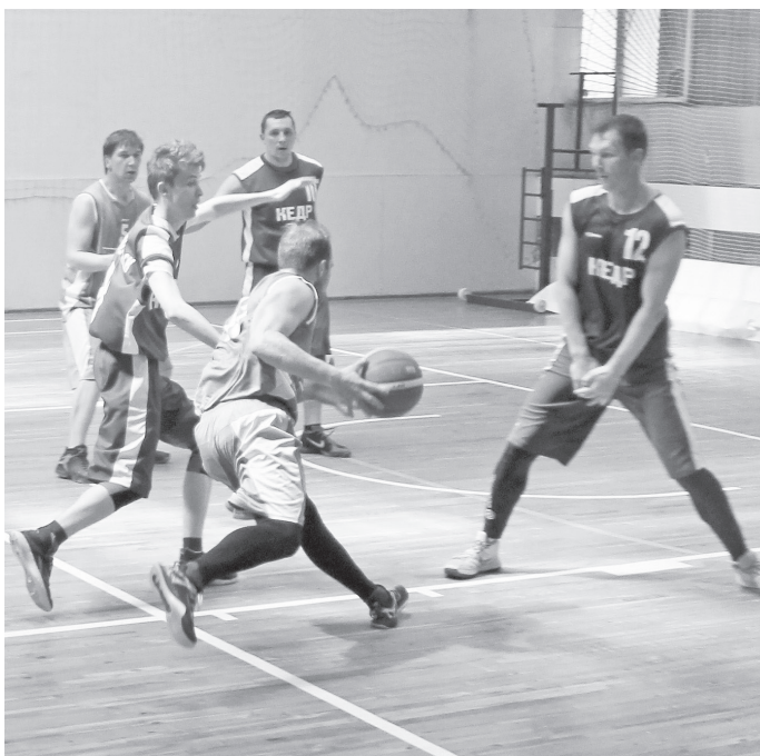
Момент встречи «Кедр-1» – Лесной.

Места в чемпионате распределились так: 1. «Евраз-Юком»; 2. «Металлург»; 3. «Кедр-1»; 4. «BROZEX»; 5. «Баскур»; 6. «Лесной»; 7. «Буревестник-Орион»; 8. «БАЭС»; 9. «Сафмедь»; 10. «Кедр-2»; 11.