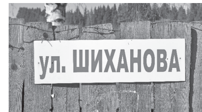
Одно название улицы...

ЕСТЬ в нашем городе улица Мамина-Сибиряка . Только вот на табличке, «красующейся» на одном из домов этой улицы, значится другое ее название — М. СИБИРЯКА . Так бездарно испохабить фамилию известного писателя-прозаика мог только человек совершенно безграмотный, не знающий, в честь кого названа улица, за что этот человек удостоен такой чести. Безграмотных хозяев жилища еще как-то можно понять, они, может, и в школе-то бывали по случаю, не разобрались... Но вот как понять тех, кто изготавливал эту табличку? Ведь подобным ремеслом по определению должны заниматься грамотные люди.