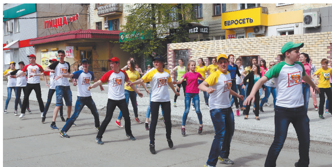
Призыв к здоровому образу жизни от «КЭТовцев».

Следует напомнить, что Свердловская область по количеству ВИЧ-инфицированных относится к числу наиболее пораженных регионов России. Что касается нашего города, в поликли-