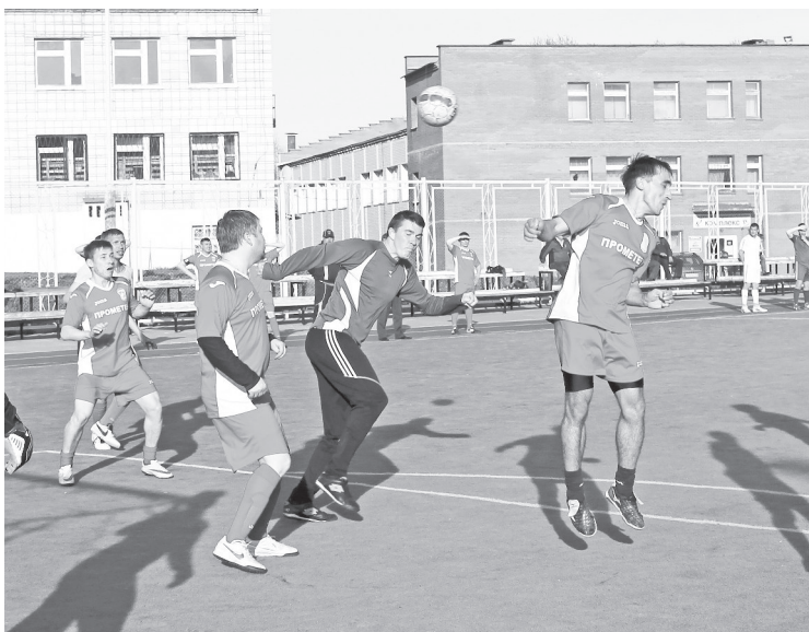
Играют «Прометей»-«Знамя».