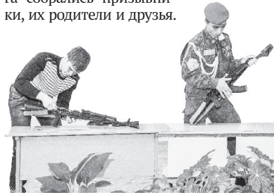
Кто быстрее в разборке-сборке автомата.

13 мая в актовом зале администрации Нижнетуринского городского округа собрались призывники, их родители и друзья.