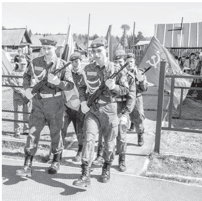
Посёлок Выя. Воспитанники клуба «Русичи» направляются к памятнику погибшим в годы Великой Отечественной войны сельчанам.

Автоколонна, во главе которой были три машины ДОСААФ, проследовала до Сигнального, Иса, завершив свой путь в Косье. Вторая, возглавляемая экипажами военно-патриотического клуба «Русичи», направилась на Платину, в Новую Туру и Выю. В числе