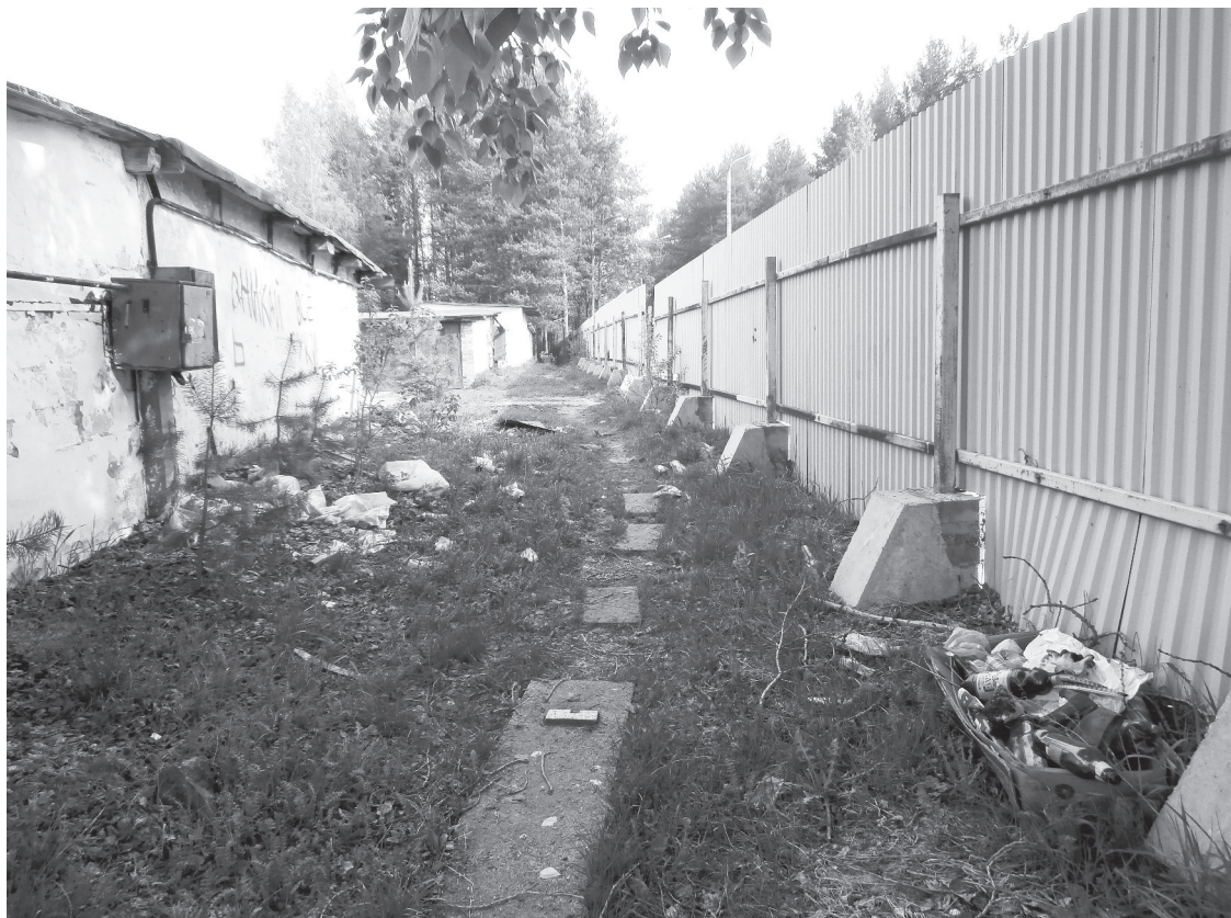
Мусор выбрасывают между гаражами и забором. Раньше здесь стояли мусорные баки.