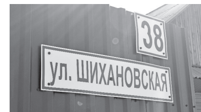
А вот другое...