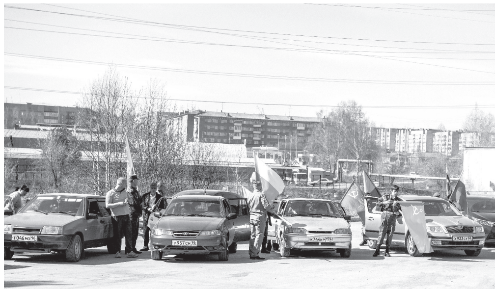
Участники акции.