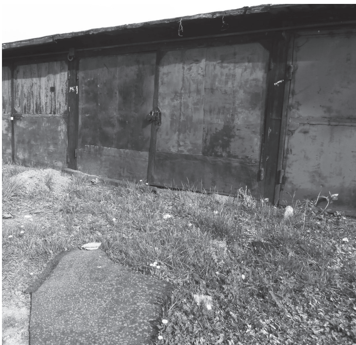
Заросли в гаражи стёжки-дорожки.

ности для автомобиля от его взлома и повреждения хулиганами.