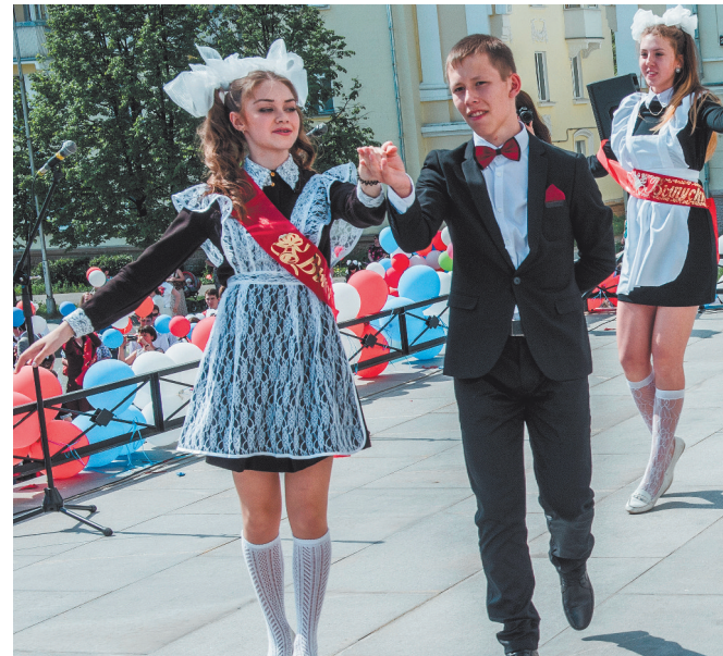
г. Лесной. Танец выпускников — традиция «Последнего звонка».

Отзвенела гитара, и балу — отбой. Хоть немного тепла этой памятной встречи Унесите с собой, унесите с собой! Вплотить мечту постарайтесь,