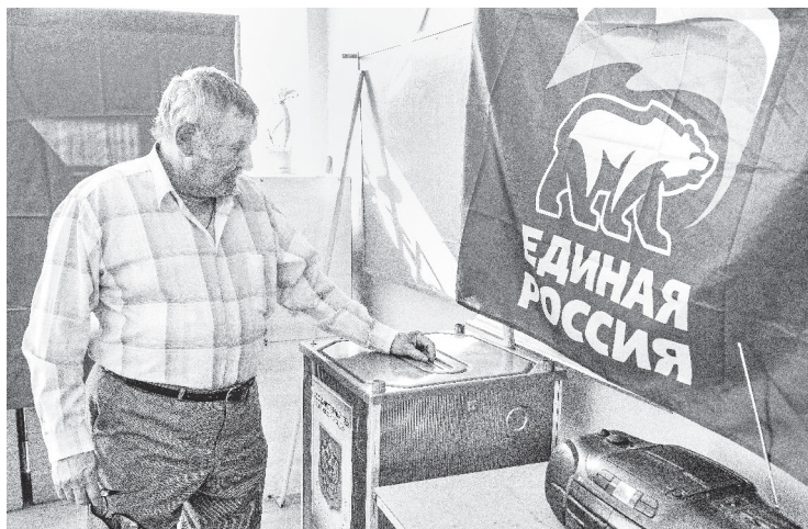
Нижняя Тура. На счётном участке в школе № 7.

В XXI веке этот полезный инструмент решили позаимствовать и для российских нужд. В 2011 году политическая партия «Единая Россия» совместно с Общероссийским народным фронтом в преддверии думской предвыборной кампании организовала праймериз, в которых приняли