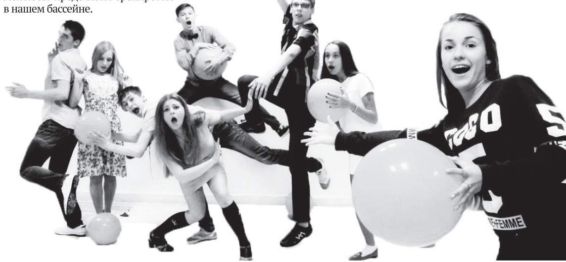
3-я смена, 2015 год

Важно отметить, завершена реконструкция бассейна. И уже с начала первой смены ребята смогут плавать в нем. По договоренности со школой олимпийского резерва «Факел» у пловцов дневного городского лагеря тоже появится возможность продолжить тренировки в нашем бассейне.