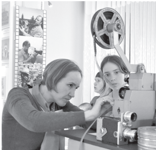
Кинопросмотр в прошлом требовал значительно больше умений, чем современный.