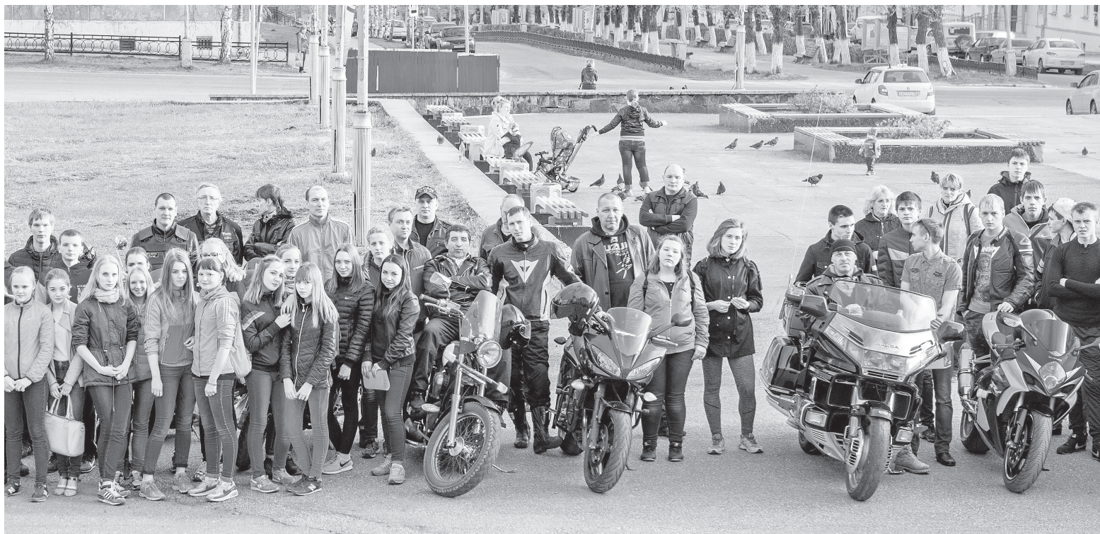
Участники акции на площади у СКДЦ «Современник», г. Лесной.

ОТДЕЛ РЕЖИМА И ОХРАНЫ ФГУП «Комбинат «Электрхимприбор»