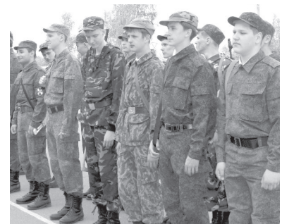
Старшеклассники НТГО перед отправкой в оборонно-спортивный лагерь.

Звучат пожелания от руководства города, военкома, начальники учебных