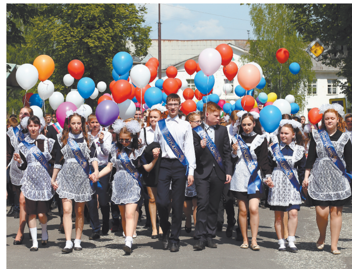
г. Нижняя Тура. Участники шествия выпускников.