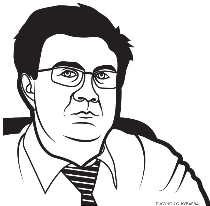
РИСУНОК С. КУБАЕВА