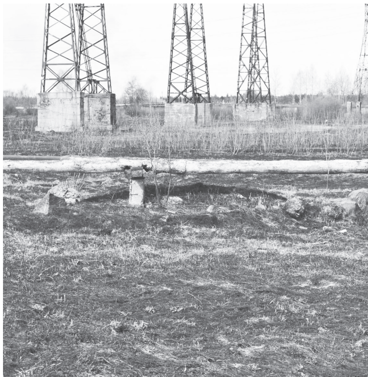
Нижняя Тура, район зольного поля. Здесь выжжено всё...

Часто на экранах телевизоров можно видеть ужасающие картины последствий разбушевавшейся огненной стихии. Сгоревшие дотла населенные пункты, превращенные в безжизненную пустыню огромные лесные массивы, сотни и тысячи погибших животных и птиц. Ущерб от пожаров исчисляется миллионами рублей. Самое страшное — в огне гибнут люди, порой и виновники возгораний. Уже давно говорится о том, что львиная доля вины в возникновении пожаров лежит именно на людях. Оставленные в лесу костры, непотушенные окурки или просто несанкционированный пал сухой травы для якобы образования золы для удобрения почвы. Однако доказано, мнение о пользе выжигания прошлогодней травы является не более чем невежеством тех, кто так считает. Высказываются и суждения о том, что огнем уничтожаются вредные насекомые, даже клещи. Да и трава, мол, новая быстрее растет. Ну вот откуда такие, с позволения сказать, познания в голове у людей? Да никогда она так быстрее расти не будет. Просто молодую траву легче увидеть на выжженной земле, не более того, а среди старой травы зелень не так заметна. Вот и вся разнища. Кроме всего прочего, огнем уничтожаются полезные микроорганизмы, на восстановление которых уйдет не менее пяти лет. Гибнут насекомые, птицы, мелкие животные, пресмыка-