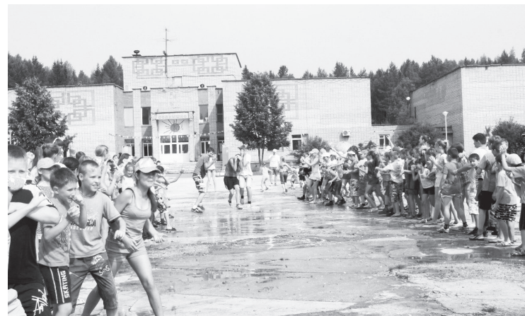
В летнем лагере «Солнышко»

— Где и за какую сумму приобретается путёвка в «Солнышко»?