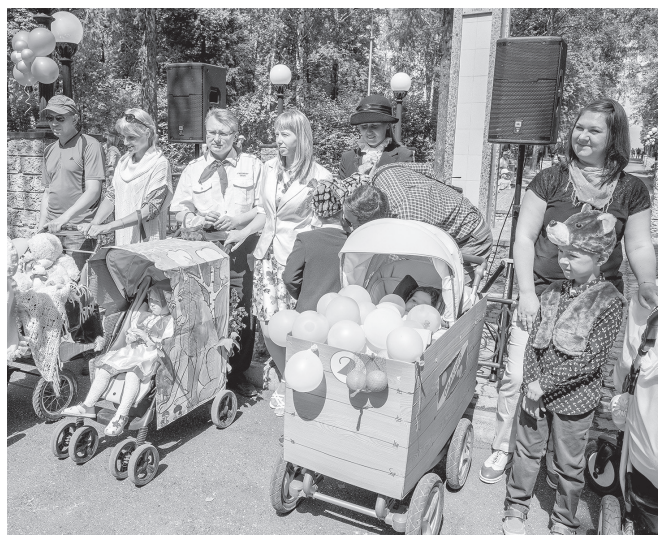
Участники парада колясок.

11 ИЮНЯ В ПАРКЕ ИМ. Ю. ГАГАРИНА ЛЕСНОГО СОСТОЯЛСЯ ПРАЗДНИК «ЧИТАЮЩИЙ СКВЕР — 2016», ПОСВЯЩЁННЫЙ ДНЮ РОССИИ И ДНЮ ГОРОДА ЛЕСНОГО, КОТОРЫЙ ПРИГОТОВИЛ ДЛЯ ЛЕСНИЧАН И ГОСТЕЙ ГОРОДА КОЛЛЕКТИВ ЦЕНТРАЛЬНОЙ ГОРОДСКОЙ ДЕТСКОЙ БИБЛИОТЕКИ ИМ. А.П. ГАЙДАРА.