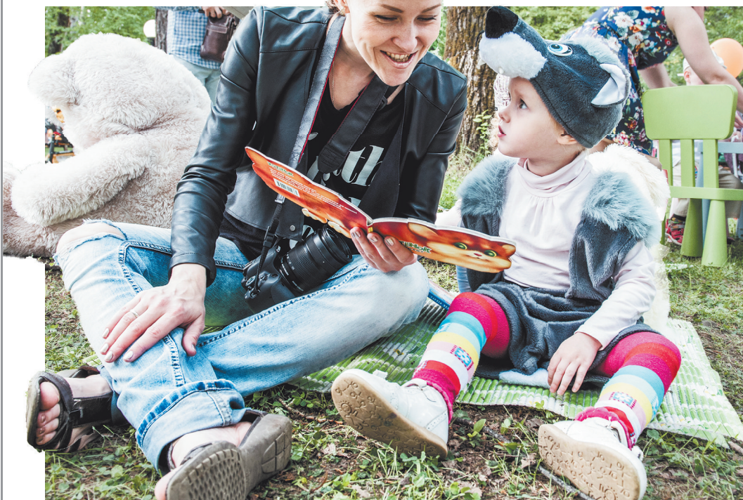
Лесной. 11 июня. Интерактивная площадка «Библиотека на траве».