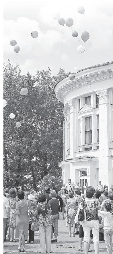
Нижняя Тура, 12 июня. Площадь перед городским ДК.