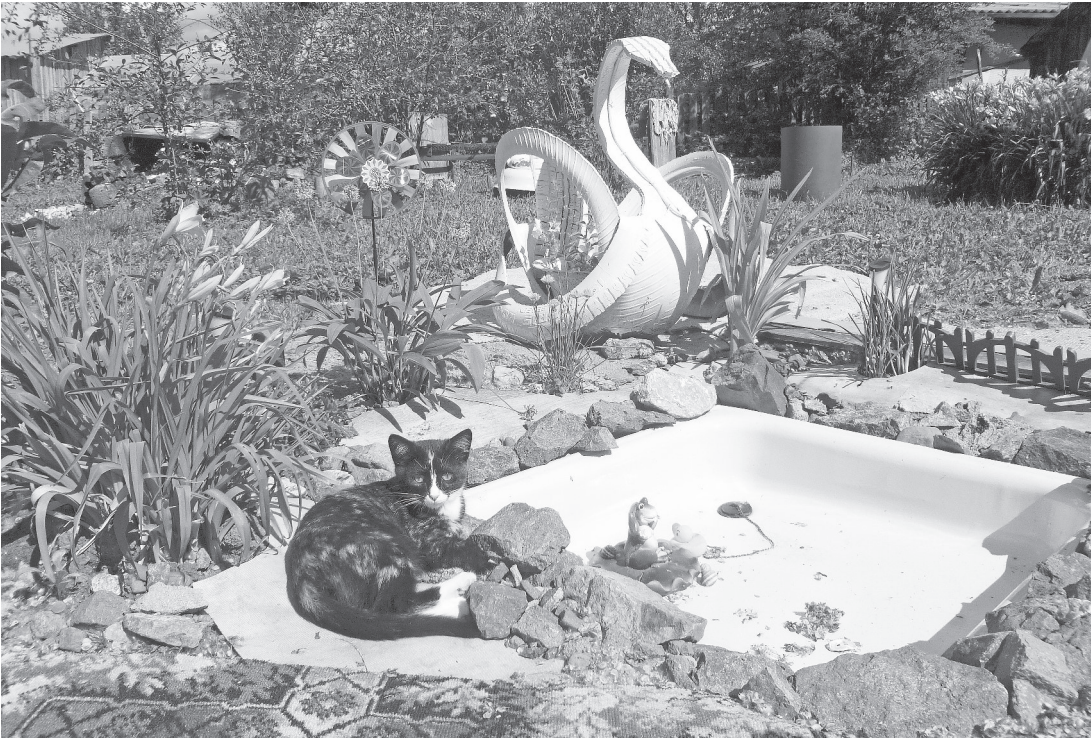
Кошка Т. Мальцевой Соня любит погреться на солнышке на берегу мини-прудика.