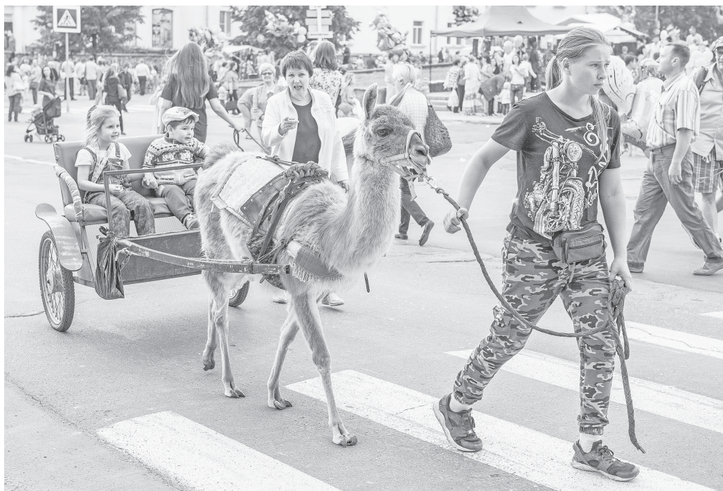
Любимая забава ребятшек.

Редакция «Резонанса» от всей души поздравляет лесничан с Днем России и Днем города! Желаем нам всем красивых домов, ухоженных дворов, чистых улиц, ровных дорог и широких проспектов! Чтобы наши дети росли в комфорте, учились в современных школах, а старики не чувствовали себя забытыми. Чтобы приезжие чувствовали щедрое гостеприимство, а на наших лицах играли только счастливые улыбки! ■