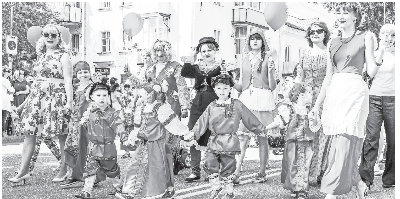
Участники шествия.