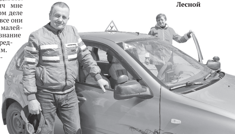
Процесс обучения завершился, можно и улыбнуться!