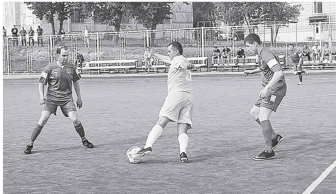
Момент игры Лесной – Трёхгорный.