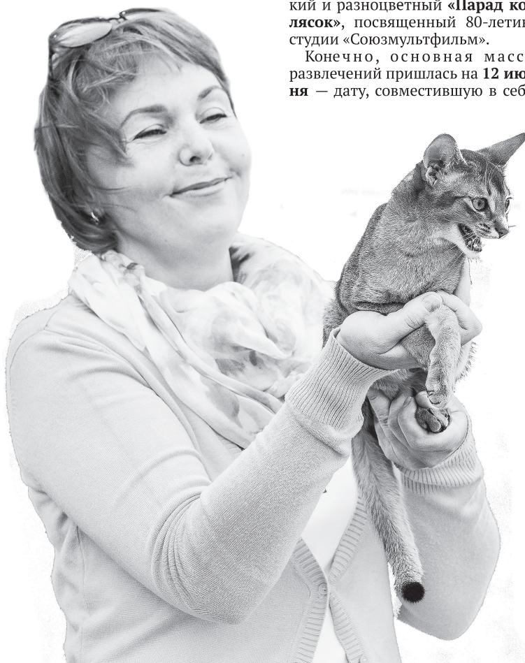
В день города состоялось «Шоу четвероногих».

Большой праздничный концерт с патриотичным выступле-