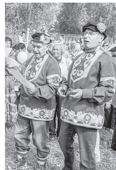
Конкурс частушек повеселил от души!

В мероприятии приняли участие восемь команд с «киношными» названиями: «Девчата» (торговля и об-