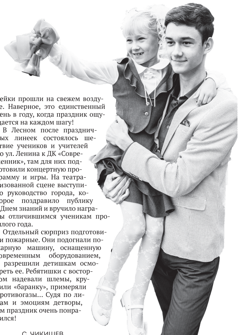
Долгожданный звонок на урок!