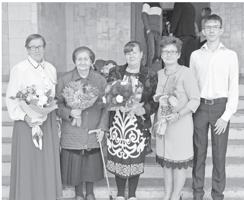
Представители трёх поколений у родной школы.