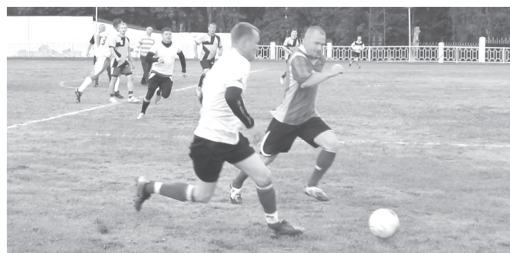
Матч «Спутник» — «Прогресс». Борьба за мяч по всему полю.

Но кто удивил больше всех, так это команда «Прогресс», одержавшая три победы кряду. Но если выигрывать у футболистов «АТП» был из категории прогнозируемых, то успех в поединках с «Фанту-Финтой» и особенно со «Спутником» – это неожиданность. Прежде всего в действиях «Прогресса» подкупает та страсть, с которой футболисты вели борьбу за мяч по всему полю, а также горячая поддержка запасными игро-