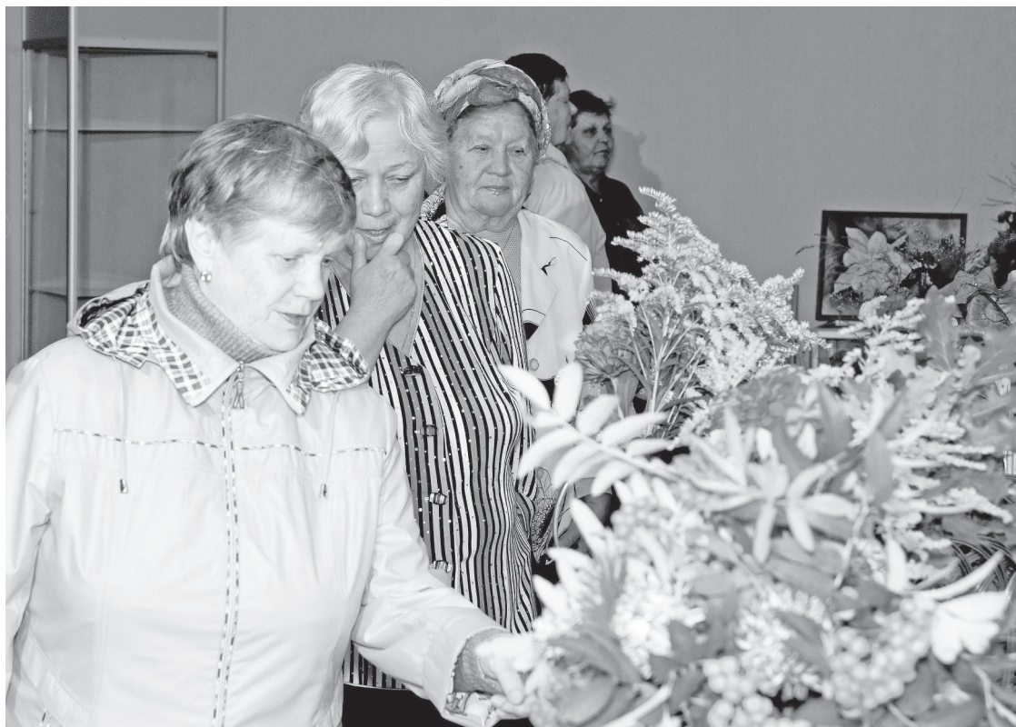
Восторженные зрители.