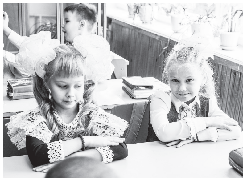
Ученицы 2 «а» класса школы № 7, Нижняя Тура.

Как приятно было смотреть на гордо шагающих нижнетуринцев, ведущих за ручку прекрасных