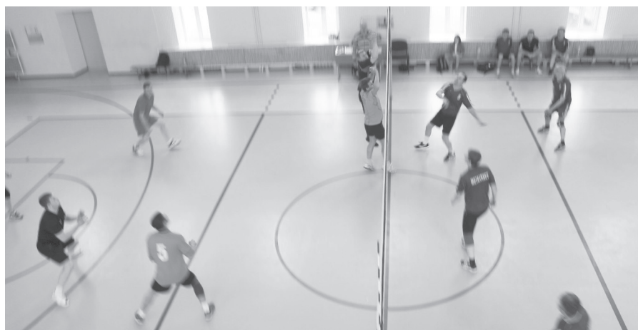
Момент игры «Энергия-9» - «Металлист».

Турнир продолжился 10 октября. Правда, из двух назначенных матчей зрители увидели лишь один: «Арсенал» не явился на игру с «Локо- мотивом», где определя- лось, кто займет 5 и 6 ме- ста. В поединке «Труд» - «Энергия-9» в первом сете