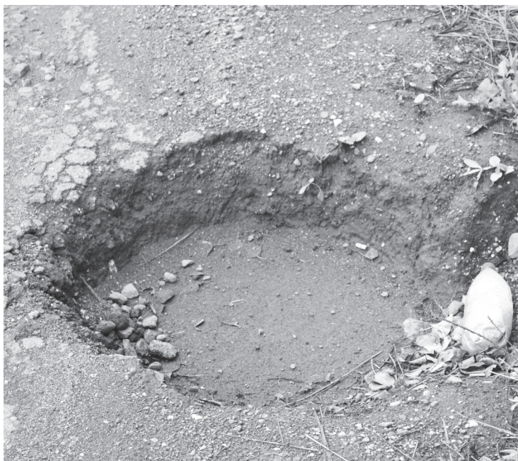
Колодец-ловушка на улице Декабристов.

Выезжая с улицы Шиханова на улицу Чкалова, снова попадаешь в колдобину. Здесь ещё и канавка глубокая справа, лавируй, как хочешь. А за поворотом встречается экипаж ГИБДД... И они-то прекрасно видят, какие у нас дороги, и имеют право делать предписания