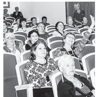
Виновики торжества — в зрительном зале.

На юбилей собралось немало гостей, среди которых — местные артисты. Они пришли во Дворец культуры не просто поздравить, а каждый со своим творческим номером. И получился прекрасный концерт! Зрителям программа явно понравилась, да и как она могла не понравиться, ведь все номера были исполнены с душой, а не для «галочки»! Между концертными номерами прозвучало много поздравлений и добрых пожеланий клубу.