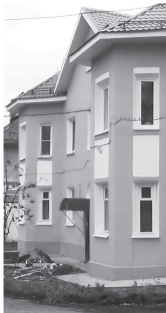
На ул. Ватутина.

Надо отметить, эти дома по улице Строителей произвели глубокое впечатление на подрядчика. Когда строители пришли на объект, жители чуть не «подняли их на вилы». Думали, что живут в ветхом жилье и их обязаны переселить, но вместо этого сюда пришел капремонт. Постепенно люди перестали винить в случившемся строителей, и ремонт-