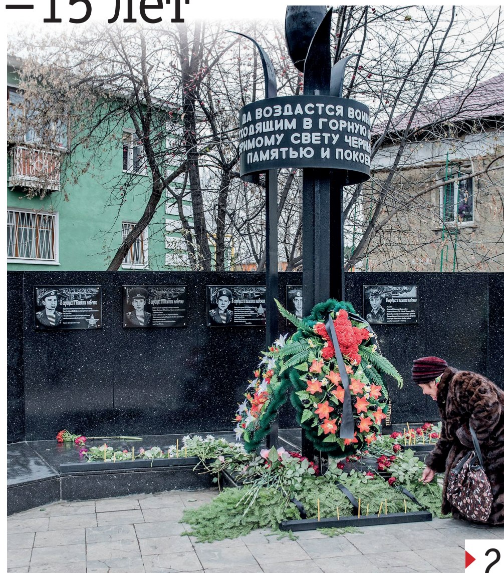
В 15-ю годовщину установки монумента в Нижней Туре почтили память земляков, погибших в «горячих точках».