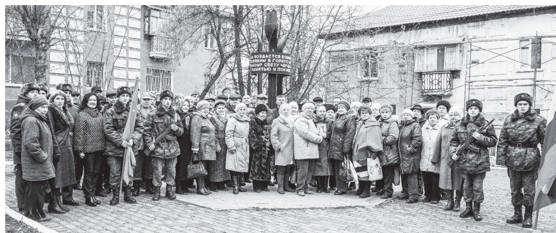
Участники митинга.

«Да воздастся воинам, уходящим в горную даль к незримому свету чёрных звёзд, памятью и покоем»