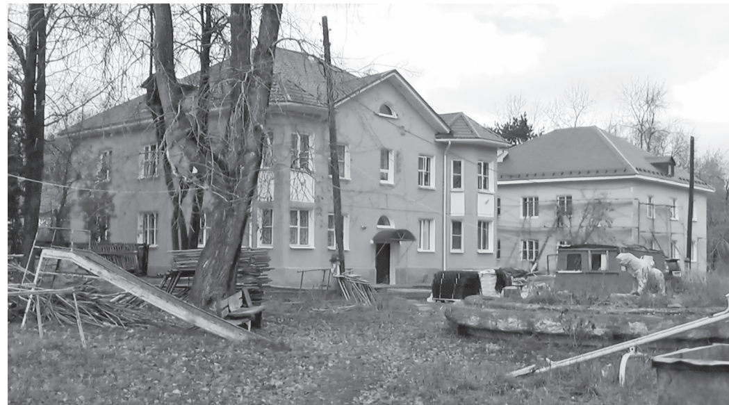
Обновлённый дом № 29а на ул. 40 лет Октября.