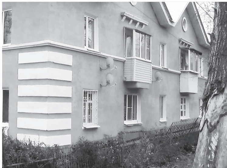
Ул. Яблочкова, 4.