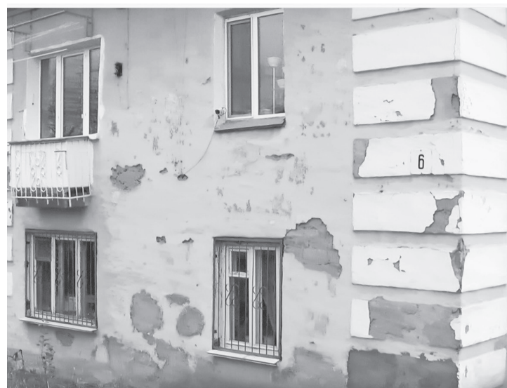
Ул. Яблочкова, 6.