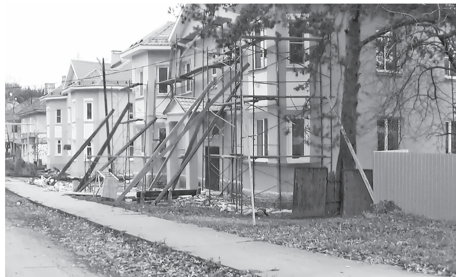
На ул. Ватутина.