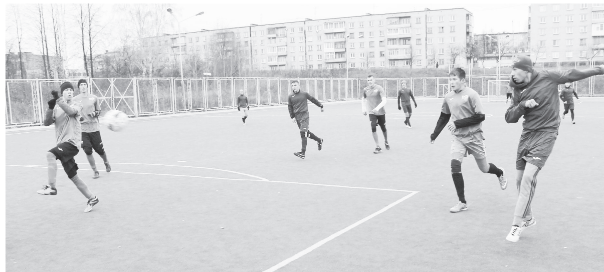
Эпизод встречи «Патриот» - «АТП».

Открытое осеннее первенство Лесного. Мини-стадион. 22-23.10.2016