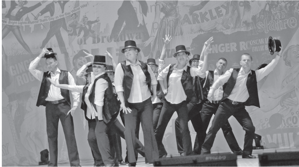
Велик талант трудящихся на «ЭХП»!