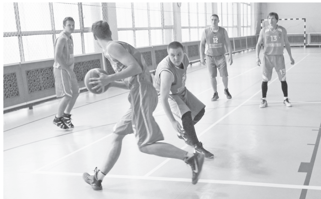
Момент игры «Лесной» – «Верхняя Синячиха».