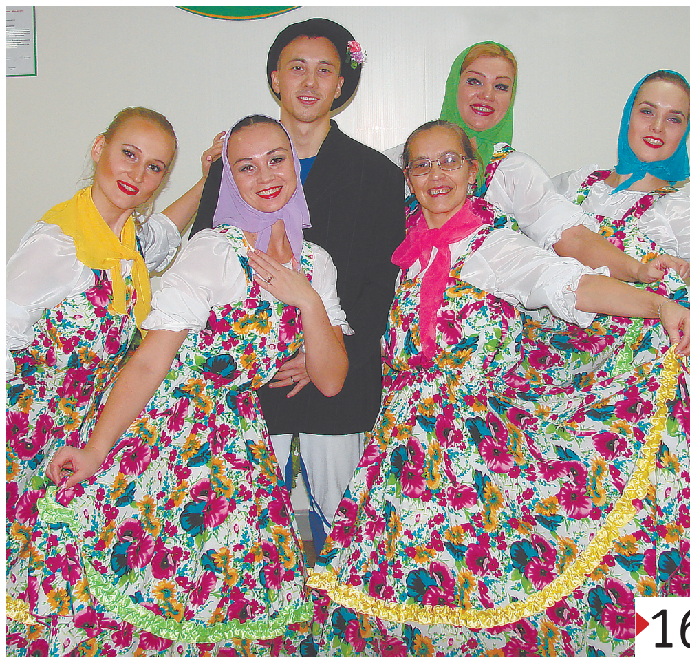
Благодаря мастерству педагогов ДХШ г. Лесного танцевальный проект ПК-391 удался!