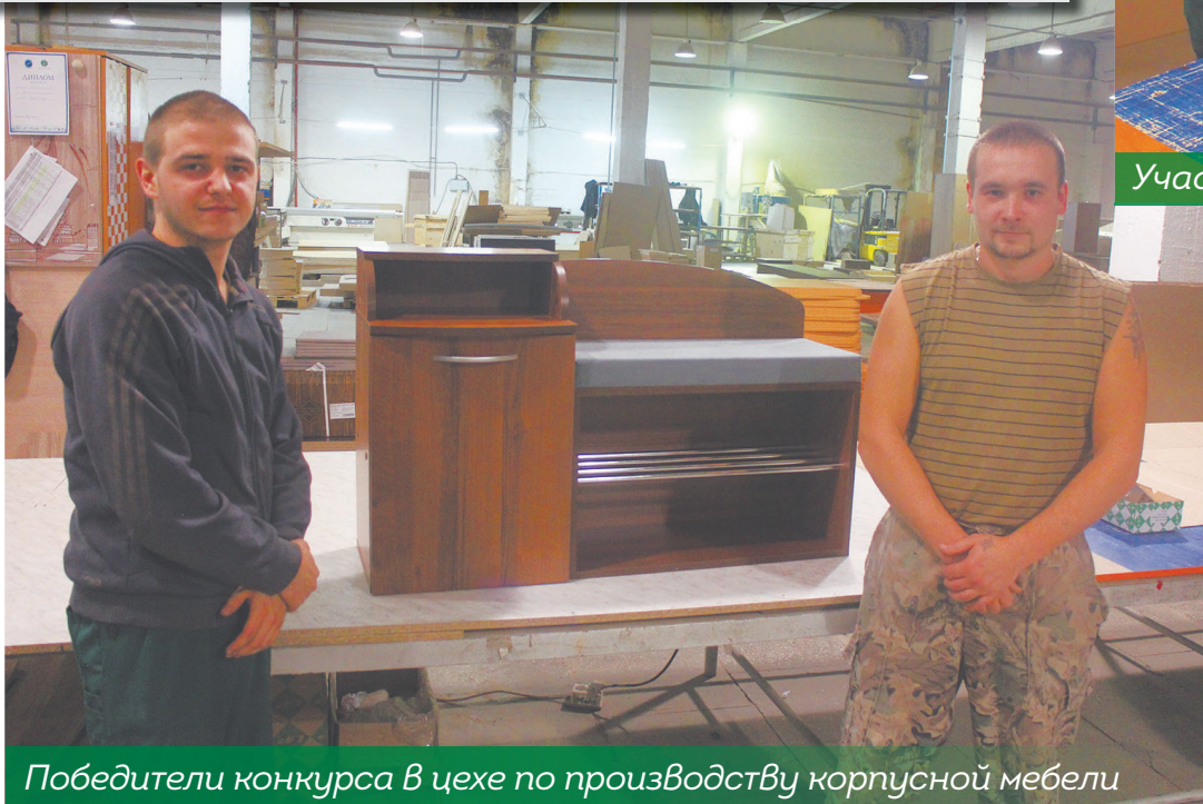
Победители конкурса в цехе по производству корпусной мебели