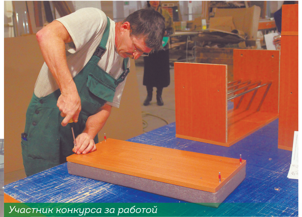
Участник конкурса за работой

Учитывая потребности рынка, модные тенденции в дизайне, тканях, мы постоянно обновляем свой ассортимент.