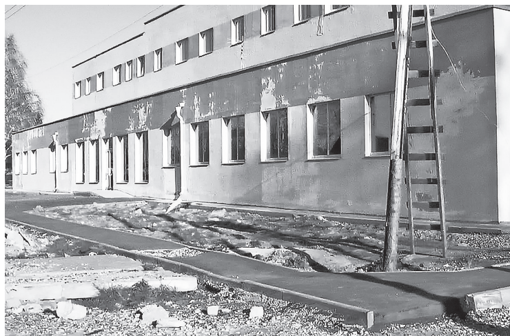
Поселок Ис, ул. Фрунзе, 54.

полнения работ по благоустройству территории признан. Несмотря на эти обстоятельства, заказчик в лице комиссии акты приема-передачи помещений подписал. ООО «ЕвроСтрой» письменно обязалось в мае-июне 2016 года устранить недостатки.