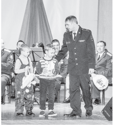
СКДЦ «Современник». Момент награждения победителей конкурса «Полиция глазами детей».

ОБЩЕСТВЕННЫЙ совет при ОМВД России по городскому округу «Город Лесной» определил победителей детского рисунка «Полиция глазами детей». Ими стали: воспитанница детского сада «Солныш-