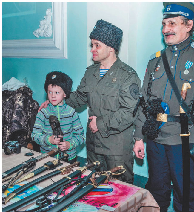
Передвижная выставка исторического казачьего вооружения.

Перед началом фестиваля в холле Центра культуры казаки устроили передвижную выставку исторического казачьего вооружения, экспонаты которой можно было по-