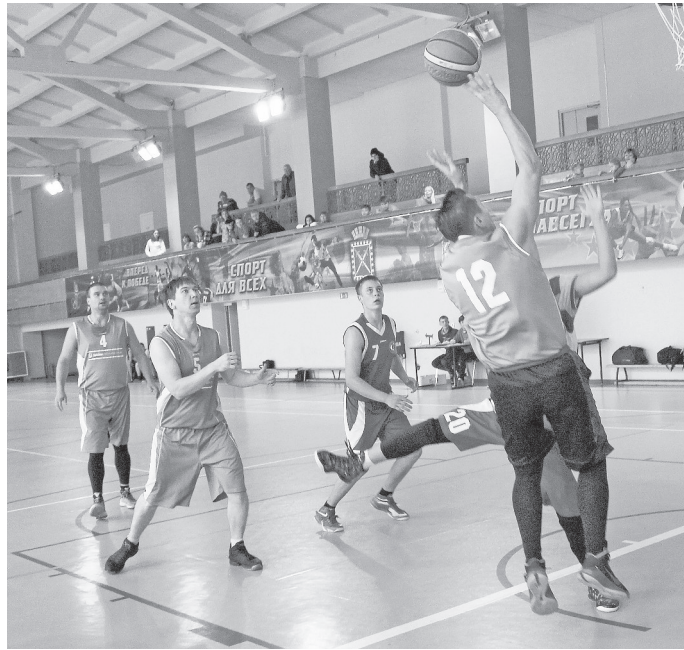
Эпизод встречи «РЭК» – «Космос».

Второй матч дня «Ветераны» – «Тизол» порадовал более качественным баскетболом. В составе «Тизола» блистал А. Кекшин, набравший 41 очко. Но один игрок, как бы прекрасен он ни был, погоды в игре не делает, тем более, когда