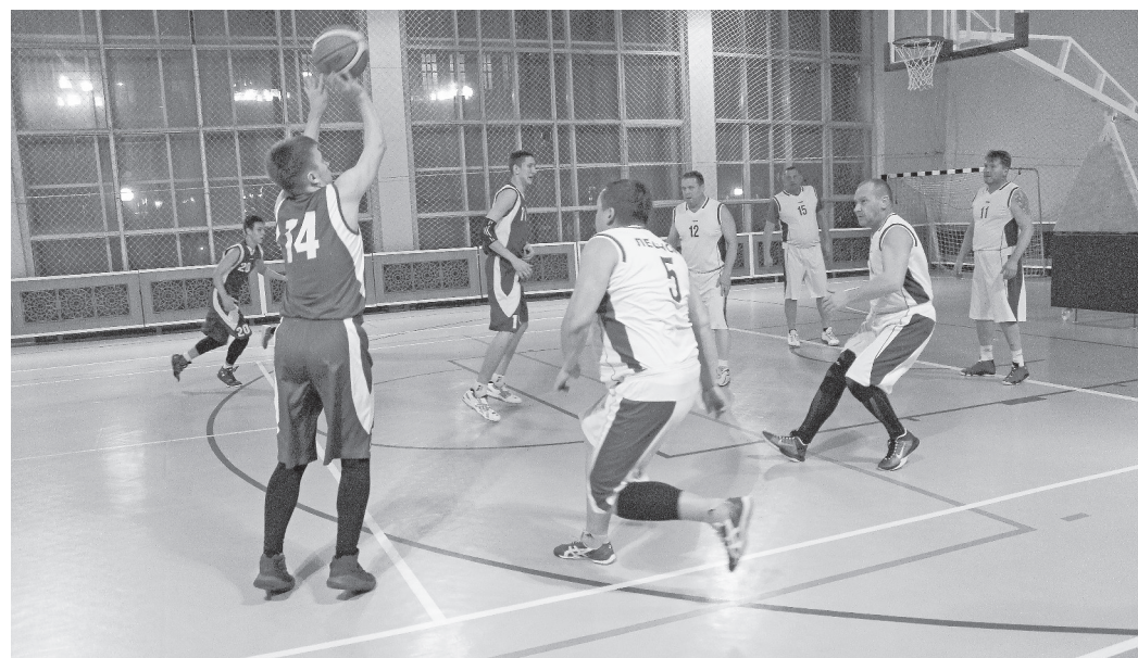
Момент игры «Ветераны» – «Космос».