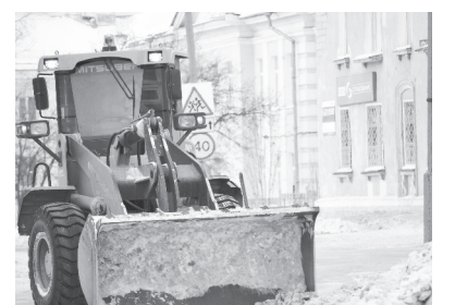
С хорошей машиной работа спорится!

Во дворах, на удивление, тоже поддерживается порядок. Техника работает регулярно и на совесть. Есть, где проехать машинам и пройти мамам с колясками. Нет скопления и огромных снежных груд. Пока новые осадки отсутствуют, работники жилищно-коммунального хозяйства стараются по максимуму вывезти из ЗАТО немалые отсыпки прежних. Приятно посмотреть на центральную улицу, равно как и на периферийные.