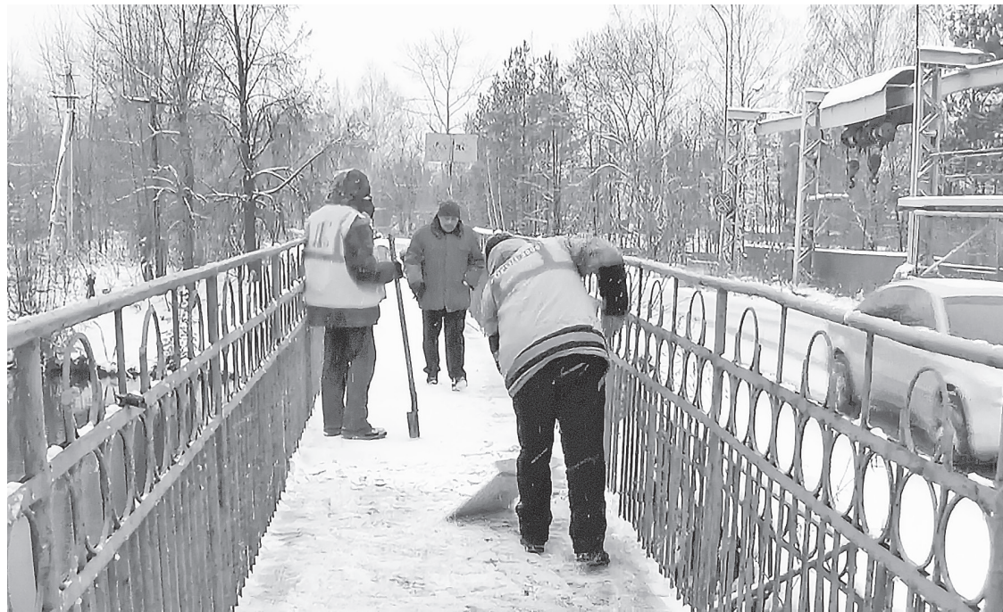
Уборка тротуара на плотине.