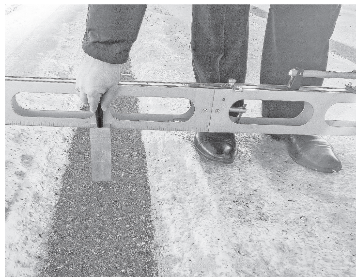
Замер колеи.

Чистят по разовым договорам на 99 000 рублей в месяц, в соответствии с 44 ФЗ. На машинах установлена система ГЛОНАСС, документы подписываются при подтверждении средствами объективного контроля. Система управления техникой отстроена в режиме онлайн (реального времени). Диспетчер постоянно мониторит работу тракторов и содействует ее оптимизации. Работа у предпринимателя отлажена так, что с одного компьютера можно управлять очисткой всего города. Все системы видеонаблю-