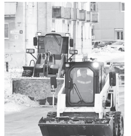
Юркая техника - в помощь уборке.

И он, не только к радости служителей пера, но и всех лесничан, случился-таки! Несмотря на завершение периода обильных снегопадов, когда коммунальные службы, надо признать, не поспевали за ним, оставляя небранной добрую половину округа, о чем писалось в прошлом номере газеты, продолжают активно убирать и вывозить снег с улиц муниципалитета. Каждодневно спецтехника трудится сразу в нескольких районах города! Причем расчистка дорог и тротуаров идет масштабная —