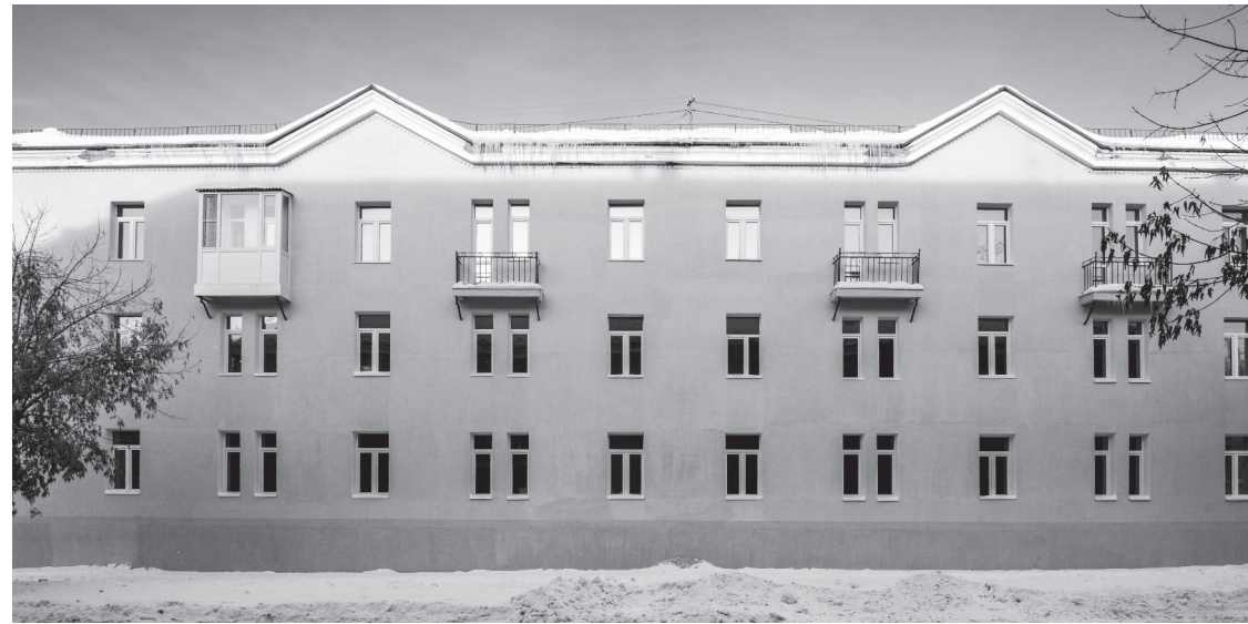
ул. Пушкина. Тот самый дом...