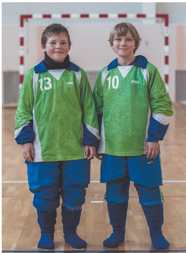
Призеры Первенства Свердловской области 2016 г. по футболу.