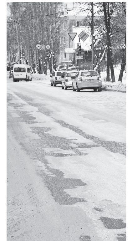
Ул. 40 лет Октября. Ледяные наросты убрались, а что толку, вода снова льется на проезжую часть...

Только установился снежный покров, как очередной потоп превратил проезжую часть улицы 40 лет Октября между городской поликлиникой и светофором в непреодолимое ледяное препятствие для автомобилистов. Довольно глубокие промоины в образовавшемся ледяном панцире приходится обезопасить по левой стороне проезжей части, создавая неудобства как встречному транспорту, так и себе, да ещё и искусственно создавая пробку. Попавшие колёсами в промоину машины просто «салятся» днищем на лёд. При повороте налево нет возможности перестроиться в левый ряд, колёса не могут преодолеть ледяные