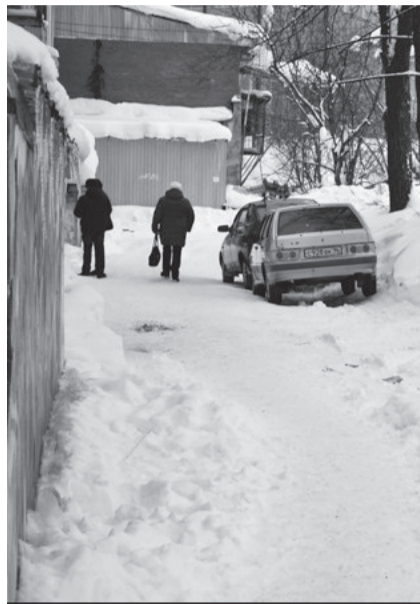
Здесь трактору не пройти, авто не пропустят

Вроде всё ясно. Но, как оказывается, привести территорию в порядок мешает ряд определённых факторов. Например, УК не имеет своей снегоуборочной техники. За тем же трактором нужно обратиться в ООО «Город 2000», где такая техника есть. Разумеется, не просто так обратиться, а на определённых условиях. И здесь ничего удивительного нет, если учесть, что в наше время целые строительные организации заключают договоры на строительство каких-либо объектов, не имея ни людей, ни техники. И работают, и строят! Главное, есть юридически узаконенное предприятие, а как оно будет справляться с работой — дело десятое.