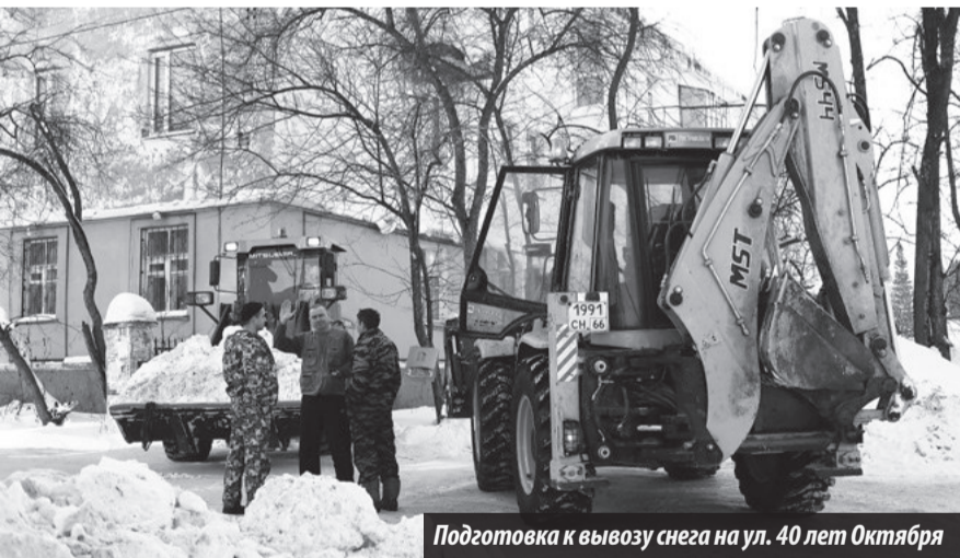
Подготовка к вывозу снега на ул. 40 лет Октября