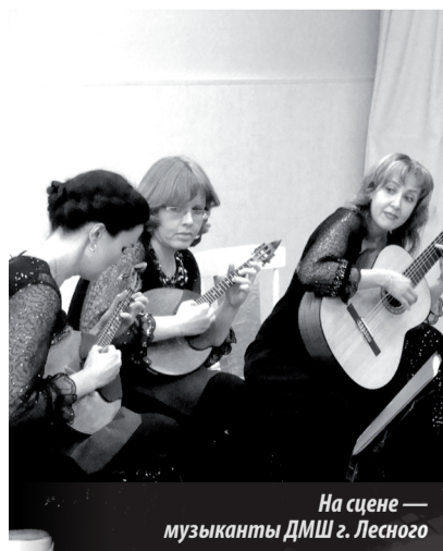
На сцене — музыканты ДМШ г. Лесного

ство, а любовь к Родине, к природе, друг к другу является двигателем всего лучшего, что раскрывается в человеке на протяжении всей жизни.