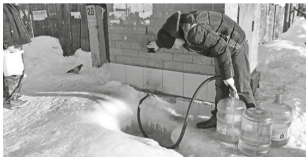
Н. Тура, ул. 8 Марта. Попробуй набрать воды...

В НОВОМ 2016 году, чтобы набрать питьевой воды из скважины на улице 8 Марта в Нижней Туре, потребуются принести с собой шланг (см. фото). В противном случае хоть на колени становись или на живот ложись, чтобы ёмкость установить под струю вождельной влаги, столько здесь намёрзло льда. Не пора ли навести порядок?