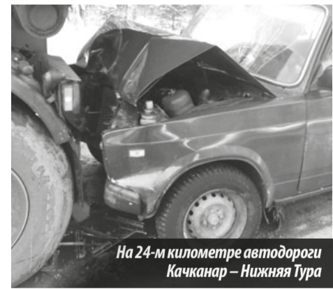
На 24-м километре автодороги Качканар — Нижняя Тура

Т. ЗАМОРСКАЯ, г. Нижняя Тура