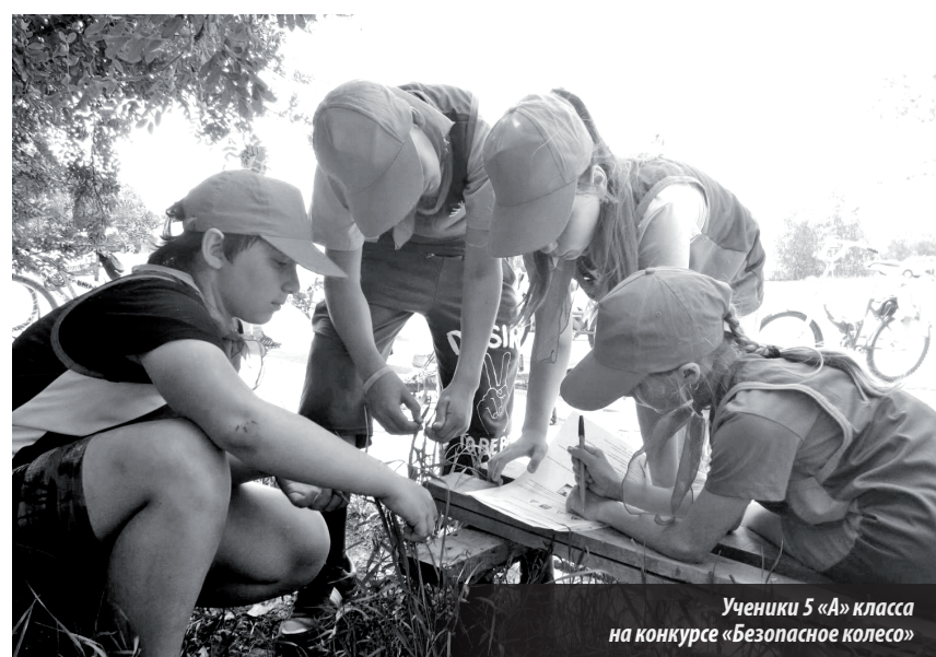
Ученики 5 «А» класса на конкурсе «Безопасное колесо»

– Кто был вашим первым учителем и классным руководителем?