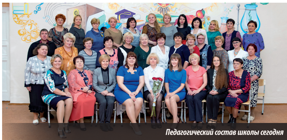
Педагогический состав школы сегодня

Знания, полученные в школе, – это всегда самая первая и главная ступенька на пути профессионального роста учащихся. Здесь раскрываются их таланты и способности, выявляются сильные стороны и определяется направление