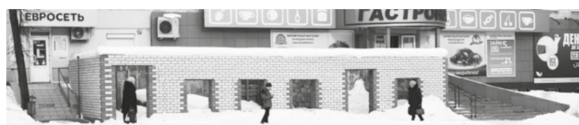
Н. Тура, ул. Усошина, 1. Этот недострой иные путают с отхожим местом

Так, к примеру, жители первого дома по улице Усошина в Нижней Туре обречены ежедневно созерцать, как для отправления естественных нужд иные незональные граждане без стеснения используют недостроенное помещение, примыкающее к кафе «Пиар». Причем, замечу, находится оно практически в центре города. Крыши у строения еще нет, поэтому из окон верхних этажей жилого дома неприглядный пейзаж просматривается как на ладони. Ну не закрывать же жильцам глаза, когда они выходят на собственный балкон. Но это