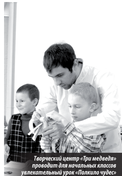
Творческий центр «Три медведя» проводит для начальных классов увлекательный урок «Полкило чудес»

школе переделать, чтобы погонять с ребятами мяч во дворе. С будущей профессией определился уже в четвертом классе. Хотел стать предпринимателем. И стал.