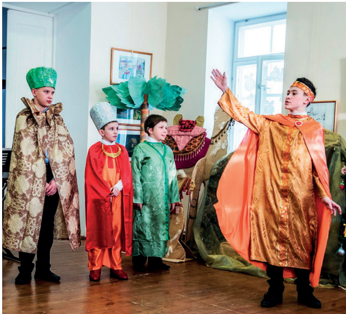
Фрагмент Рождественского представления в краеведческом музее Нижней Туры.

Праздник Рождества Христова в городском музее Нижней Туры