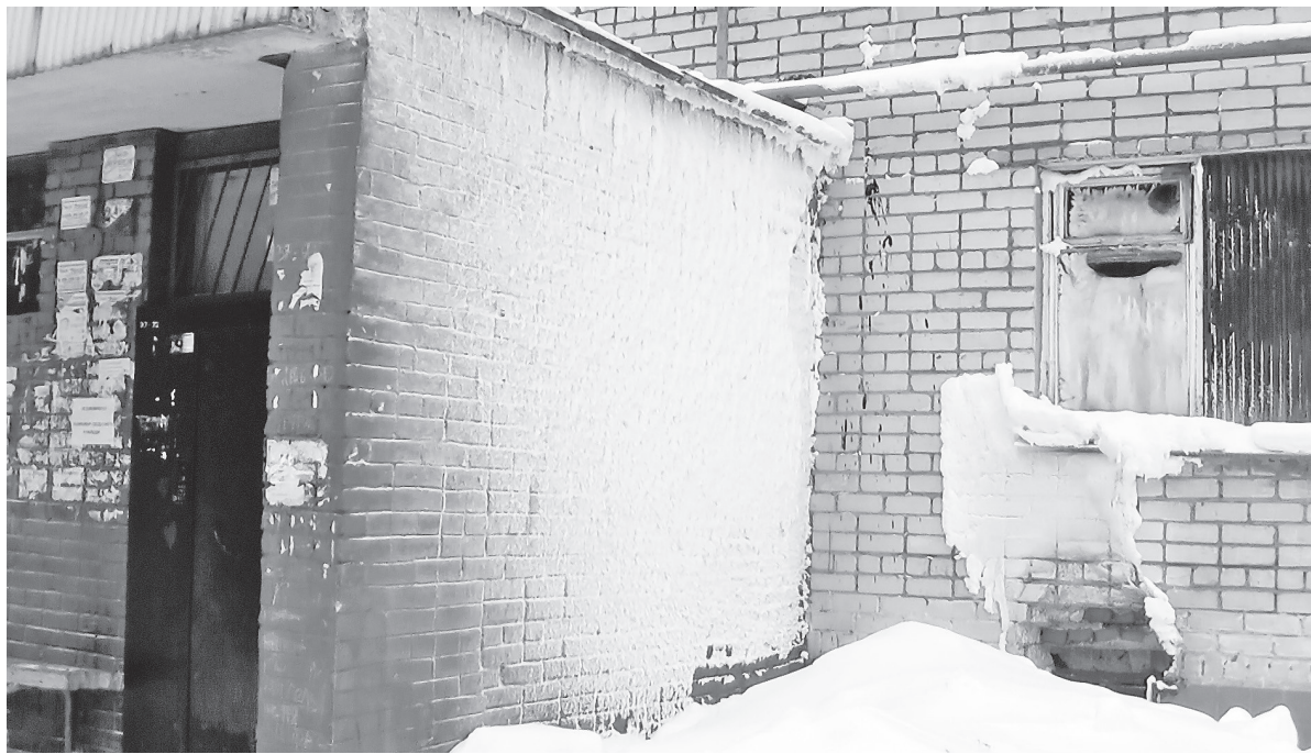
Кружак на фасаде по ул. Машиностроителей, 12.

компании опасаются его включать, чтобы не поразило током. Пробрались с фонариками. В центре подвала — большое «озеро» парящей воды, подступы к нему «заболочены». Температура достаточно высокая. Источником, питающим подземный водоем, оказался лоток сетей водоснабжения, из которого вода ручьем орошала землю. Работник УК сунул руку в парящий поток и, даже не поморщившись, озвучил, что бежит кипятком, в чем мы несколько не сомневались, стоя посреди паровой завесы. От этого «озера» диаметром около десяти квадратных метров страдают квартиры первых этажей. И даже фасад дома покрылся инеем около мест с подвальными окошками. Работники УК пояснили, что мно-