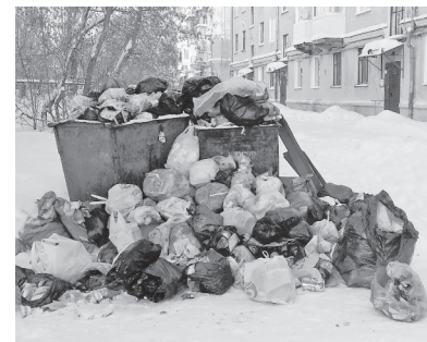
Ул. Свердлова, 26.

О том, как коммунальщики трудились в праздники