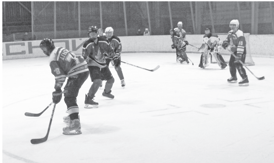
Момент финального матча «Спартак» – «Комета».