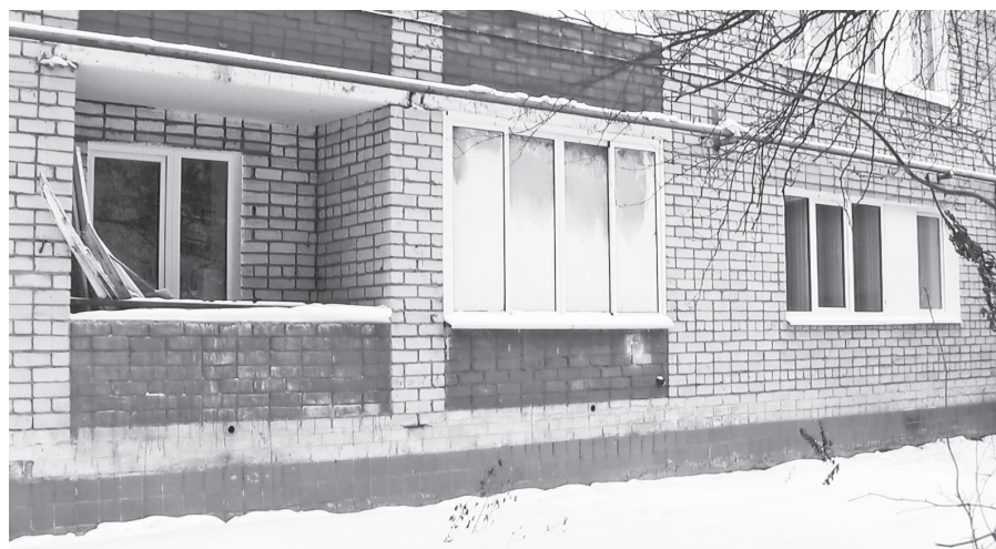
Окна леденеют от испарины.

Комиссия установила порывы на сетях горячего водоснабжения и предположительно холодного водоснабжения этих домов, ведущих к расположенному ниже дому номер 12. Плюс к этому, представители управляющей компании предполагают, что есть еще один порыв на трубопроводе ХВС, непосредственно у этого дома. Итого вода от мест трех порывов стекает в подвал Машиностроителей, 12. Компании, обслуживающие сети водоснабжения, обязаны их устранить. Главный вопрос теперь — когда они это сделают? ■