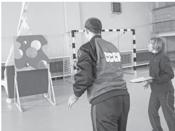
Момент спортивного праздника.

В перерывах свое мастерство присутствующим показали