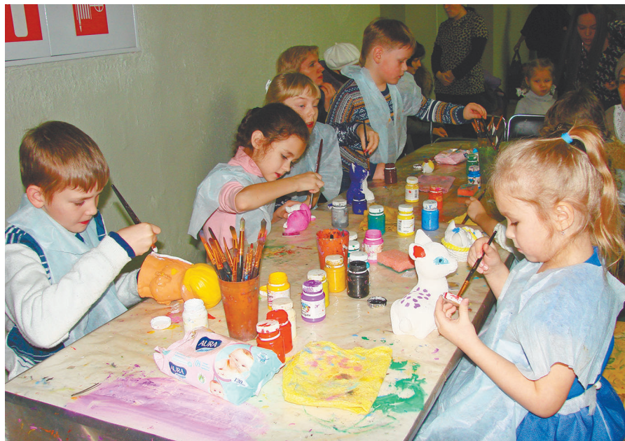
В мастерской Деда Мороза кипит работа юных художников.

Несмотря на морозную погоду, на одиннадцатичасовом представлении, что я посетила 3 января, в зале был аншла, впрочем, как и на последующих сеансах. Детишки в сопровождении мам и пап демонстрировали свои новогодние костюмы, общались, с удовольствием рукоделили в «Мастерской Деда Мороза», кружились в хороводе и с радостью смотрели новую сказку. В ат-