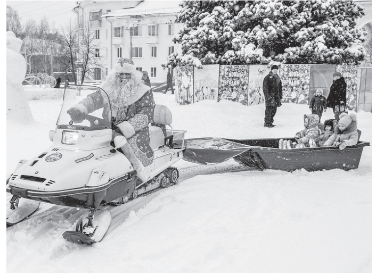
Желающие смогли прокатиться на снегоходе.