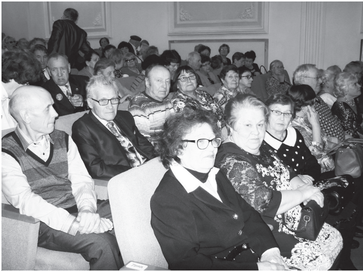
В зале СКДЦ - аншлаг.

В КАНУН УХОДЯЩЕГО ГОДА В СТРАНЕ ПРОХОДИЛИ МЕРОПРИЯТИЯ, ПОСВЯЩЕННЫЕ 5-ЛЕТНЕМУ ЮБИЛЕЮ РОССИЙСКОЙ НЕКОММЕРЧЕСКОЙ ОБЩЕСТВЕННОЙ ОРГАНИЗАЦИИ «ДЕТИ ВОЙНЫ». НЕ ОСТАЛИСЬ В СТОРОНЕ И ЛЕСНИЧАНЕ, ПОДДЕРЖАВШИЕ ОБЩЕСТВЕННОЕ ДВИЖЕНИЕ, ОБЪЕДИНЯЮЩЕЕ ОКОЛО ТРЁХ ТЫСЯЧ ВЕТЕРАНОВ, РОДИВШИХСЯ В ПЕРИОД С 1928 ПО 1945 ГОДЫ.