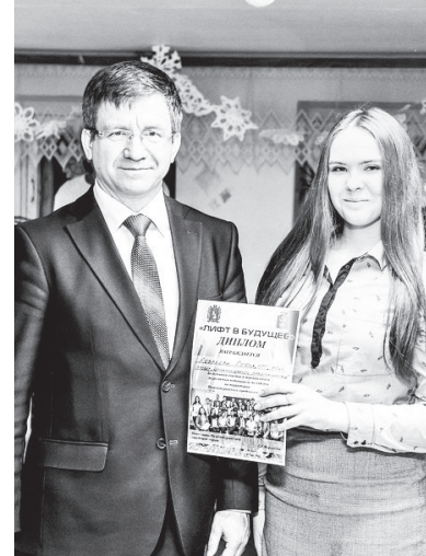
На итоговой встрече в клубе «Ровесник»

1-е общекомандное место по физической подготовке — коман-