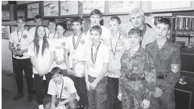
Победители военно-спортивной игры «Патриот».

ЗАКОНЧИЛСЯ ПО-НАСТОЯЩЕМУ ЯРКИЙ, НАСЫЩЕННЫЙ СОБЫТИЯМИ ГОД В ОБЛАСТИ МОЛОДЕЖНОЙ ПОЛИТИКИ, МОЖНО ПОДВЕСТИ ИТОГИ.