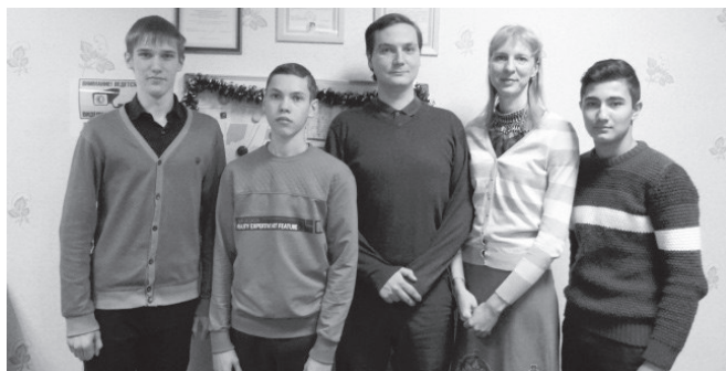
На первом заседании комиссии.