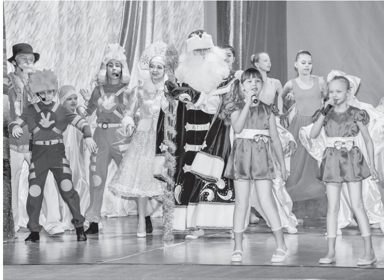
Спектакль получился ярким и зрелищным.