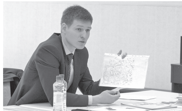
Представляю свою программу по развитию Лесного.

Хочется отметить, что ни один из кандидатов по округу № 13 за время предвыборной гонки