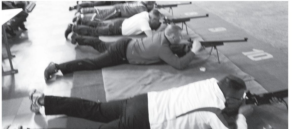
На линии огня.

XXI Спартакиада среди сотрудников администраций муниципальных образований Свердловской области. Лесной. Стрелковый тир. 20.05.2017