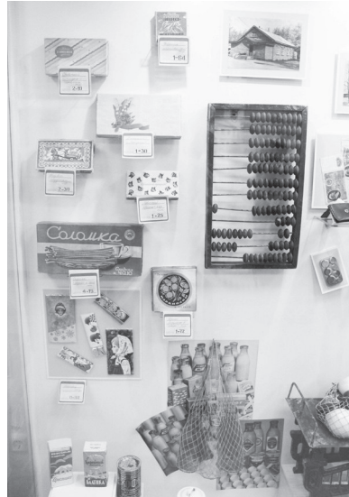
Тем, кто родился в 50 х -70 х гг., эти вещи знакомы.

АКЦИЯ «НОЧЬ МУЗЕЕВ» — СЛАВНАЯ ТРАДИЦИЯ, КОТОРАЯ ОБЪЕДИНИЛА ПОКОЛЕНИЯ И СТРАНЫ.