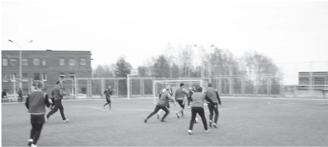
Борьба за мяч.

В поединке «Спартак» — «Пилот» команда отдела 037 поразила ворота противника уже