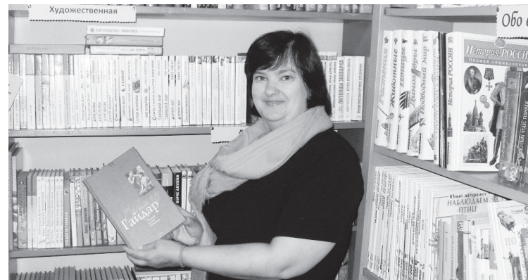
Среди верных друзей — книг.