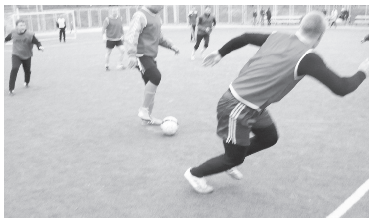
Момент игры «Высота» — «Коннект».