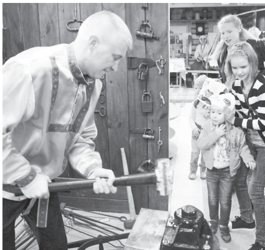
Удар кувалдой - и монетка готова.