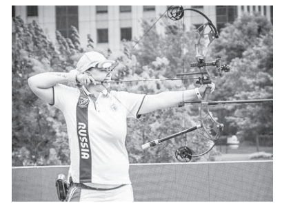
К. Перова. ФОТО ИЗ СЕТИ ИНТЕРНЕТ

В ШАНХАЕ (Китай) завершился первый этап Кубка мира по стрельбе из лука. Сборная России приехала на этап мирового кубка в Шанхай в полном составе, предварительно проведя сбор в другом прибрежном китайском городе — Гуанчжоу.