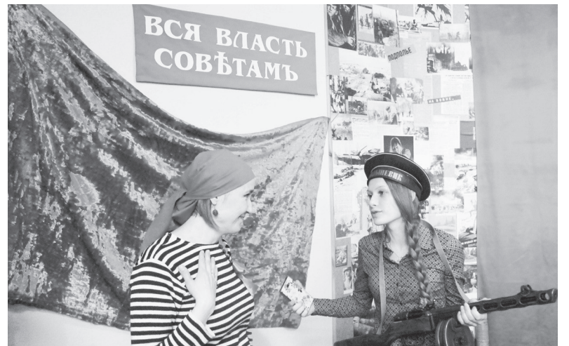
Вспоминаем прошлое нашей страны.

ним только винтажным образом революционера никто не ограничился, в выставочном зале посетителей ждала фотозона «Закадрись» с забавными аксессуарами от фотосалона Н. Белоусовой.