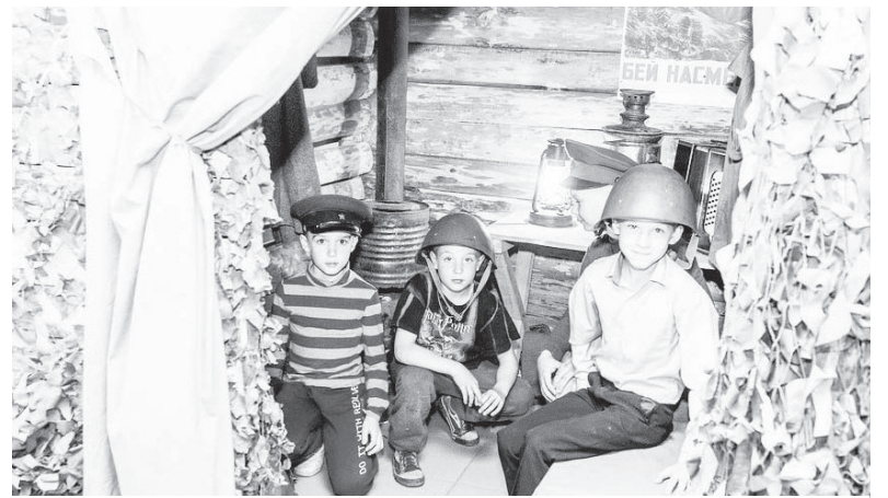
Инсталляция землянки в зале «Дорогами войны».

Результатам двадцатилетнего правления императора Николая II и сравнительному анализу экономического положения в России до и после революции была посвящена презентация „Благовестуя о царских днях“. История гибели царской семьи, возведения Храма-на-Крови, возникновения крестных ходов на Ганину яму произвели неизгладимое впечатление на посетителей музея. А фотоконкурс, посвященный детским крестным ходам по старой Коптяковской дороге, поразила узнаваемостью лиц.