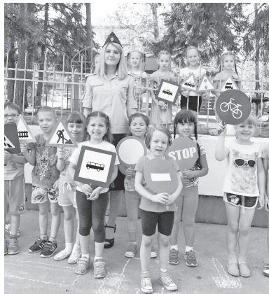
В детском саду «Гнездышко» побывали сотрудники ГИБДД.

В ПЕРИОД летних каникул, с целью профилактики детского дорожно-транспортного травматизма, сотрудниками Госавтоинспекции по Нижнетуринскому городскому округу в детском саду «Гнездышко» проведено мероприятие по вопросам обеспечения безопасности дорожного движения.