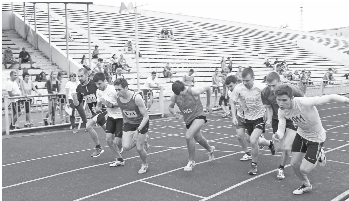
Старт забега на 3000 м.