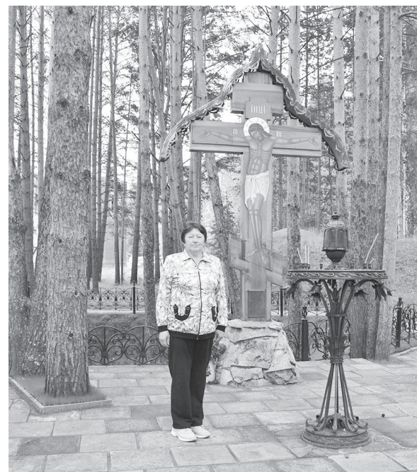
У Поклонного креста на месте гибели князей Романовых.

Наверняка многие нижегородцы побывали на территории монастыря на Ганиной Яме. Посетите и место близ села Нижняя Синячиха, где расположен монастырь во имя Новомучеников Российских. Наверняка этим вы обогатите свои знания и душу, прикоснувшись к святому. Вдыхая особый, насыщенный хвоей воздух, в тени здешних сосен, особенно остро ощущаешь всю несправедливость произошедшей здесь трагедии, забывая которую мы не имеем права.