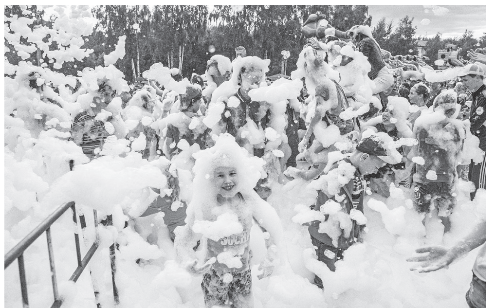
«Пенная вечеринка» началась.