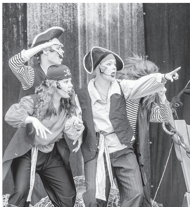
Фрагмент игрового спектакля «Остров сокровищ».

нижнетуринцев порадовали как доморощенные артисты, так и представители творческих коллективов из Екатеринбурга: вокальный проект «Ultimatum», танцевальный — «Formidable», а также ВИГ «EVERYBODYDANCE».