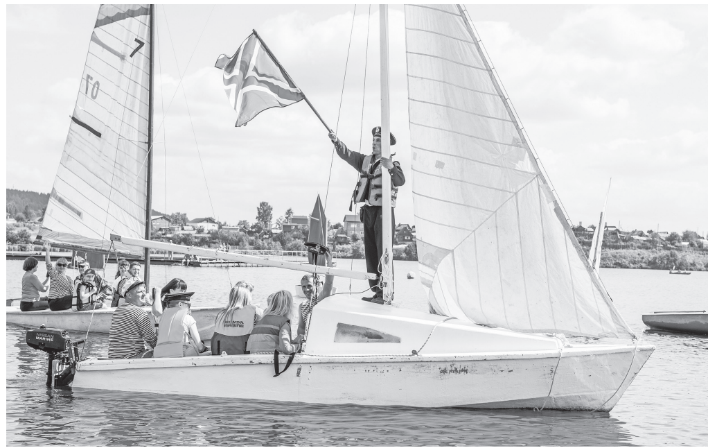
С праздником всех моряков и их семьи