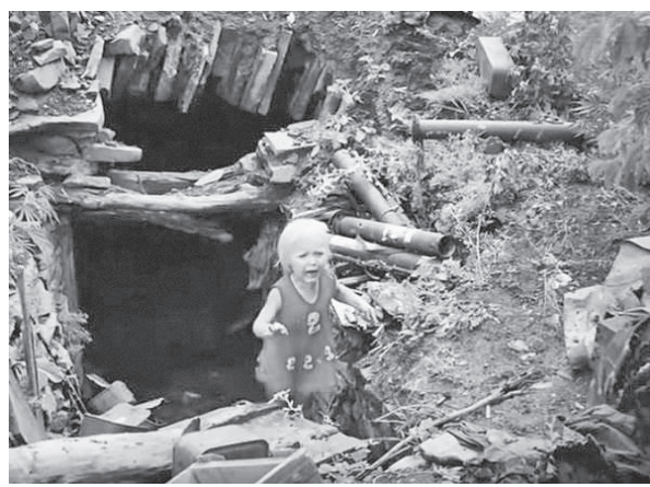
В чём виноваты дети?