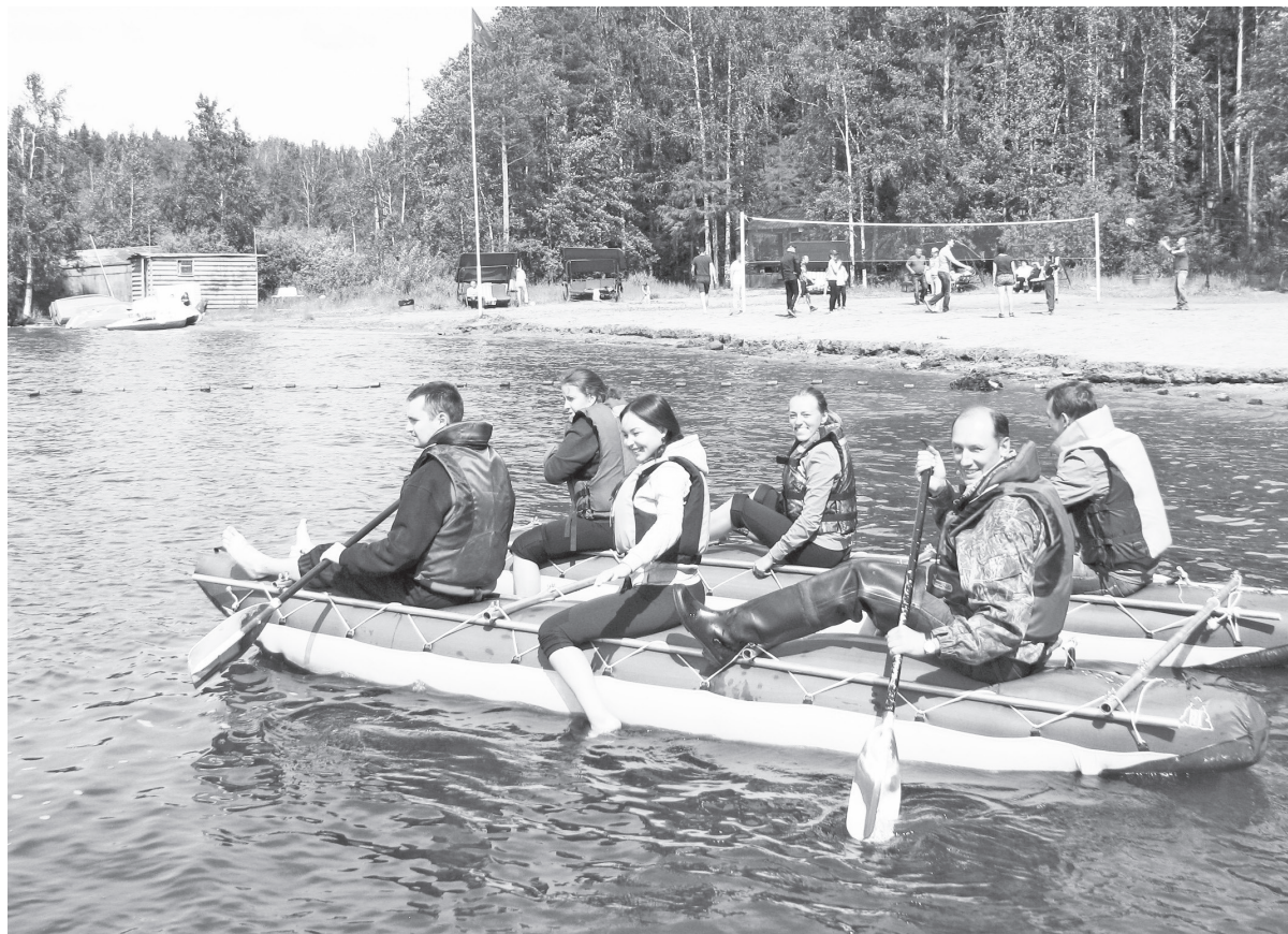
У кого игра в волейбол, а у нас — заплыв на катамаране.