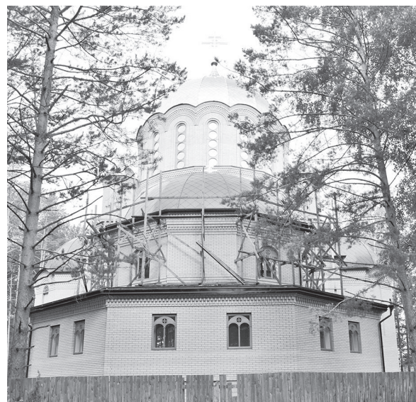
Идет строительство нового храма.

Тогда, в самый разгар братоубийственной войны, здесь большевиками были казнены князь и княгиня царской крови. Случилось это на следующую ночь после расстрела царской семьи в подвале Ипатьевского дома в Екатеринбурге. К Алапаевску в то время приближались белогвардейцы. Ночью высокопоставленных особ, содержащихся под арестом в здании Напольной школы в Алапаевске, разбудили. Под предлогом перевода узников на Верхне-Синячихинский завод им связали руки, завязали глаза и, посадив на повозки, повезли к северу от Алапаевска. Несмотря на ночное время, нашлись очевидцы, видевшие процессию. Наверняка князь догадывались, для какой цели их везут. Лошадей остановили в тёмном лесу около заброшенной шахты, арестантов подвели к зияющему в земле отверстию. Вот их имена: — великая княгиня Елизавета Фёдоровна Романова; — великий князь Сергей Михайлович;