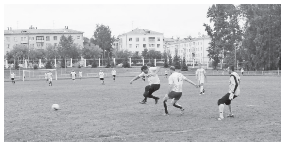
Играют «Чистая сила» — «Прогресс».

Скорее всего, они привлекли внимание обострением спора за звание лучшего бом-