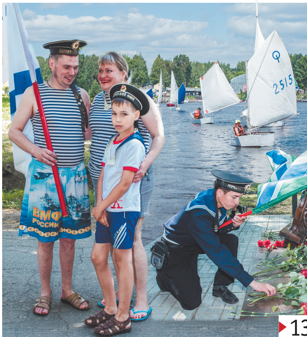
В Лесном отметили День ВМФ России. ФОТО С. ЧИКИШЕВА, КОЛЛАЖ Р. АВЕДОНОВА