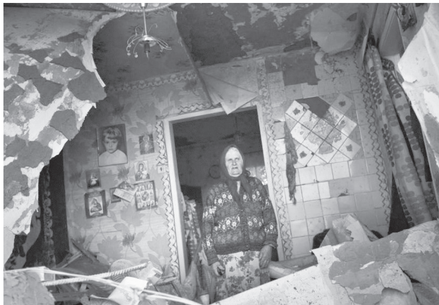
Всё, что осталось от родного дома...