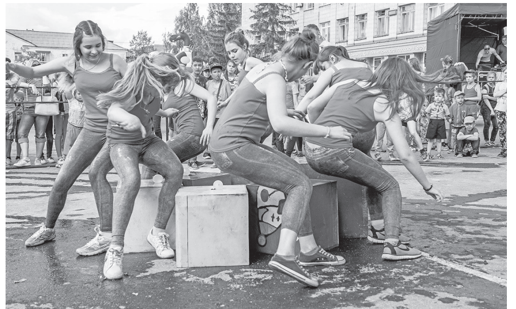
Момент игры водного шоу «Атака Капитошек».

Не обошлось, конечно, и без концертных программ. Перед гостями праздника выступил народный ансамбль русской и казачьей песни «Забав», а вечером во время концерта «Танцуй и пой, любимый город!»