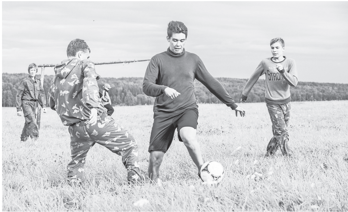
Турнир по футболу. В форме цвета «хаки» команда Нижней Туры.