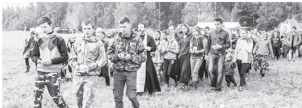
Крестный ход.

Стоит отметить, что «Каменный пояс» с каждым годом становится всепопулярнее. Об этом говорит постоянно растущее число участников турслета и то, что его на этот