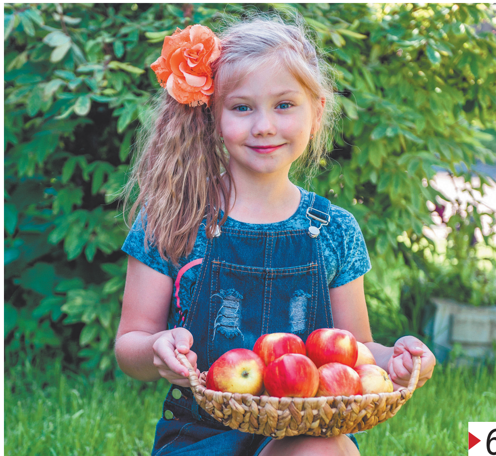
Яблочный Спас или Преображение Господне отмечается 19 августа.