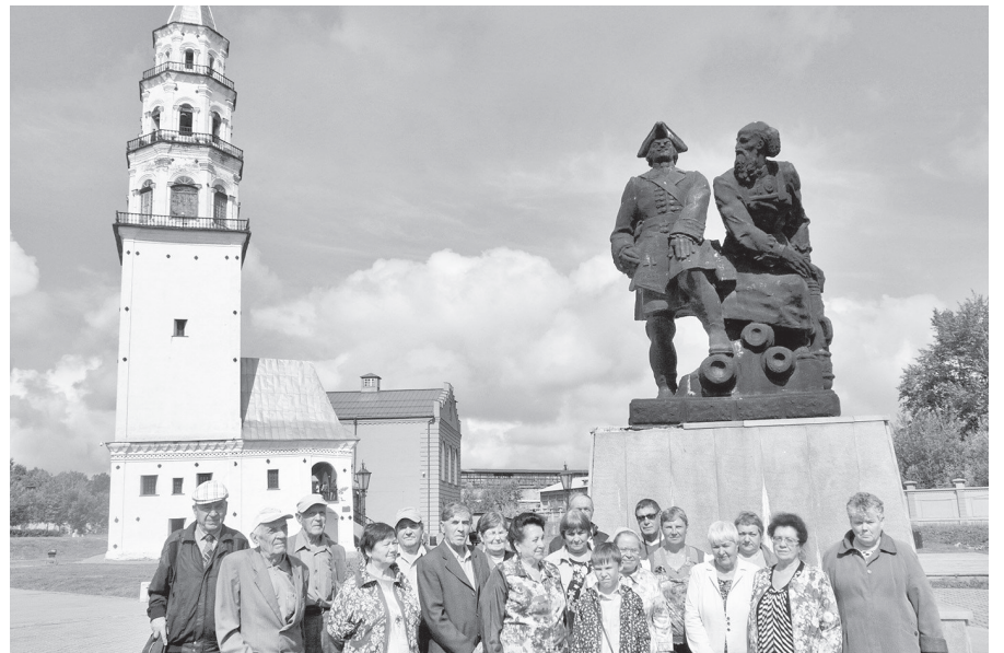
Представители нижнетуринского отделения ВОС в городе Невьянске.

Почва, размытая грунтовыми водами, не выдержала многотонного давления основания, оно начало съезжать и накренилось. Чтобы выровнять конструкцию, кирпичи всех последующих ярусов ссылали под определенным углом — это придало стро-