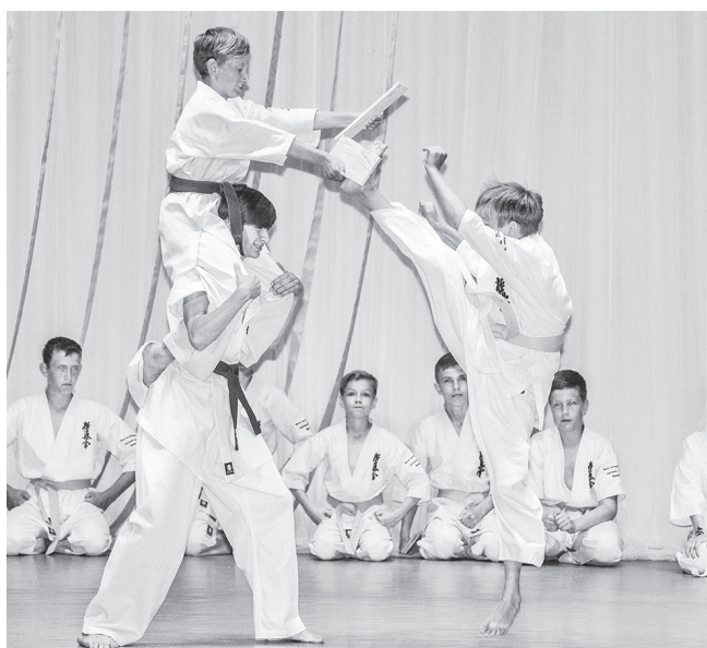
Показательные выступления юных воспитанников школы каратэ Кёкусин «Бонсай».