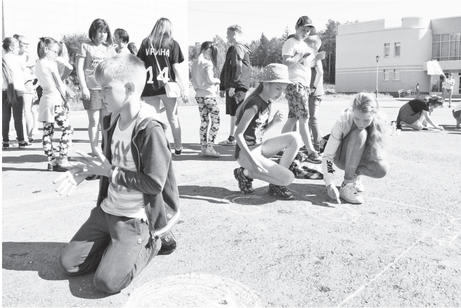
Увлеченно работают художники каждого отряда.