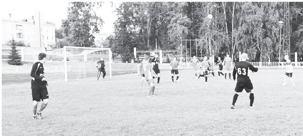
Эпизод встречи «Прометей-1» — «Лада-Луч».