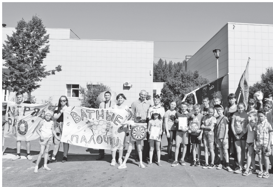
Лагерь отдыха «Солнышко». Победители конкурса рисунков на асфальте. 15.08.17.

А тем временем, пока болельщики развлекались и наслаждались яркой солнечной погодой, асфальт на главной площади «Солнышка» расцвечивался всеми цветами радуги, и 13 тематических рисунков-композиций осматривало строгое жюри. Старший отряд подарил одно очко в зачет отряда малышам — и этот воспитательный момент отме-