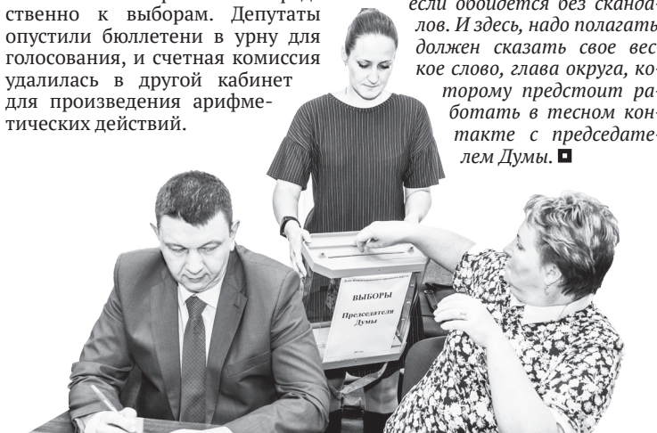
Второй тур тайного голосования.

Р.С. После политической «лихорадки» начала 2017 года в Нижней Туре была надежда, что разногласия во властных кругах себя уже исчерпали. Однако прошедшее заседание Думы показало, что сейчас полного согласия между депутатами нет. А это означает, что в ближайшее время, вполне вероятно, нас ожидают увлекательные перипетии политической борьбы, которые могут сказаться на жизни всего НТГО. Хорошо, если обойдется без скандалов. И здесь, надо полагать, должен сказать свое веское слово, глава округа, которому предстоит работать в тесном контакте с председателем Думы. ■