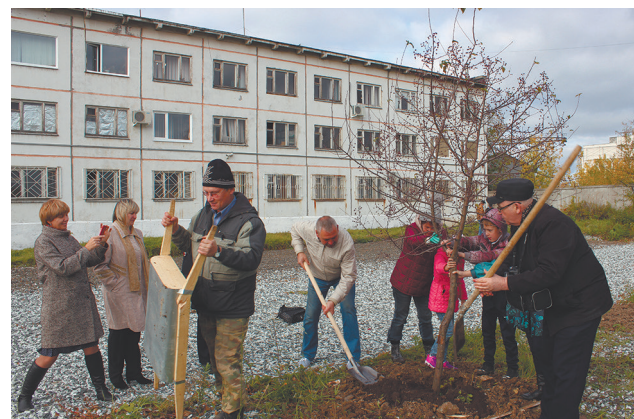
И будет город-сад!

Перед стражами порядка стояла важная задача – донести детям всю необходимость и важность данного мероприятия. Каждый внес в общее дело частичку своей души. Чистая и ухоженная территория порадовала окружающих. Подобные мероприятия воспитывают у школьников патри-