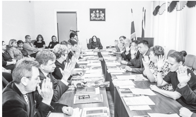
Дума голосует за список кандидатов на пост председателя.

В МИНУВШУЮ ПЯТНИЦУ ДЕПУТАТЫ 6 СОЗЫВА ДУМЫ НТГО СОБРАЛИСЬ НА ПЕРВОЕ СВОЕ ЗАСЕДАНИЕ. НО НЕ ВСЕ ПРОШЛО ТАК ГЛАДКО, КАК ПЛАНИРОВАЛОСЬ. ГЛАВНЫМ ВОПРОСОМ ПОВЕСТКИ ДНЯ БЫЛИ ВЫБОРЫ ПРЕДСЕДАТЕЛЯ ДУМЫ. НО ИМЕННО ЭТОТ ВОПРОС И ОСТАЛСЯ НЕРЕШЕННЫМ.