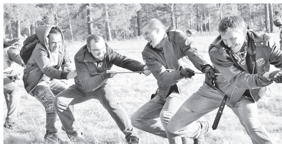
Кто кого?

16 СЕНТЯБРЯ НА ПОЛЯНЕ «СОЛНЕЧНОЙ» СОБРАЛОСЬ БОЛЕЕ 70 БАЙКЕРОВ ИЗ ГОРОДОВ: КУШВА, ВЕРХНЯЯ ТУРА, КРАСНОУРАЛЬСК, НИЖНЯЯ ТУРА, ЛЕСНОЙ, УРЕНГОЙ, НИЖНИЙ ТАГИЛ, ХАНТЫ-МАНСКИЙСК, СЕРОВ. БАЙКЕРАМИ ИЗ БАЙК-КЛУБА «ЛЕСНЫЕ БРАТЯ» (Г. ЛЕСНОЙ И Г. НИЖНЯЯ ТУРА) БЫЛО ОРГАНИЗОВАНО ПРАЗДНИЧНОЕ ЗАКРЫТИЕ МОТОСЕЗОНА-2017.