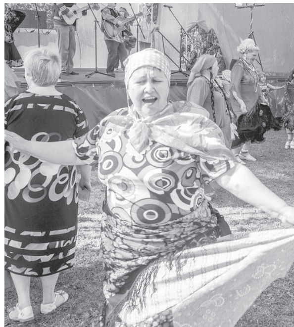
На городском турслёте пенсионеров, август 2017.

Принимали мы в этом году непосредственное участие и в торжествах, по-