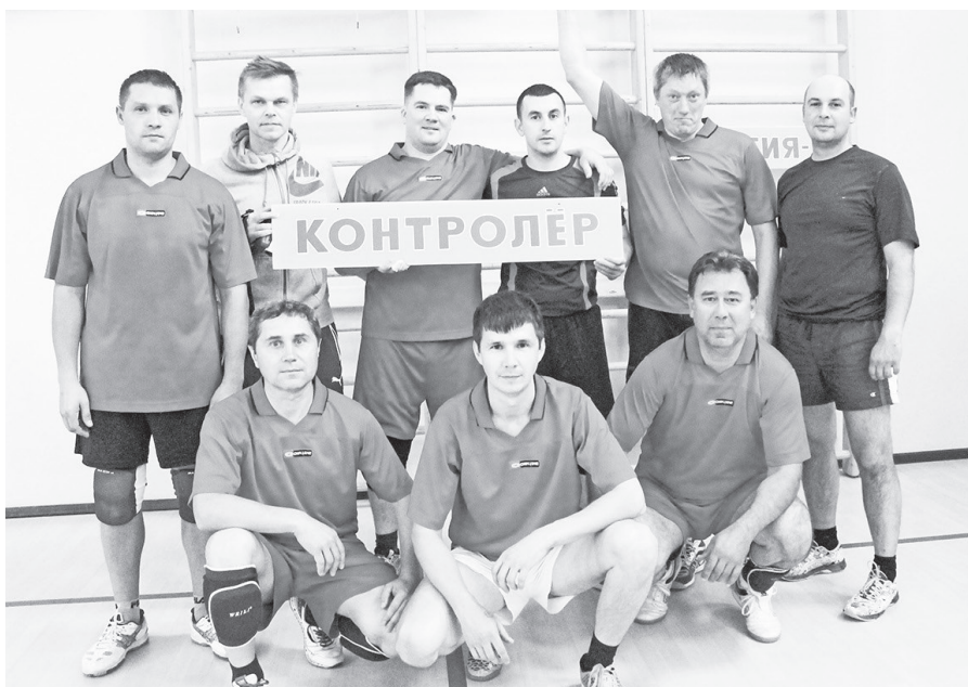
«Контролёр» впервые стал чемпионом Спартакиады.

Спартакиада трудовых коллективов комбината «ЭХП». 3 группа. Лесной. Дом физкультуры. 11-14.09.2017