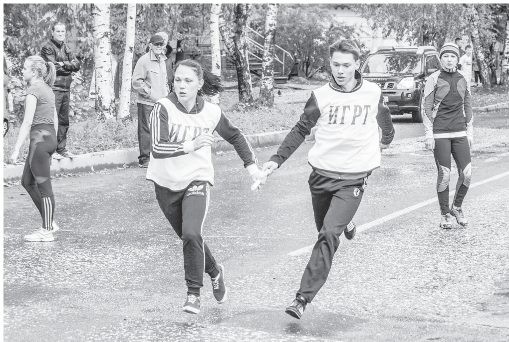
Передача эстафетной палочки.