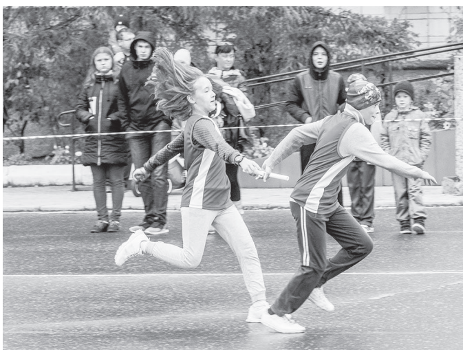
Эстафета в младших группах.

По итогам соревнований победителями эстафеты названы: 1 группа —