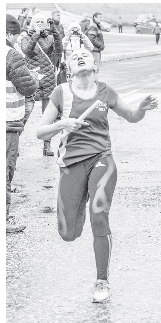
Финиш. Из последних сил.