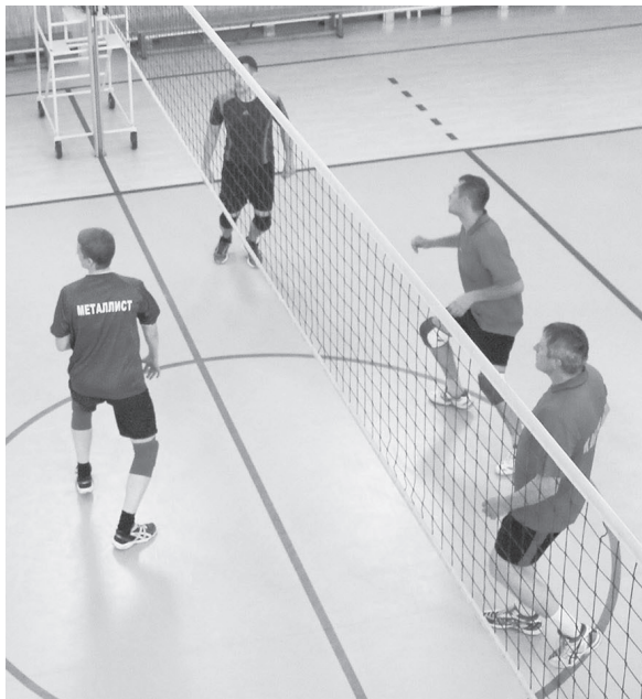
Фрагмент игры «Металлист» — «Контролёр».

ВТОРАЯ НЕДЕЛЯ ТУРНИРА ПОДВЕЛА ЕГО ОБЩИЕ ИТОГИ, ОПРЕДЕЛИВ ПОБЕДИТЕЛЕЙ И ПРИЗЕРОВ.