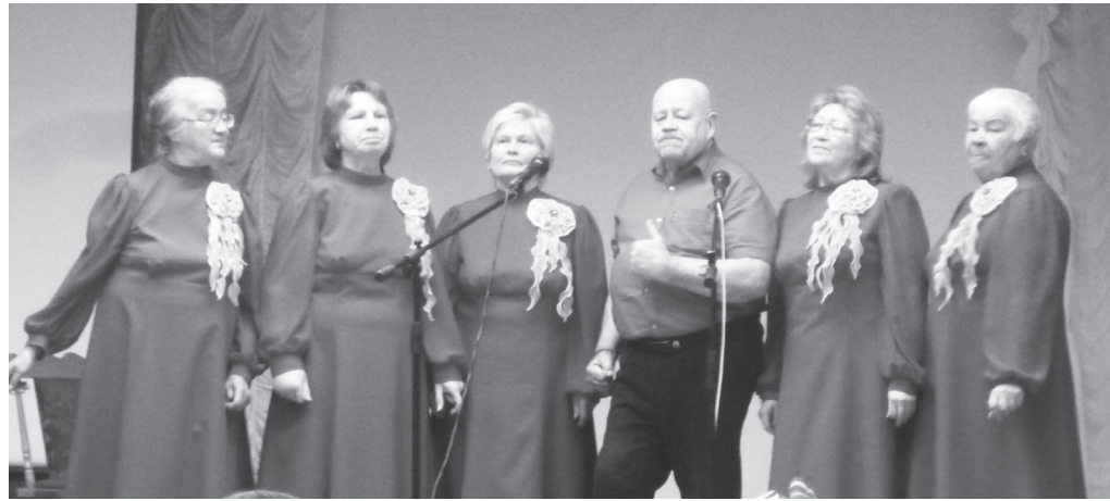
Ансамбль «Лейся, песня!»