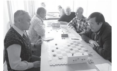
Момент второго тура.

МАЛОЕ количество участников (8), причем только титулованных (1 гроссмейстер, 7 кандидатов в мастера), справедливая двухкруговая формула турнира, регламент (45 минут на одну партию), создающий условия для творческого поиска — в такой обстановке просто приятно играть!