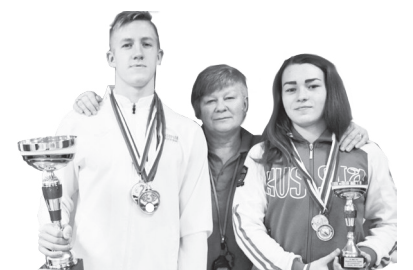
Чемпионат и Первенство Уральского федерального округа

22-26 ОКТЯБРЯ в Ревде проходил Чемпионат и первенство УрФО по плаванию. В соревнованиях участвовало 318 спортсменов, среди них 6 мастеров спорта международного класса и 51 мастер спорта России.