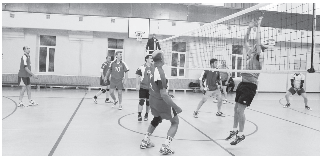
Момент игры «Наука» — «Знамя».

Четверг еще больше прояснил ситуацию в турнирной таблице. «Наука» во встрече с «Контроле-