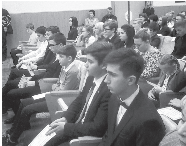
Талантливые дети Лесного.