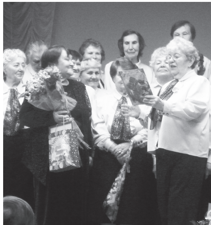
Любимому руководителю посвящается...

Да какие они бабки — хочется воскликнуть, глядя на этих жизнерадостных, с задорными искорками в глазах, женщин! Педагоги, привыкшие к четкому ритму профессиональной жизни, на пенсии не смогли сидеть без дела — нашли отдушину в песне. Хор для них — это большая семья, где вместе справляют праздники и дни рождения, делятся радостями и горестями, помогают друг другу в житейских ситуациях. Секрет долголетия коллектива — активная жизненная позиция, оптимизм и жизнелюбие. А еще — верность своему зрителю и желание дарить слушателям радость от встречи с песней. И, конечно же, — неутомимость