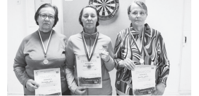
Призёры среди женщин.

28 ОКТЯБРЯ в Доме физкультуры прошло личное первенство по дартсу среди людей с ограниченными физическими возможностями.