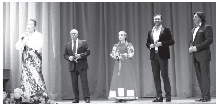
Финальный выход участников концерта под овации зала