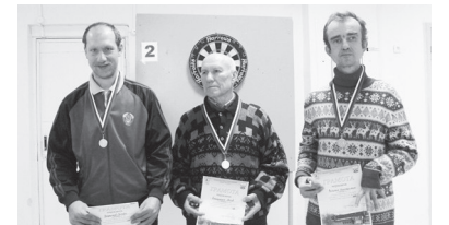
Призёры среди мужчин.