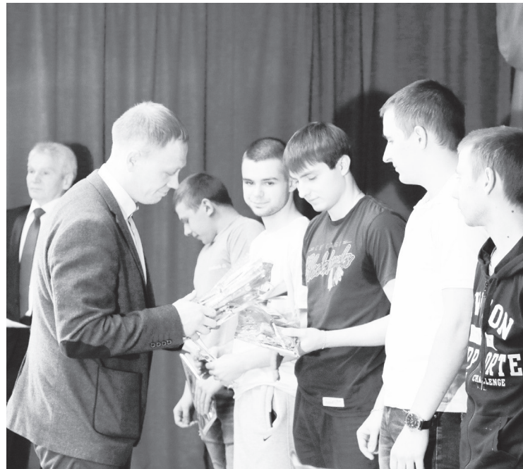
Вручение призывникам памятных сувениров.