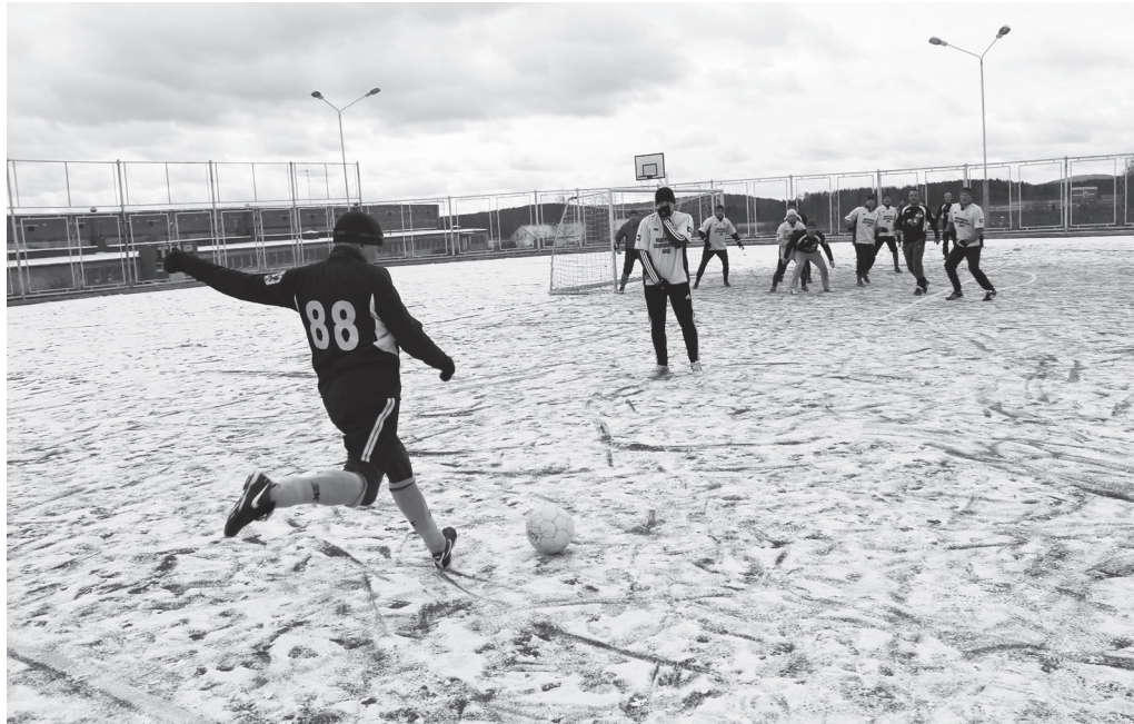
В таких условиях проходил полуфинал «СКА» — «Лада».