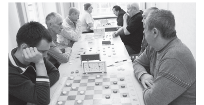
Момент третьего тура.