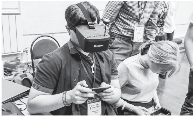
Очки виртуальной реальности помогли управлять роботами.