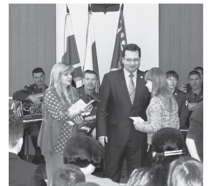
На церемонии вручения паспортов юным лесничанам

В ЗДАНИИ администрации г. Лесного по традиции прошла церемония вручения паспортов юным лесничанам, с участием их родителей, родных, близких, друзей. Мероприятие было посвящено Дню сотрудников органов внутренних дел и предстоящему Дню матери.