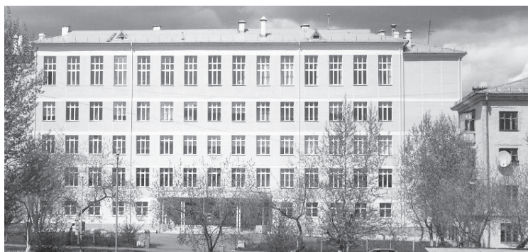
Лицей Лесного недавно отметил 25-летие

— Объективная реальность дня сегодняшнего такова, что материальная поддержка оказывается адресно — только тем, кто действительно в ней нуждается. Мы не мо-