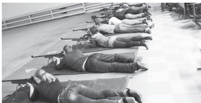
Очередная смена на линии огня.

НЕЧАСТО МОЖНО УВИДЕТЬ ТАКОЕ СТОЛПОТВОРЕНИЕ В СТРЕЛКОВОМ ТИРЕ: «НА ЛИНИЮ ОГНЯ» ВЫШЛИ В ОБЩЕЙ СЛОЖНОСТИ 110 МУЖЧИН И 127 ЖЕНЩИН. А ЕСЛИ ДОБАВИТЬ К ЭТОМУ, ЧТО ПРАКТИЧЕСКИ У КАЖДОГО КОЛЛЕКТИВА ЕСТЬ СВОИ ВОЛЕЛЬЩИКИ, ТО МОЖНО ПРЕДСТАВИТЬ, НАСКОЛЬКО БЫЛО НЕПРОСТО ПОДДЕРЖИВАТЬ ПОРЯДОК В СПОРТСООРУЖЕНИИ.