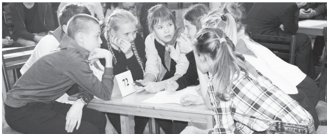
Юные лесничане на открытии фестиваля «Выше радуги - 2017»

ся на уровне бюджета-2017, а как нарежет «бюджетный пирог» новый депутатский корпус — мы в скором времени увидим.