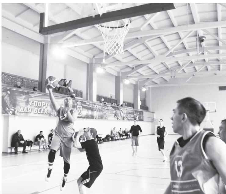
Играют «Чемпион» и «Спутник».

Молодые игроки оказались «не робкого десятка», сумев убедительно выиграть первую половину встречи. Но далее нижнетуринцы отладили взаимодействие и взаимозаменяемость баскетболистов на площадке, а юниоры неоправданно стали спешить с бросками — и маятник игры сразу качнулся в другую сторону. Сенсации не случилось — 63:56 (6:19, 16:20, 23:7, 18:10) в пользу Нижней Туры. У побе-