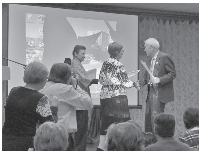
Награждение участников VII Краеведческих чтений. 2015 г.

К VII Библиотечным краеведческим чтениям в Лесном