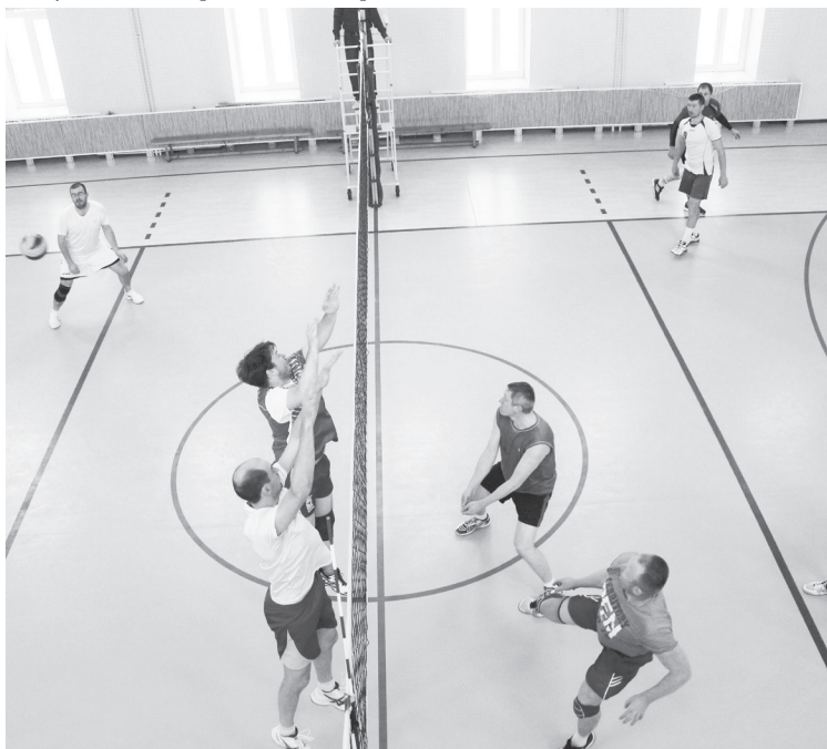
Эпизод матча «Буревестник» — «Ветераны».

В воскресенье вместо двух матчей прошел один — между командой «Буревестник» и сборной «ЭХП». Учитывая, что оба коллектива уже имели по одному поражению, еще один проигрыш фактически ставил крест на попадание в призеры и тех, и других. Первые три партии прошли в упорнейшей борьбе, а вот в четвертом сете игра у команды комбината просто-напросто развалилась. Победил «Буревестник» 3:1 (23:25, 25:22, 26:24, 25:11). ■