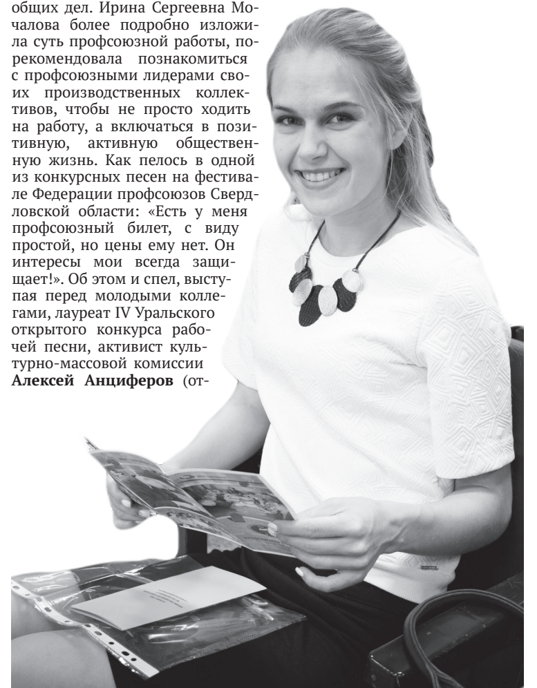
Первое знакомство с традициями профсоюза комбината «ЭХП»