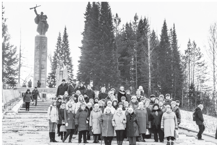
Участники митинга, общее фото на память

50 лет минуло с момента создания мемориального комплекса «Нижнетуринцам, погибшим в годы Великой Отечественной войны 1941-1945 гг.»