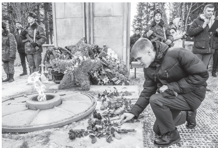
Возложение цветов к «Вечному огню» в память о погибших в Великой Отечественной войне

лись у Книг памяти, на которых нанесены имена 4,5 тысяч погибших земляков, и поняли, что работы по поддержанию в достойном состоянии мемориального объекта предстоит еще немало. И делать это надо постоянно, а не к особым датам и юбилеям. Уже сегодня хочется донести до всех жителей округа, что Екатеринбургской компанией проведена оценка технического состояния монумента с разработкой рекомендаций по его дальнейшей эксплуатации и реставрации. Осталось запланировать средства, наметить сроки и выполнить указанные реконструкционные мероприятия, чтобы еще долгие годы мы могли, преклонив колени, помолчать здесь и вспомнить подвиг своих погибших героев,