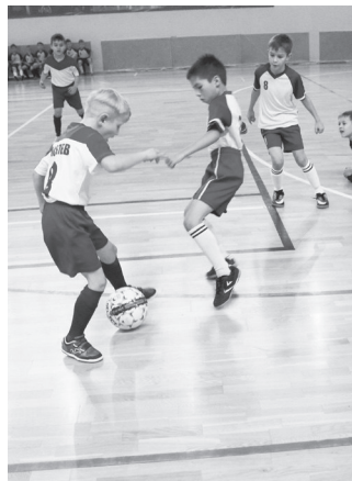
Встречаются «Факел» (Нижняя Тура) и «Синегорец» (Баранчинский).