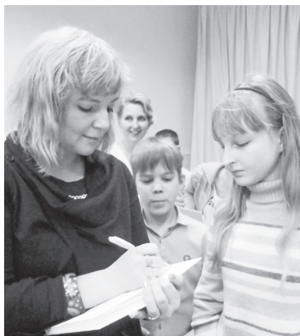
Автограф автора.

«Сидят два чудных миррика, Романтика и лирика».