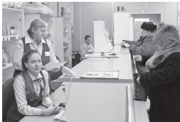
Не пустуют отделения почты Лесного. Ул. Белинского, 29 — широкий спектр услуг.