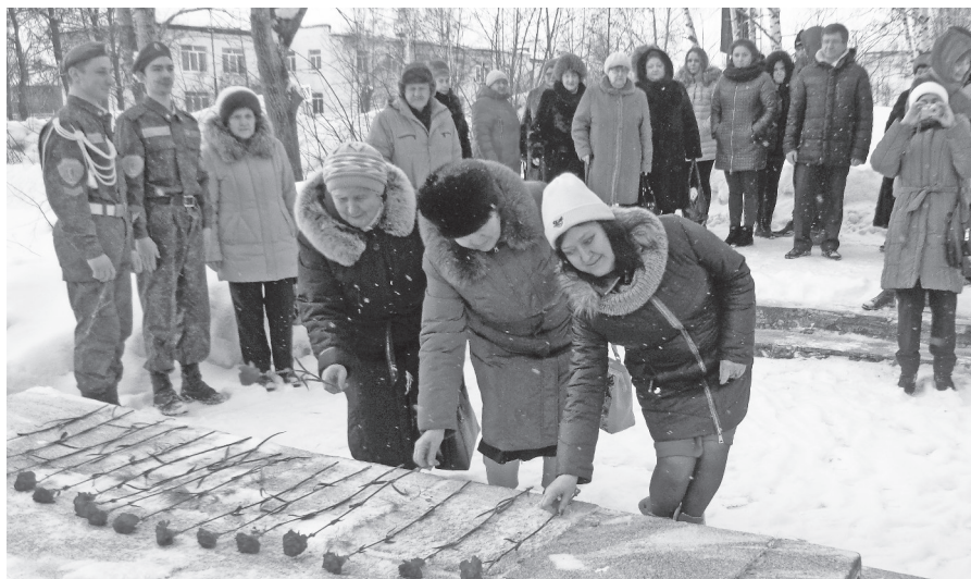
Возложение цветов к памятнику Героям-нижнетурурицам, сложившим головы в битве за Победу в Великой Отечественной войне.

Волги... И все мы, и ветераны, и молодежь, всегда должны помнить такие переломные, героические события в истории страны», — подчеркнул он. Минутой молчания почтили великий подвиг соотечественников воспитанники ВПИК «Русичи», скорбно склонили головы ветера-