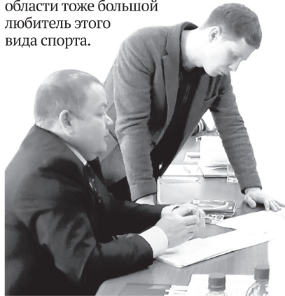
Во время приёма.