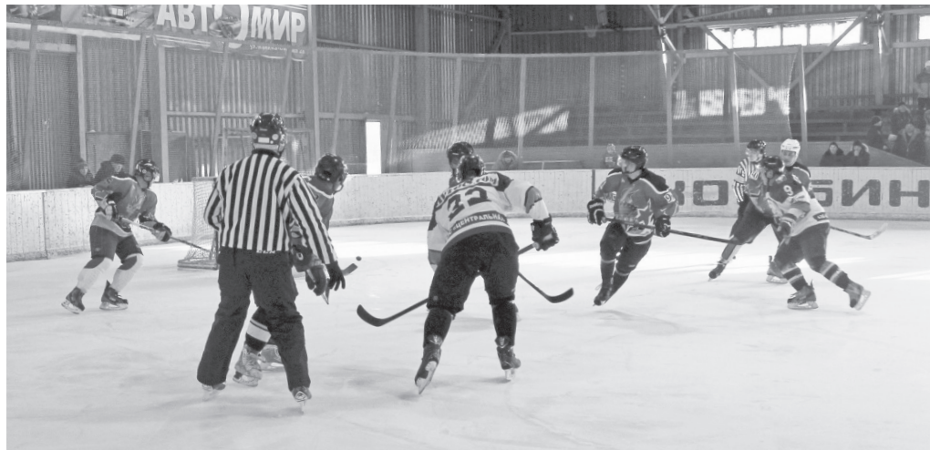
Эпизод встречи «Факел» — «Авто-8».