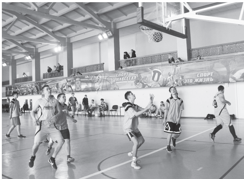
Играют «Старт» — «Космос-2».

Первыми на площадке вышли баскетболисты «Старта» и «Космоса-2». Первая половина встречи прошла с некоторым преимуществом баскетболистов цеха 112, которым к большому перерыву удалось создать 10-очковый задел. Однако далее в игре «Старта» пошли малопонятные пробежки, глупые потери мяча, а также смазанные броски из-под кольца — и маятник игры качнулся в другую сторону. Последние минуты «нервяк» присутствовал в игре обоих коллективов, и все закончилось побе-