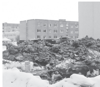
Место порыва, район ул. Чкалова, д. 9.

По сообщению представителя компании «РКС», холодную воду жители старой части Нижней Туры должны были получить 8 февраля (в среду), вечером.