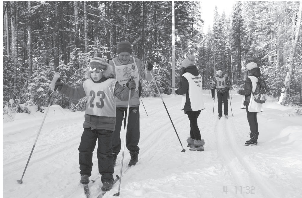
Трасса оказалась трудной.

4 ФЕВРАЛЯ В НИЖНЕТУРИНСКОМ ГОРОДСКОМ ОКРУГЕ НА ТЕРРИТОРИИ «ЕЛЬНИЧНОГО» СОСТОЯЛАСЬ ТРАДИЦИОННАЯ МАССОВАЯ ЛЫЖНАЯ ГОНКА «ЛЫЖНЯ РОССИИ — 2017».