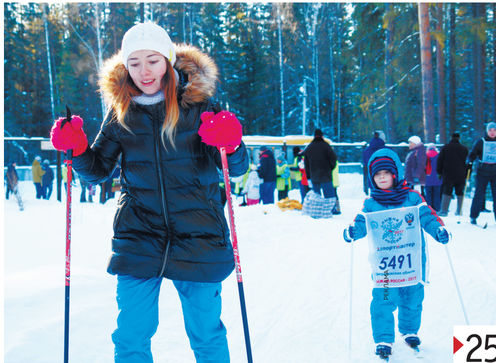
Нижняя Тура, «Ельничный», участники массового забега.