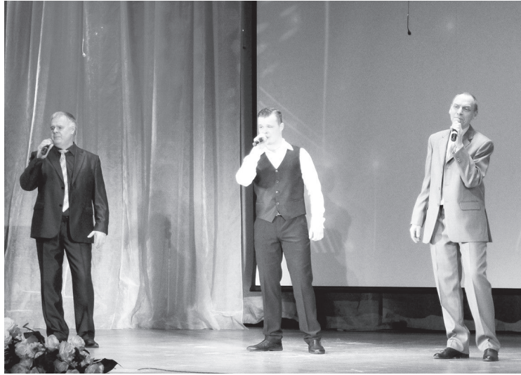
Браво восхитительному мужскому трио!

8 Марта — весенний праздничный день. В этот день женщины получают самые лучшие поздравления, наполненные заботой, уважением, добротой, лаской, благодарностью.