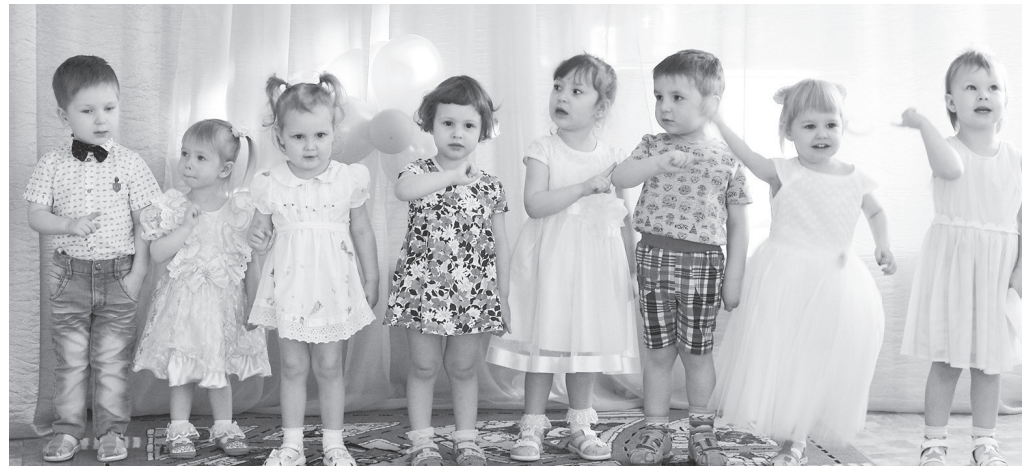
Ребятушки группы № 4 «Бабочки» поют песенку про маму