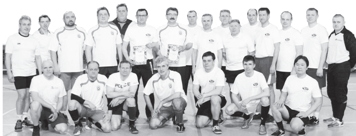
Общее фото на память об игре. Команды администрации и комбината «ЭХП».

Звучит финальная сирена, возвещающая о победе команды комбината 4:3. Соперники обмениваются рукопожатиями, фотографируются на память и обещают к следующей встрече подготовиться получше. ■