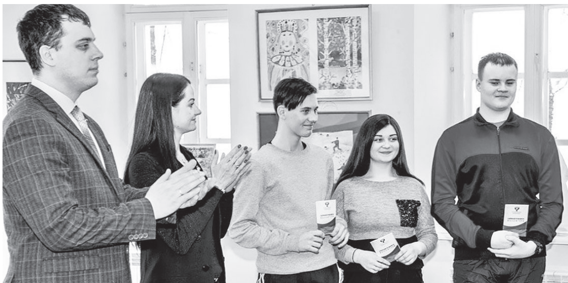
Молодёжь гордится статусом волонтера