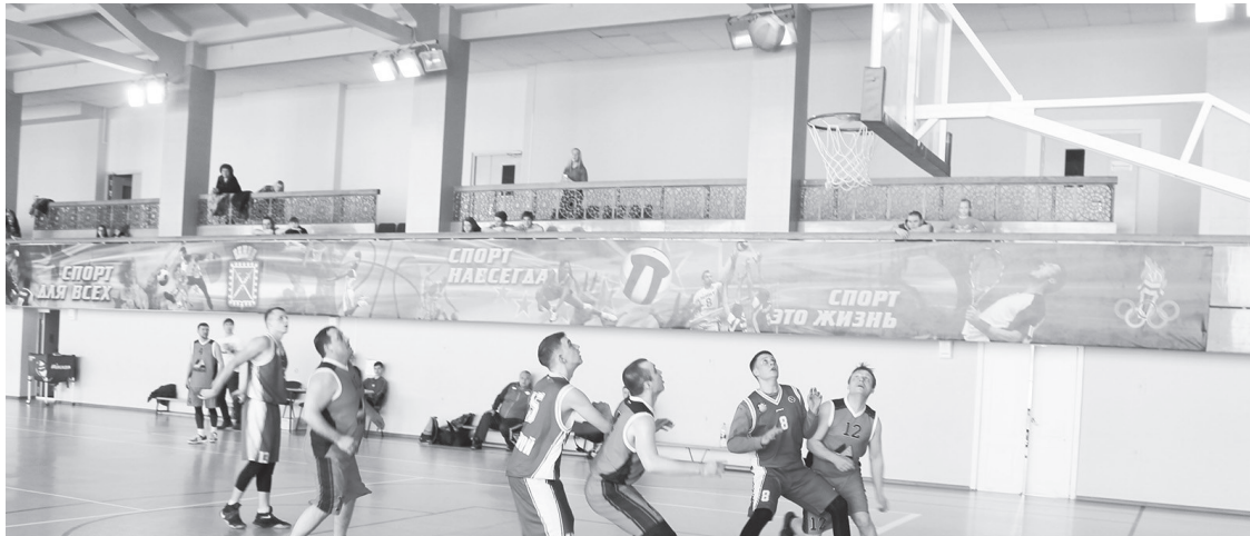
Играют «Космос» и «Тизол».

Первенство города. Лесной. ДС «Факел». 04.03.2018