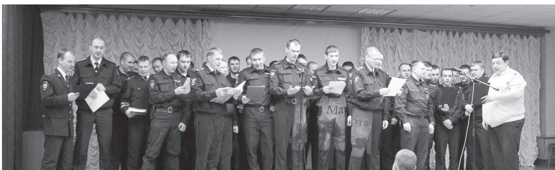
Поздравление от мужчин ОМВД

ОМВД РОССИИ ПО ГО «ГОРОД ЛЕСНОЙ»