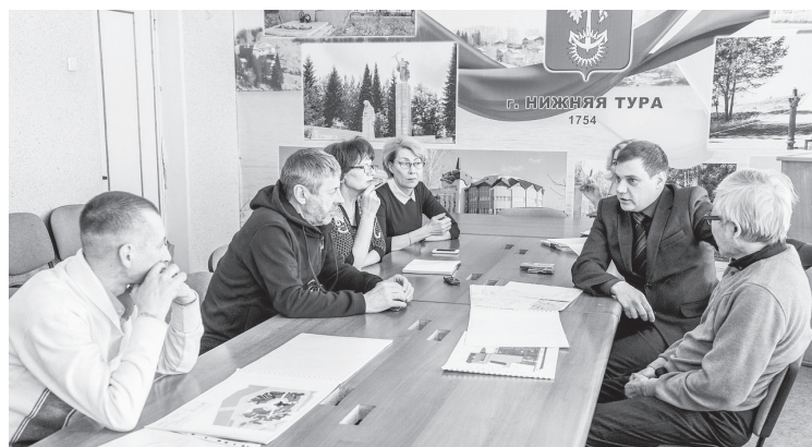
Идёт заседание комиссии