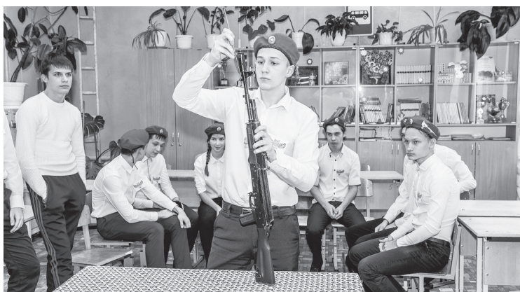
Школьники ловко обращаются с оружием

Все команды отлично справились с заданиями.