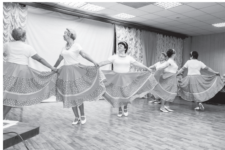
Танцевальный коллектив ЖЭКа-7