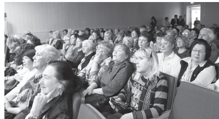
В зале был аншлаг!

Количество зрителей в зале было близко к аншлагу. Были и те, кто пришёл с комсомольскими значками. И вот игра началась. Первыми на сцену поднялись команды «Горящие сердца» (ЖЭК № 1) и «Три О» (совместно ОРС, ОВД и Управление образования). Выиграв 7:1, первой в финал прошла «Три О». В дуэли «Молодогвардейцы» (ЖЭК № 6) — «Верные друзья» (объединённая ко-