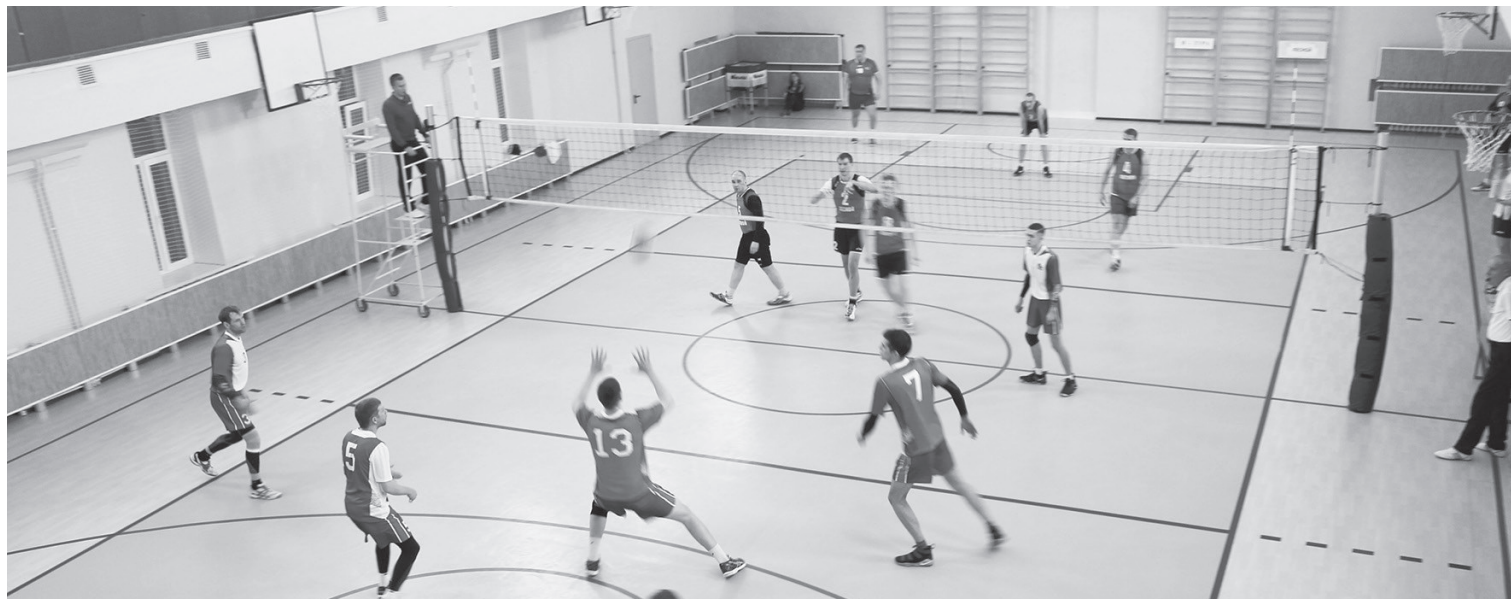
Эпизод игры «Факел» (г. Лесной) — «Dream Team» (г. Нижняя Тура).