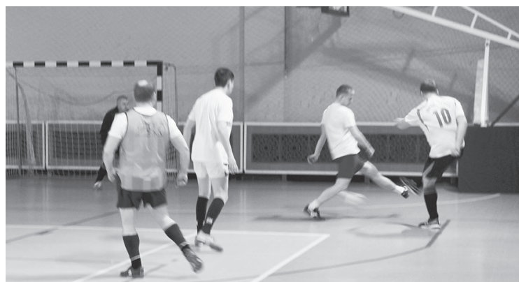
Оба соперника отдавались игре со всей страстью.