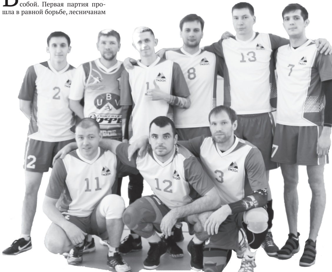
Команда «Dream Team» (г. Нижняя Тура).

Примечание: Лесной занял место выше Новоуральска по разнице выигранных и проигранных партий во всех встречах. ■