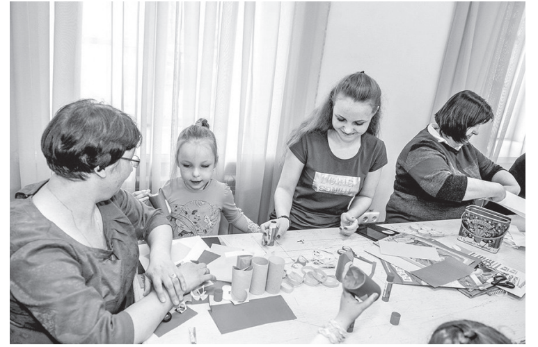
Мастер-класс «Белый цветок»