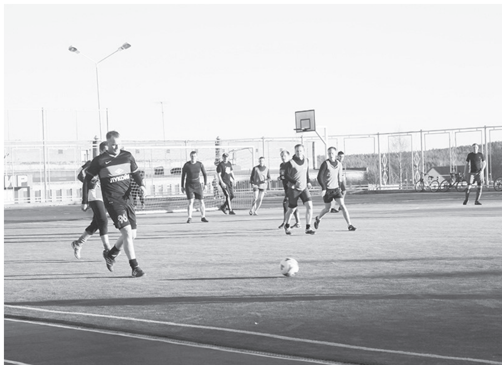
Момент встречи «Спартак» - «Учитель»