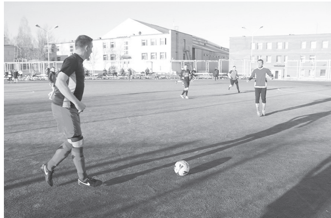
Эпизод матча «Спартак» - «Учитель»

Тем, кто играл в субботу, не повезло с погодой. Ночью прошёл дождь, и дренажная система поля не успела впитать всю влагу. При равном споре на первый план выходят физическая подготовка и правильно подобранная обувь, а вот при разнице в классе команд такие условия не особо мешают.