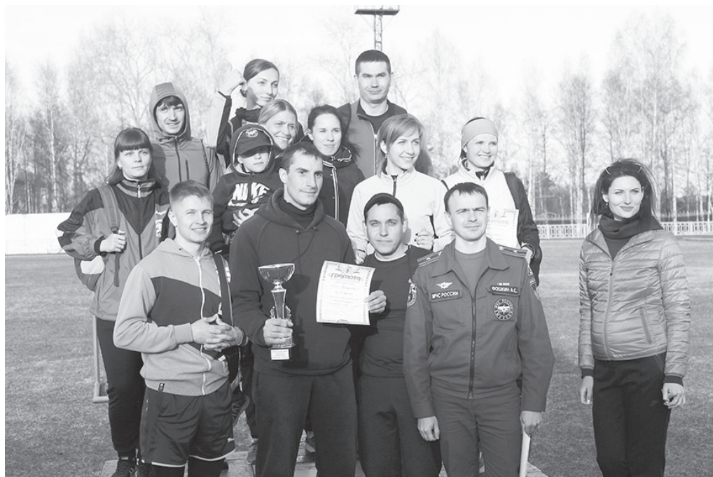
Главный кубок у команды «Прометей»