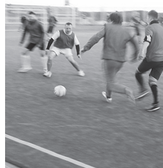
Играют «Высота» и «Коннект»

АДМИНИСТРАЦИЯ СДЮСШОР «ФАКЕЛ», г. Лесной