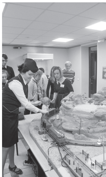
«Пионерская» железная дорога