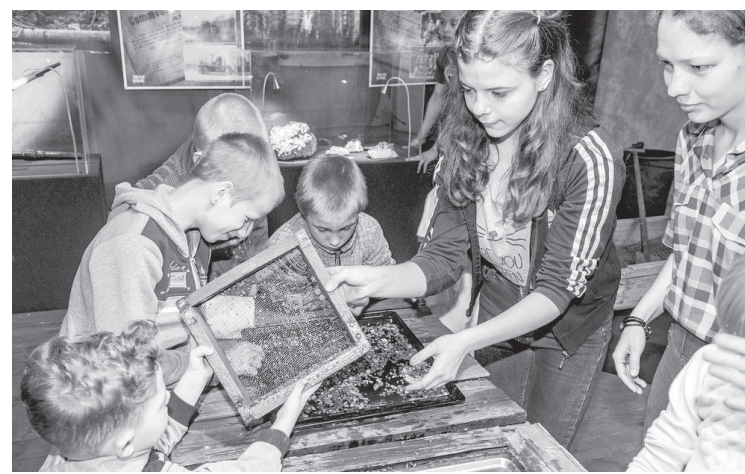
Импровизированный старательский прииск

И. МАТВЕЕВА, заведующая Нижнетуринским краеведческим музеем