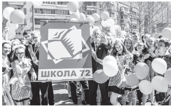
«Последний звонок!» — и радостно, и волнительно...