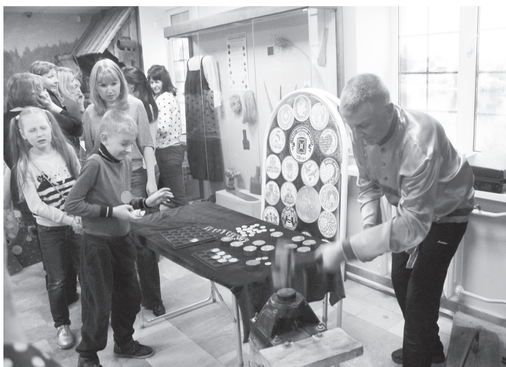
Кузнец штампует монетки ударом кувалды

В зале «История города» расположился рабочий стол первого директора нашего основного предприятия, на противоположной стене — карта города Лесного, цвет мерцающих на ней лампочек означает годы застройки того или иного района города. Угол слева напоминает угол лагеря сталинской эпохи с традиционным