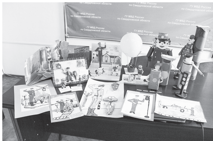
Работы юных участников конкурса

Детям было необходимо приготовить свою творческую поделку, где отражался бы облик сотрудника органов правопорядка со времён Российской империи до наших дней. В конкурсе