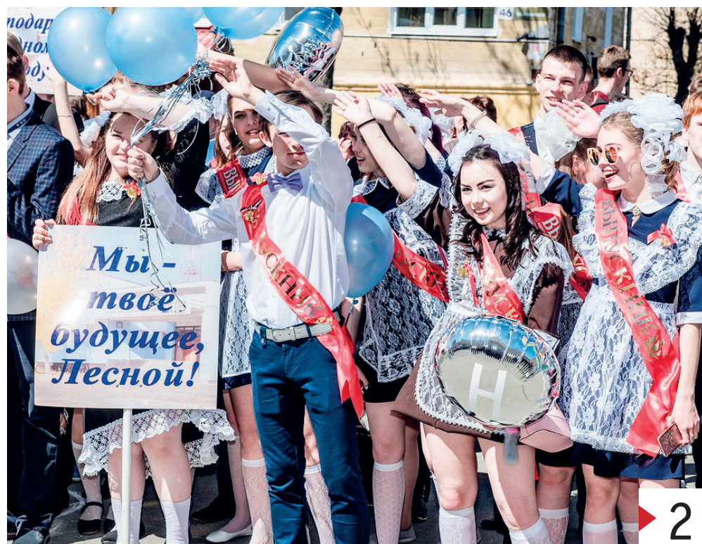
Для выпускников-2018 Лесного и Нижней Туры прошли праздники «Последнего звонка».