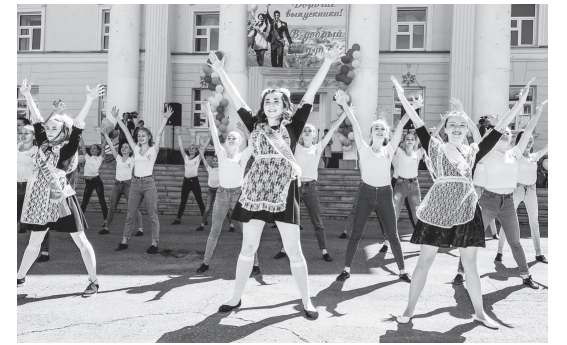
Площадь ЦДТ, праздник продолжается!

На площади Центра детского творчества ребят и их педагогов приветствовали заместитель главы администрации городского