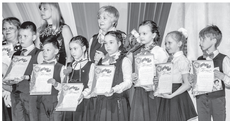
Умники и умницы Лесного