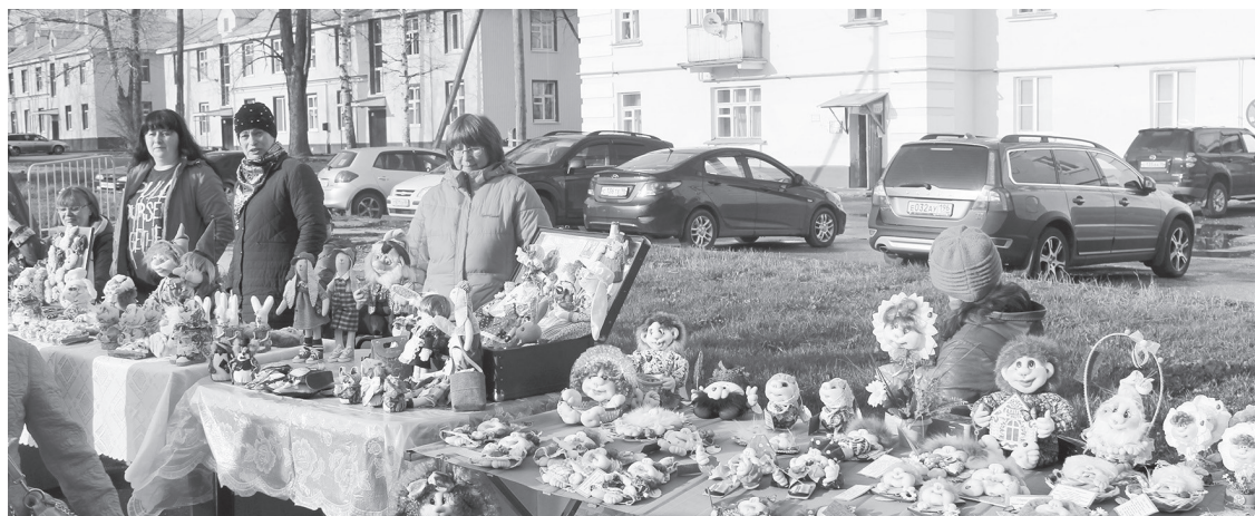
Торговые ряды с изделиями местных мастеров

В «Зале геологии» можно узнать краткую историю геологического