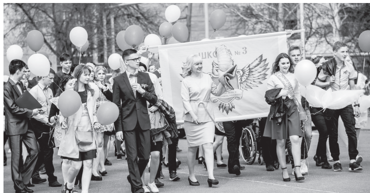
Эмоции переполняют виновников торжества, Нижняя Тура, 23.05.2018 г.