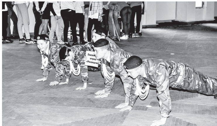
Отряд «Разведчик» проходит один из этапов квеста

19 МАЯ, В ДЕНЬ ДЕТСКИХ И МОЛОДЁЖНЫХ ОБЩЕСТВЕННЫХ ОРГАНИЗАЦИЙ, В ДОМЕ ТВОРЧЕСТВА И ДОСУГА МОЛОДЁЖИ «ЮНОСТЬ» Г. ЛЕСНОГО ПРОШЁЛ XIII ФЕСТИВАЛЬ «ПРОДВИЖЕНИЕ».