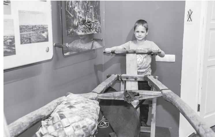
Зал истории завода. Соха позапрошлого века

панорамы); книги с автографами авторов. Посетители «Ночи музеев» проявили большой интерес к выставке, долго разглядывали и даже фотографировали отдельные экземпляры.