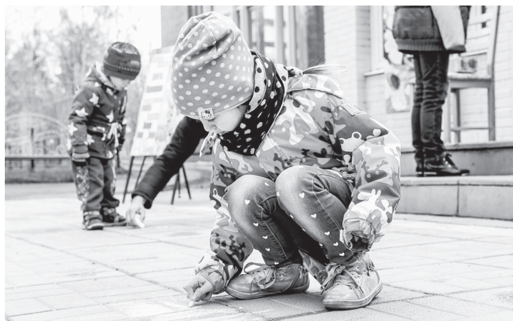
г. Лесной, ПКЮ, конкурсе рисунков на асфальте

С утра погода не радовала, и поэтому в Парке культуры и отдыха