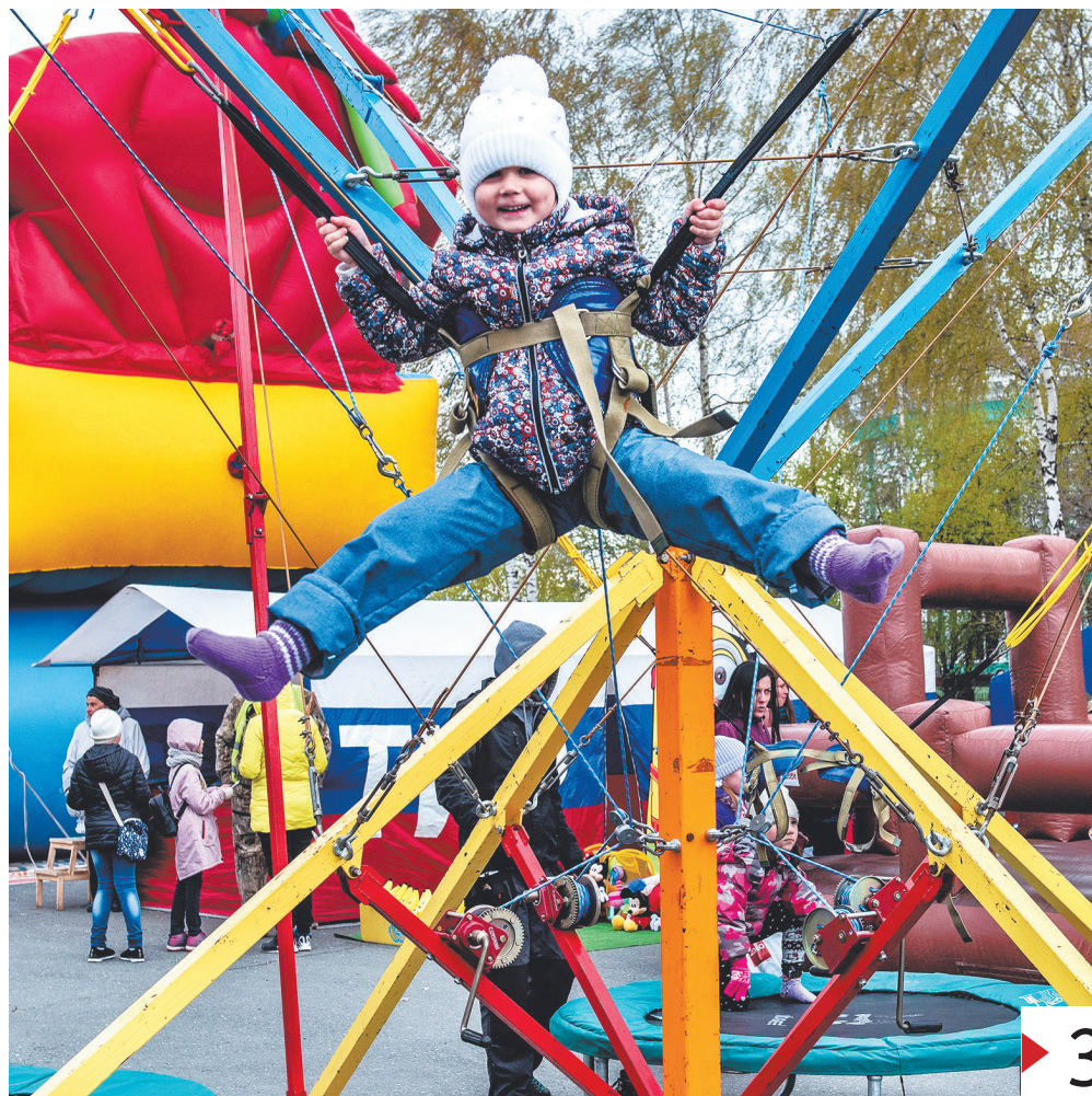
Погода пасмурная — настроение солнечное.