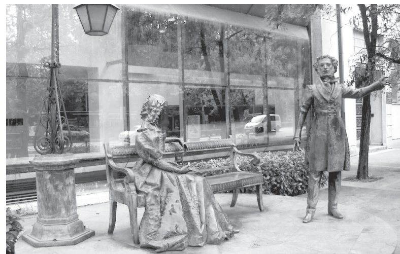
Подгорица. Памятник А.С. Пушкину

В 12 км от Котора расположен ещё один уникальный город — Пераст (1,5 тыс. чел.). Некогда небольшое рыбацкое поселение и убежище пиратов, Пераст со временем превратился в город-легенду, в котором жили умелые мореплаватели и храбрые воины. Пераст расположен напротив единственного вхо-