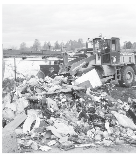
Свалка на ул. Мамина-Сибиряка ликвидирована