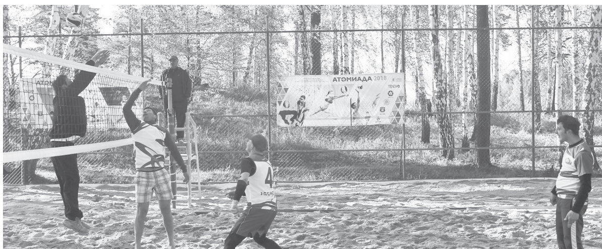
Пляжный волейбол. Решающая партия матча «Лесной — Озёрск»