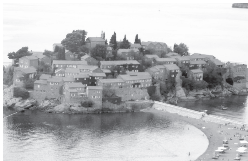
Вид на Свети-Стефан

да очень почитаема в городе, и в память об этом удивительном событии было решено возвести остров прямо в море. Был принят специальный закон, согласно которому рядом с островом затопились старые суда и всякое судно, идущее мимо острова, бросало в этом месте на дно камень. Эта традиция жива по сей день, но уже в виде празд-