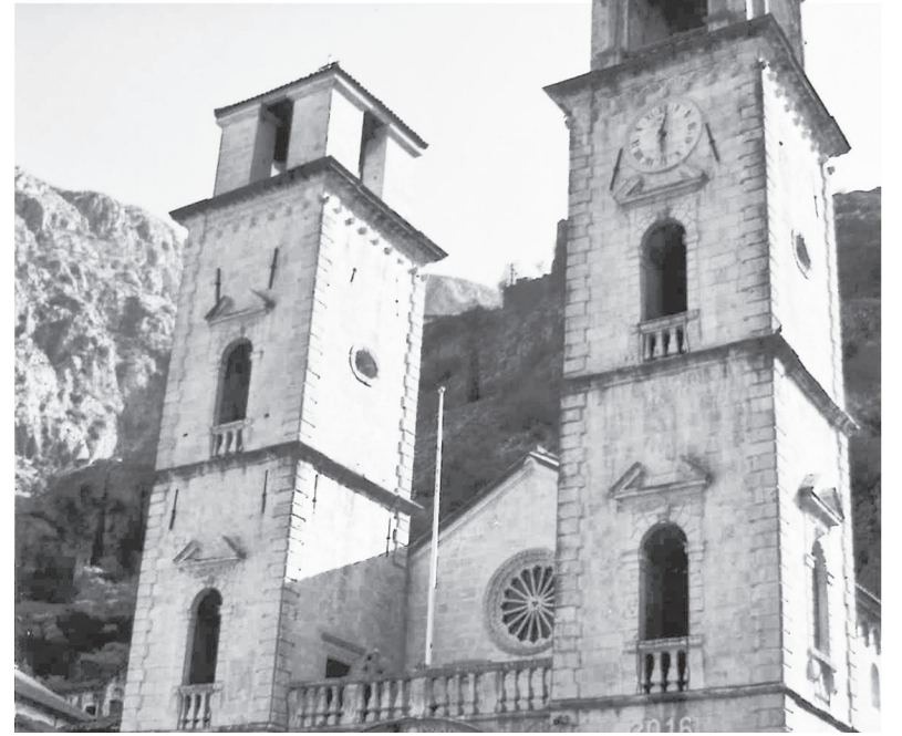
Котор. Собор Святого Трипуна (Трифона)

Водное такси (5 евро) от побережья Пераста за считанные минуты доставляет нас к единственному во всём Адриатическом море (Jadransko more) рукотворному острову Госпа-од-Шкрпье (Gospa od Škrpjela), название которого можно перевести как «Богородица Утёса». Согласно легенде, на рифе, находившемся на этом месте, двое братьев-моряков из Пераста нашли чудотворную икону Божьей Матери, которая помогла одному из них излечиться от болезни. Икона ста-